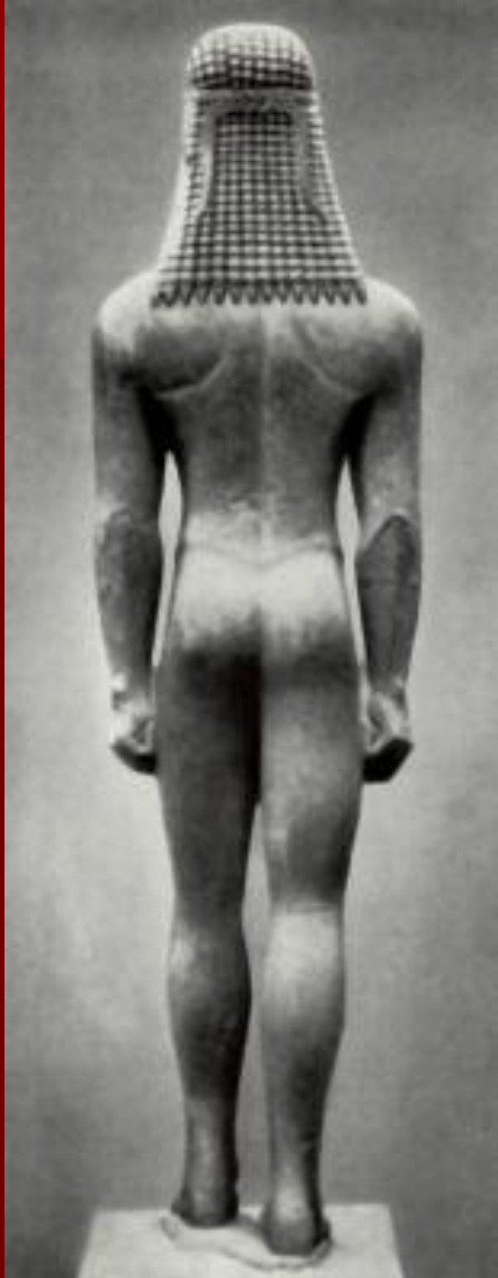
Курios из Атики Конец 7 века до н. Э. Мрамор