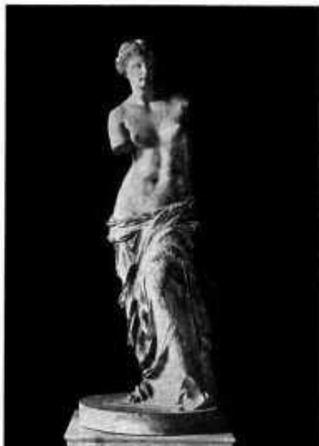
Meliská Afrodítē (Venus Milo).