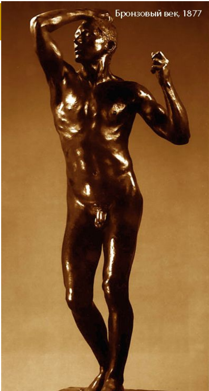
Бронзовый век, 1877

В 1871 он отправляется в Брюссель, где создает несколько скульптур для биржи и боковые фигуры для бургомистру Лоосу в парке Рубенса. Посещает Италию, параллельно продолжает самообразование в области средневекового искусства и творчества Рубенса. Посещает Италию, и в результате знакомства с творчеством Микеланджело возникает идея создания статуи «Бронзовый век».