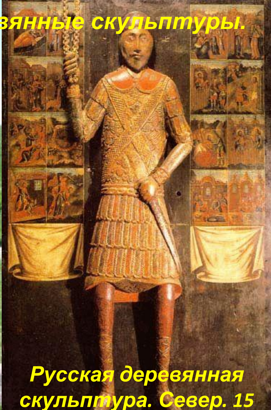
Русская деревянная скульптура. Север. 15