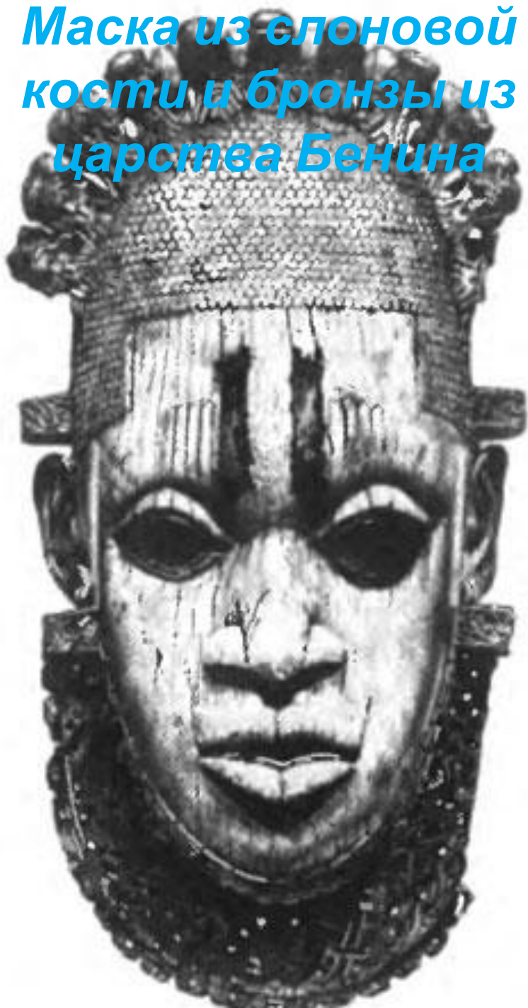
Маска из слоновой кости и бронзы из царства Бенина