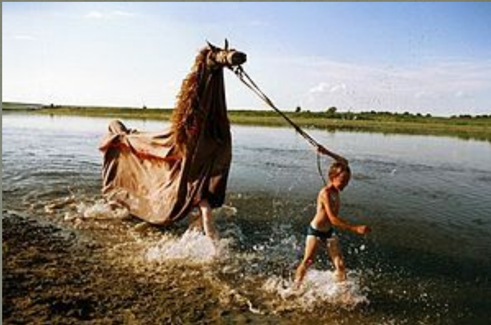
Обряд «Купание коня». Село Мурзицы, Нижегородская область