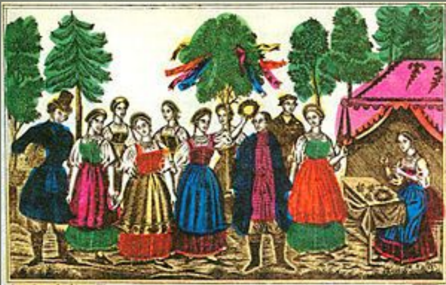
«Семик». Лубок. XIX век.