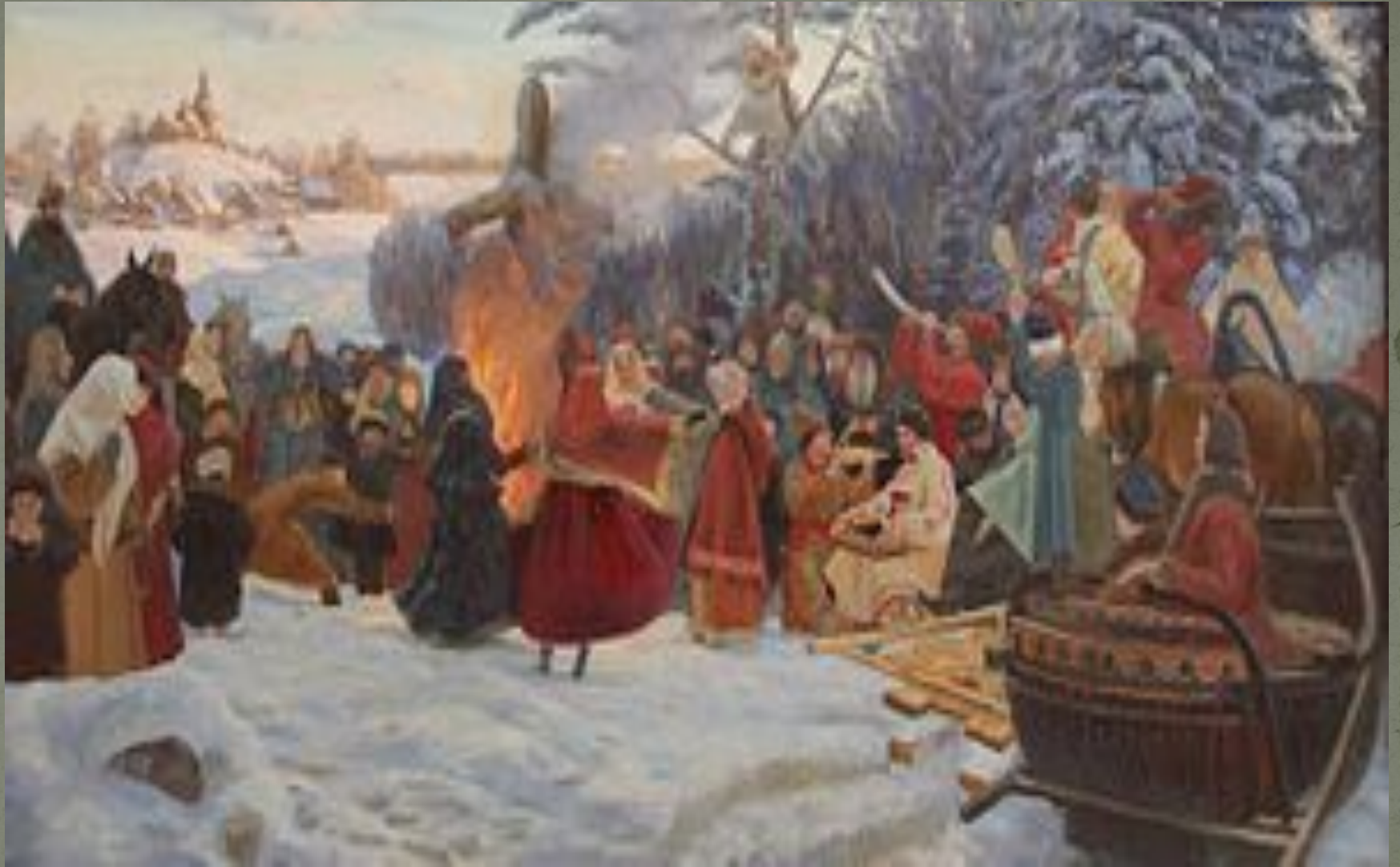
Картина С. Л. Кожин. Масленица в XVII веке. 2001 г.