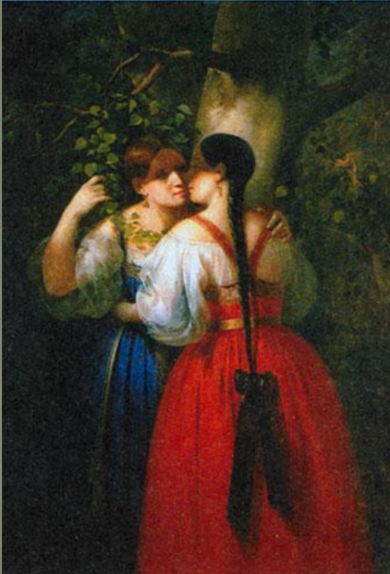
Две девушки в день Семика. Д. Осипов