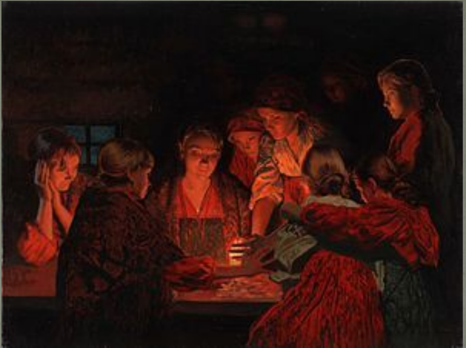
С. Л. Кожин. Святочное гадание. 2008