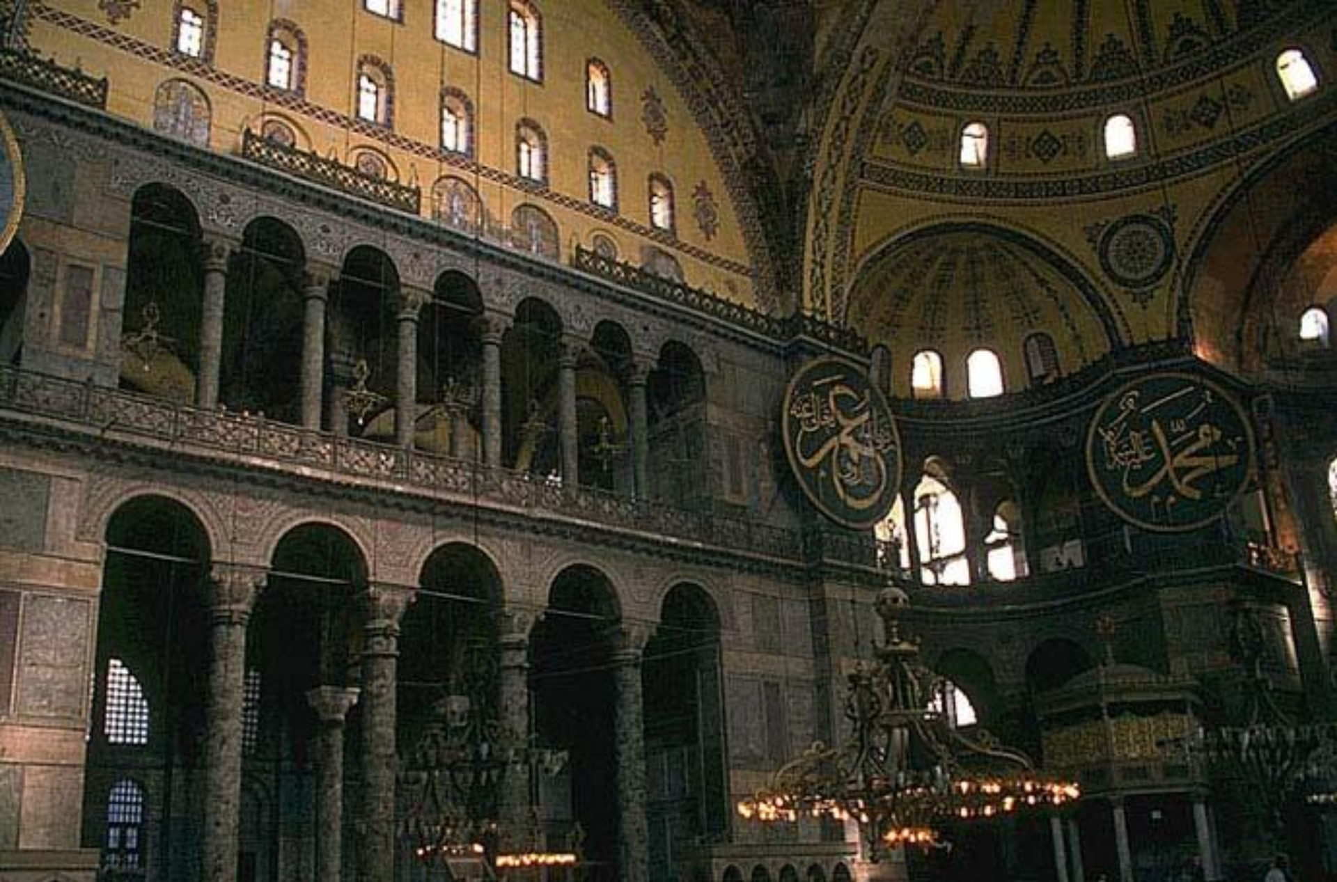
Гигантская купольная система собора стала шедевром архитектурной мысли своего времени.