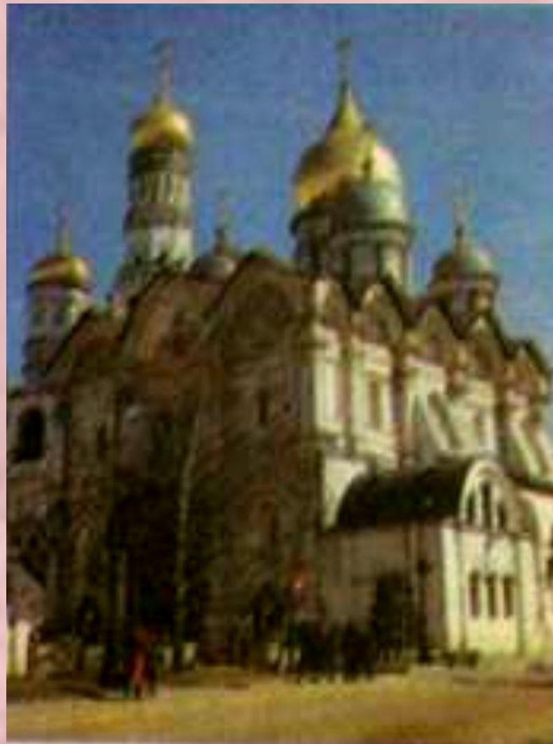
Архангельский собор Московского Кремля ★ Архитектор: Алевиз Новый.

★ Этот собор стал ★ усыпальницей русских ★ князей и царей. В нем ★ покоится прах Ивана ★ Калиты, Дмитрия ★ Донского, Ивана ★ Грозного, Михаила и ★ Алексея Романовых.★