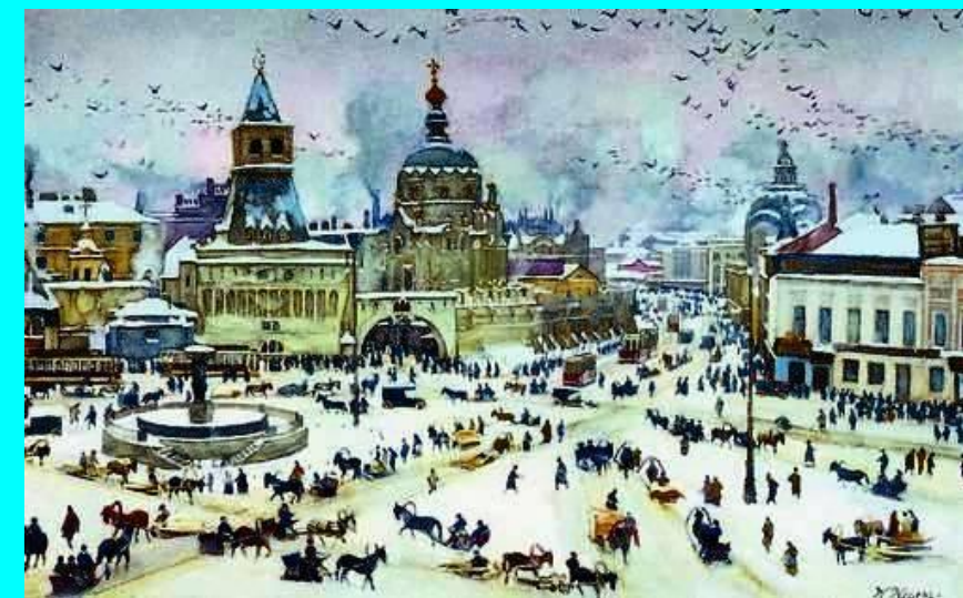
«Лубянская площадь зимой», 1905г.