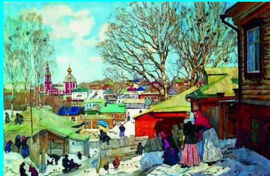
«Весенний солнечный день», 1910г.