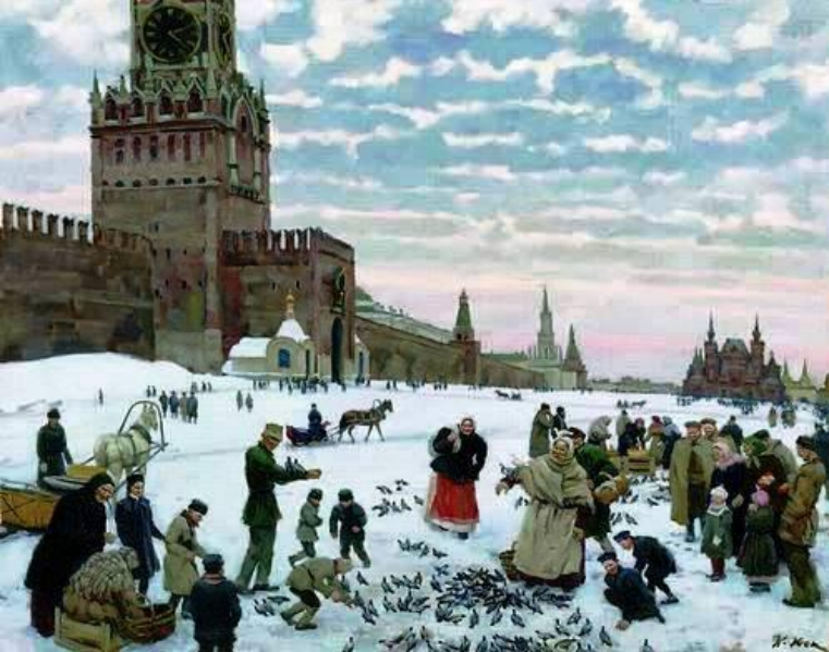
«Кормление голубей на Красной площади»