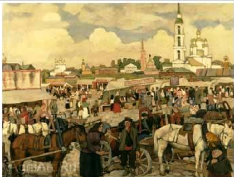
«Базар в Угличе»