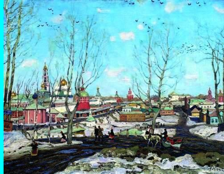
«Весна в Троицкой лавре», 1911г.