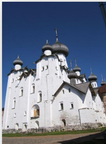
Спасо- Преображенский собор