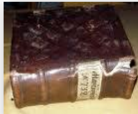
Книга из Соловецкого монастыря

В монастыре имелась огромная библиотека.