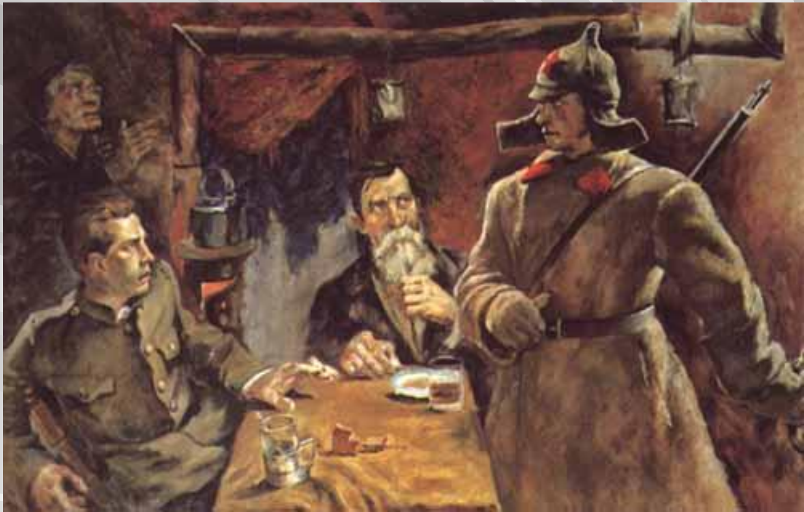
Соколов-Скаля П. «Братья»