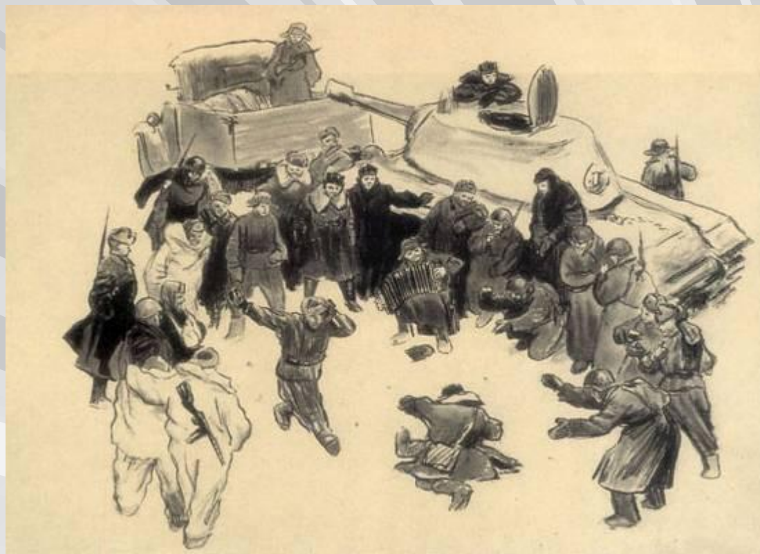
Гармонь. Верейский О.Г. 1943