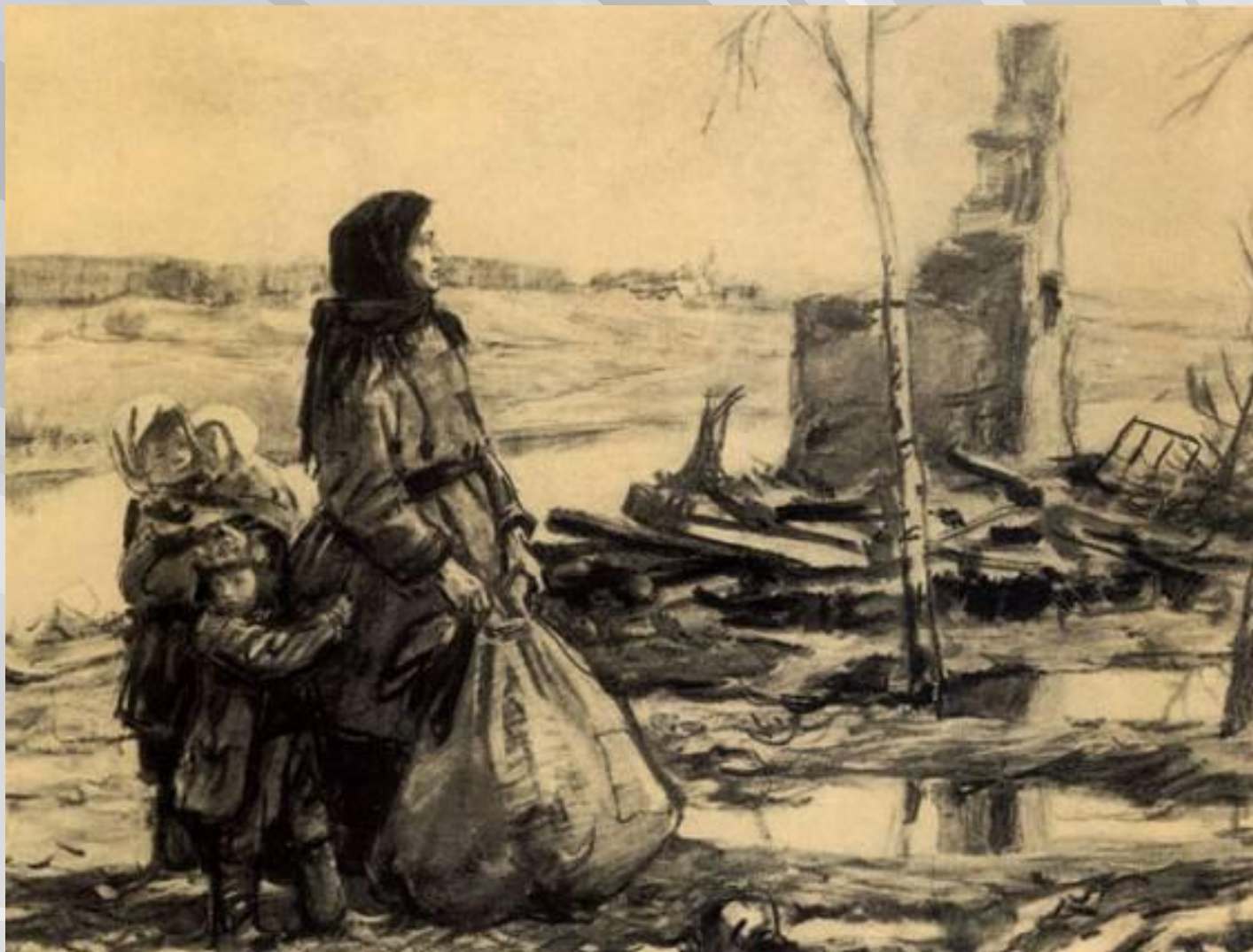
Д.Шмаринов. «Не забудем, не простим»