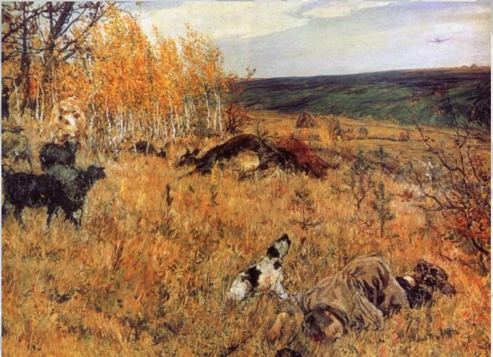
Пластов А. «Фашист пролетел» 1942