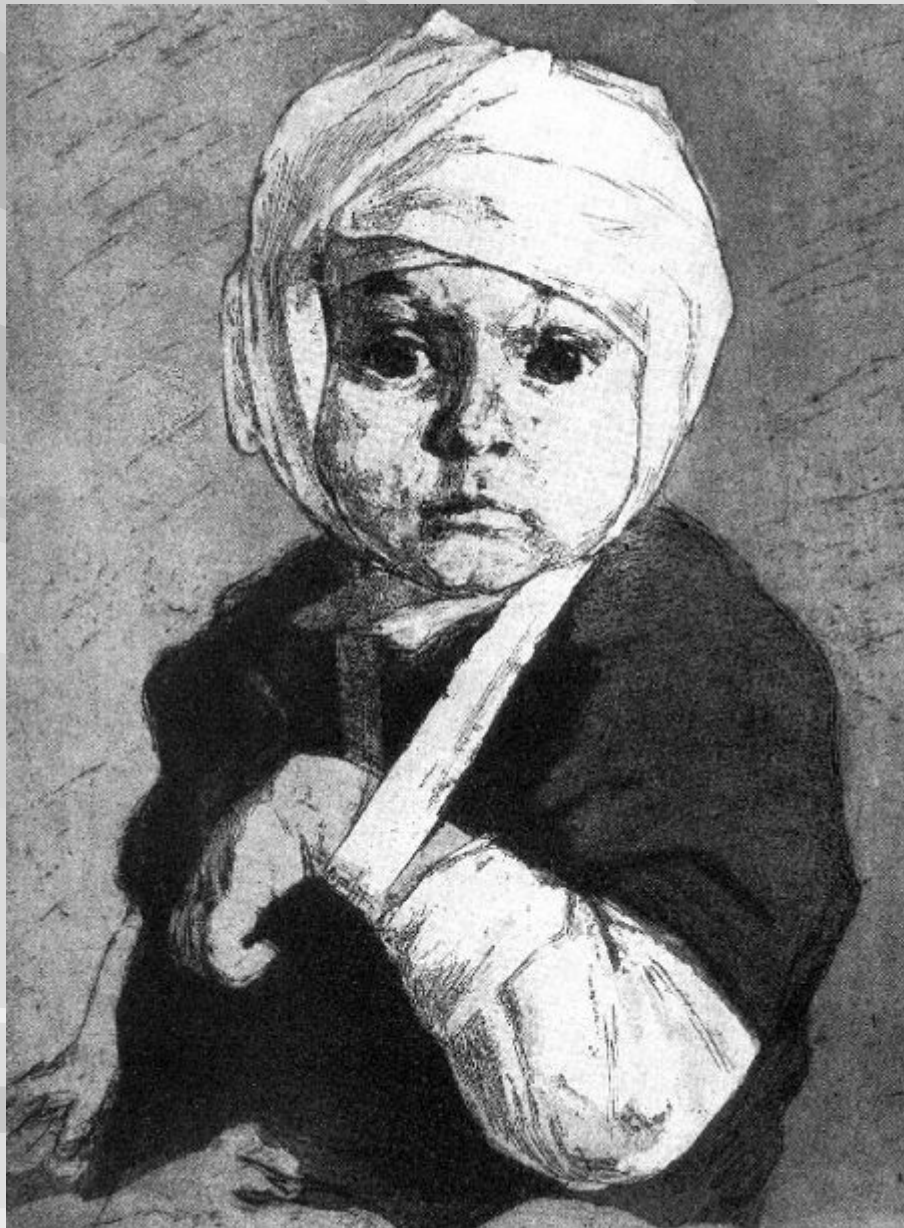
Харшак А. «За что?» (Раненый ребенок) 1942