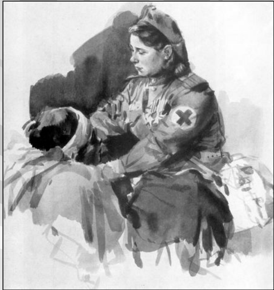
«Ласковые руки» Климашин. В. С.