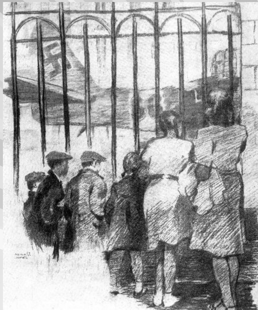
Пименов Ю. «У решетки» 1942