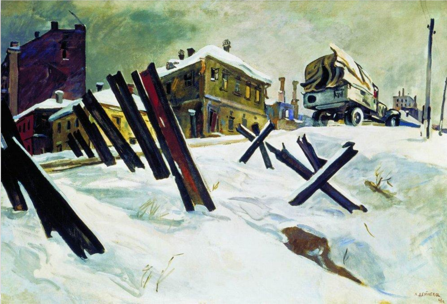
Дейнека А. «Окраина Москвы. Ноябрь 1941 года»