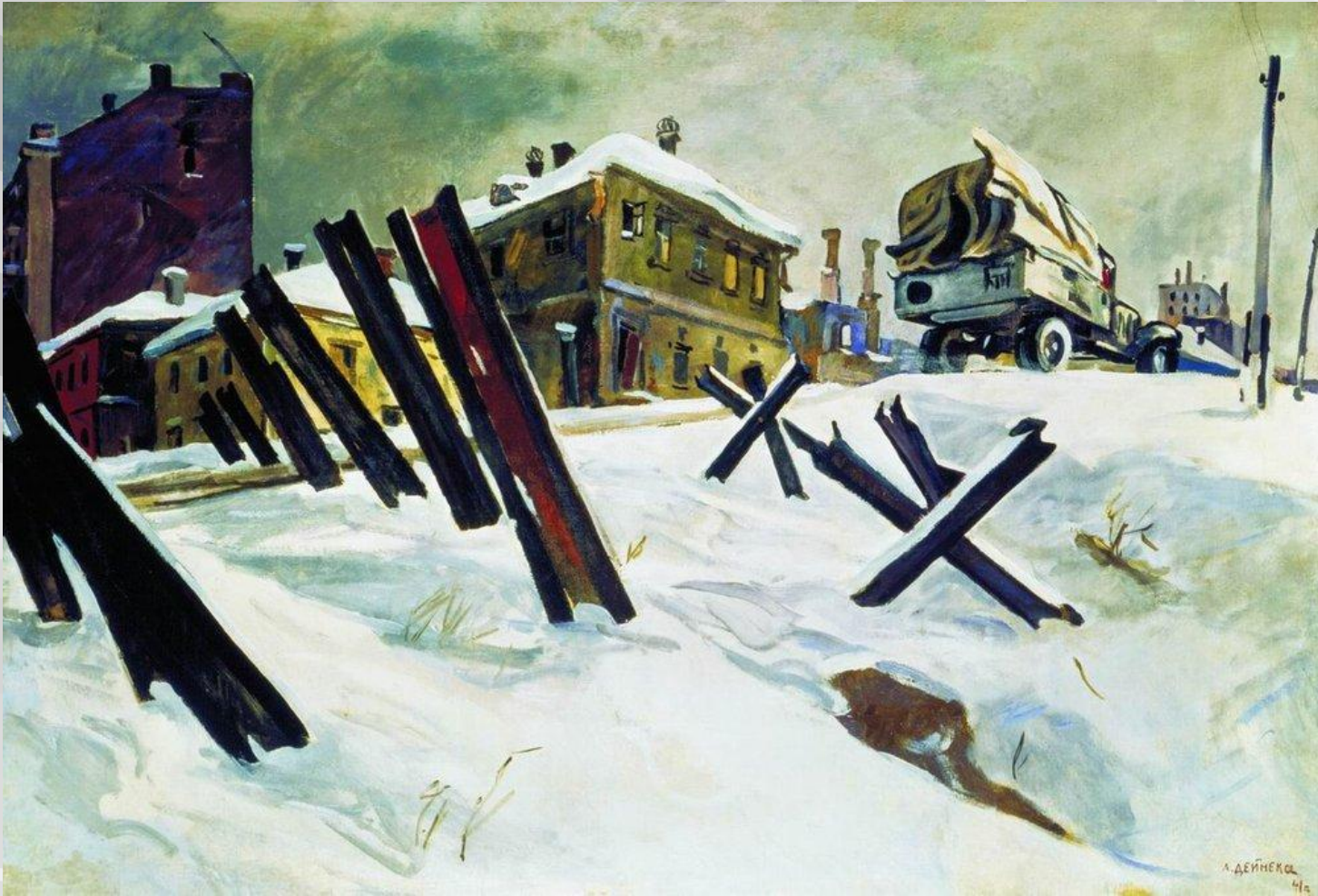
Дейнека А. «Окраина Москвы. Ноябрь 1941 года»