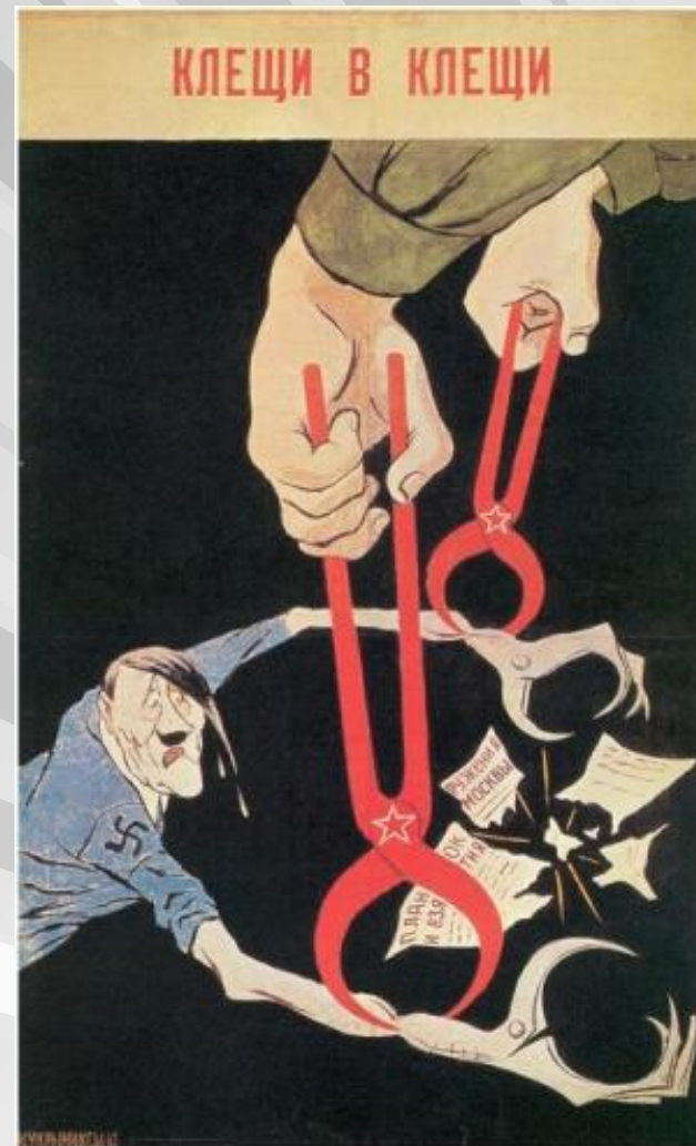
Кукрыниксы. «Клещи в клещи»