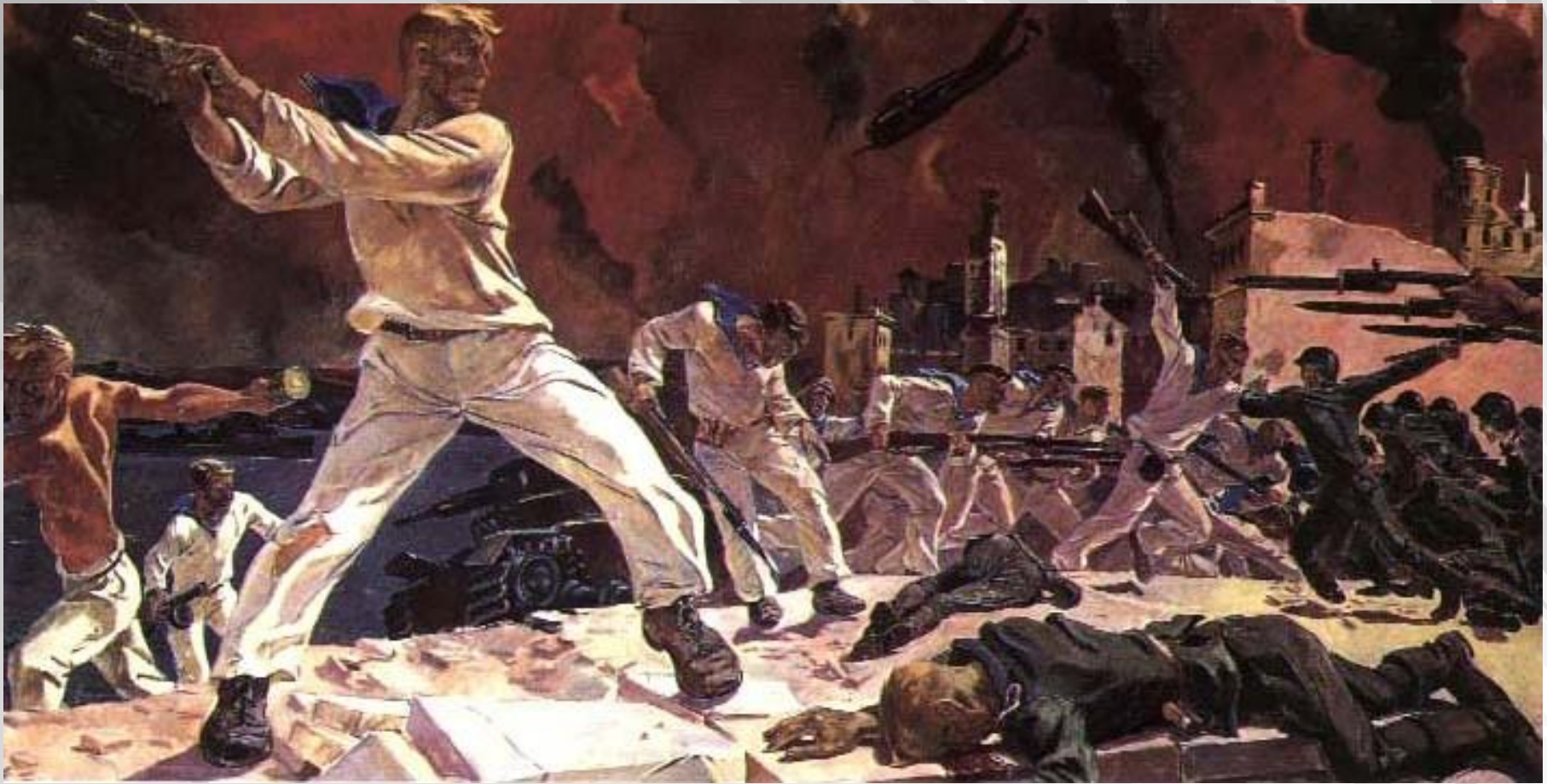
Дейнека А. «Оборона Севастополя» 1942