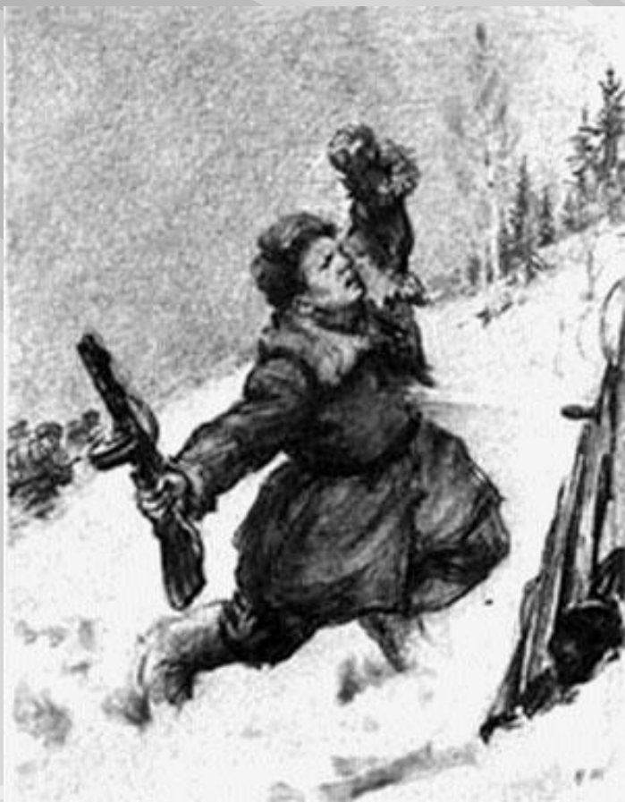
Н. Жуков «Подвиг Александра Матросова»