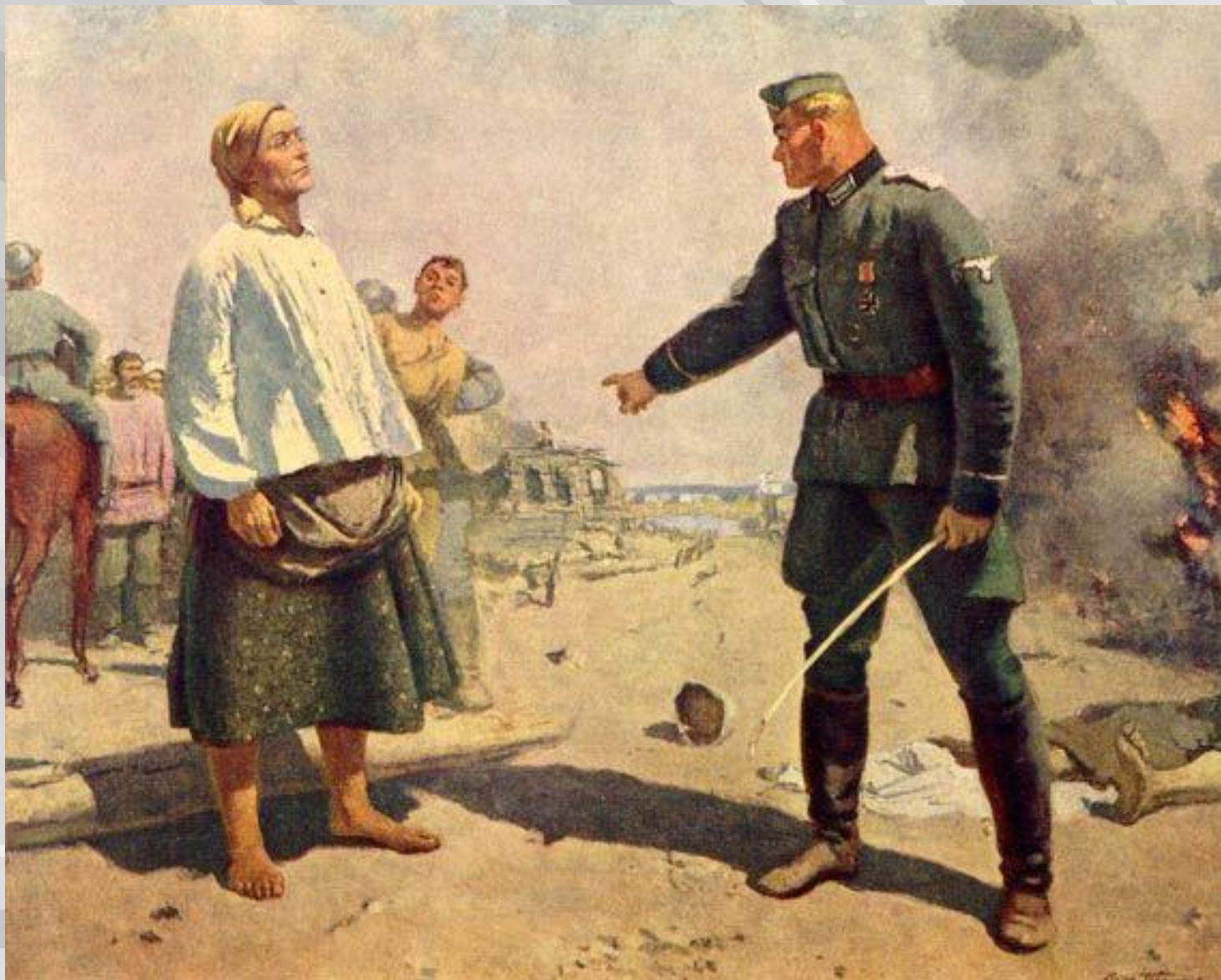
Герасимов С. «Мать партизана» 1943