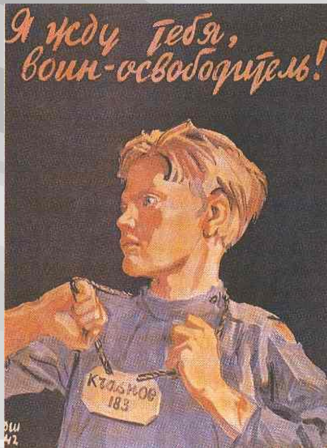
Д. Шмаринов. 1942