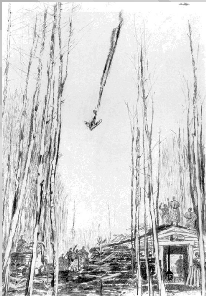
Пименов Ю. «Сбитый фашистский самолет. Северо-Западный фронт.» 1943