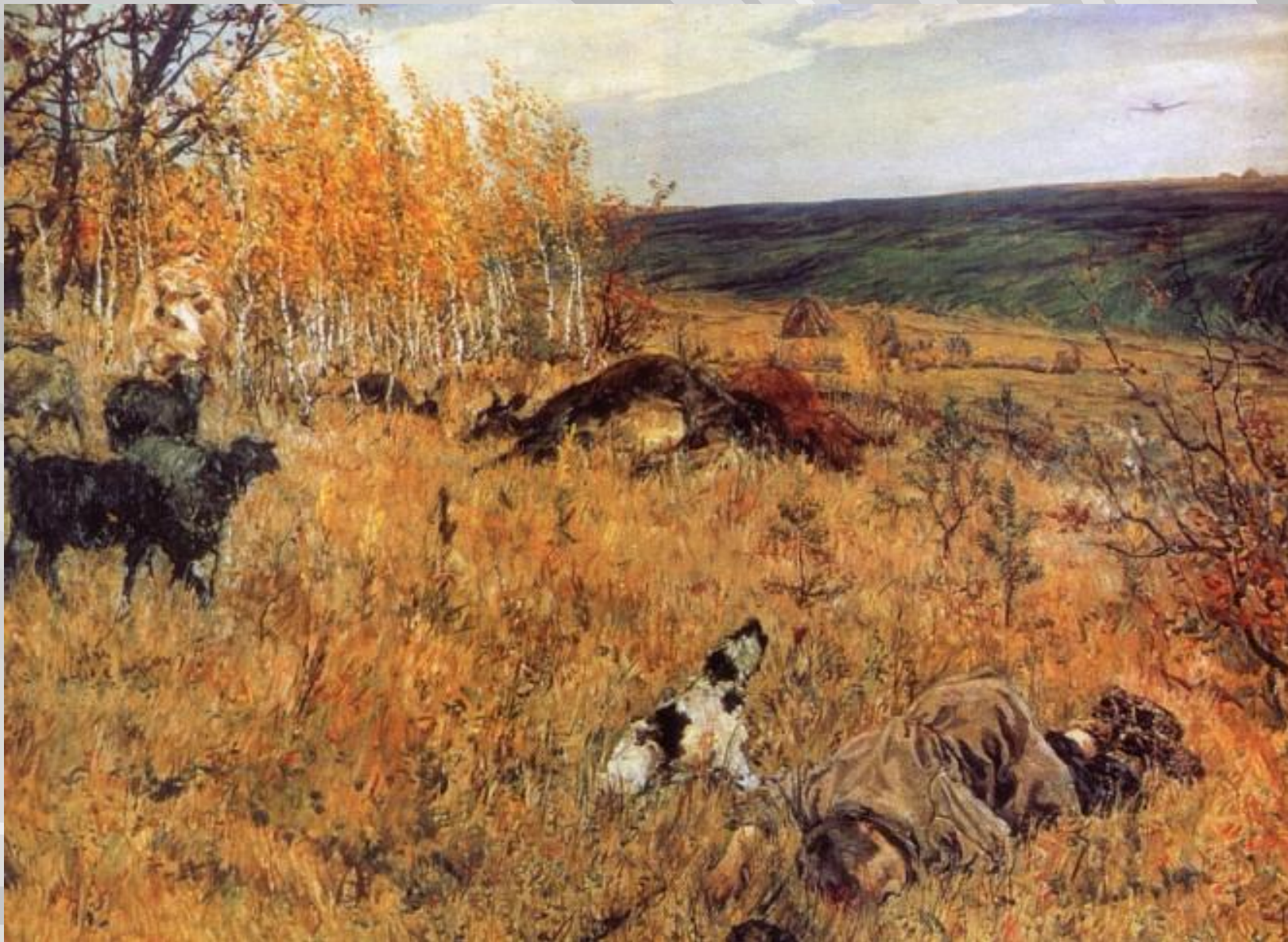
Пластов А. «Фашист пролетел» 1942