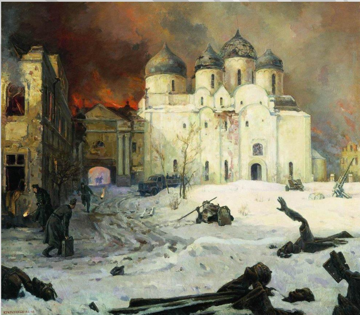
Кукрыниксы «Бегство фашистов из Новгорода» 1944-1946