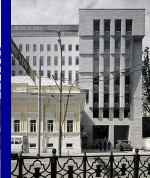
Лучшие здания современной Москвы по мнению ведущих архитектурных критиков