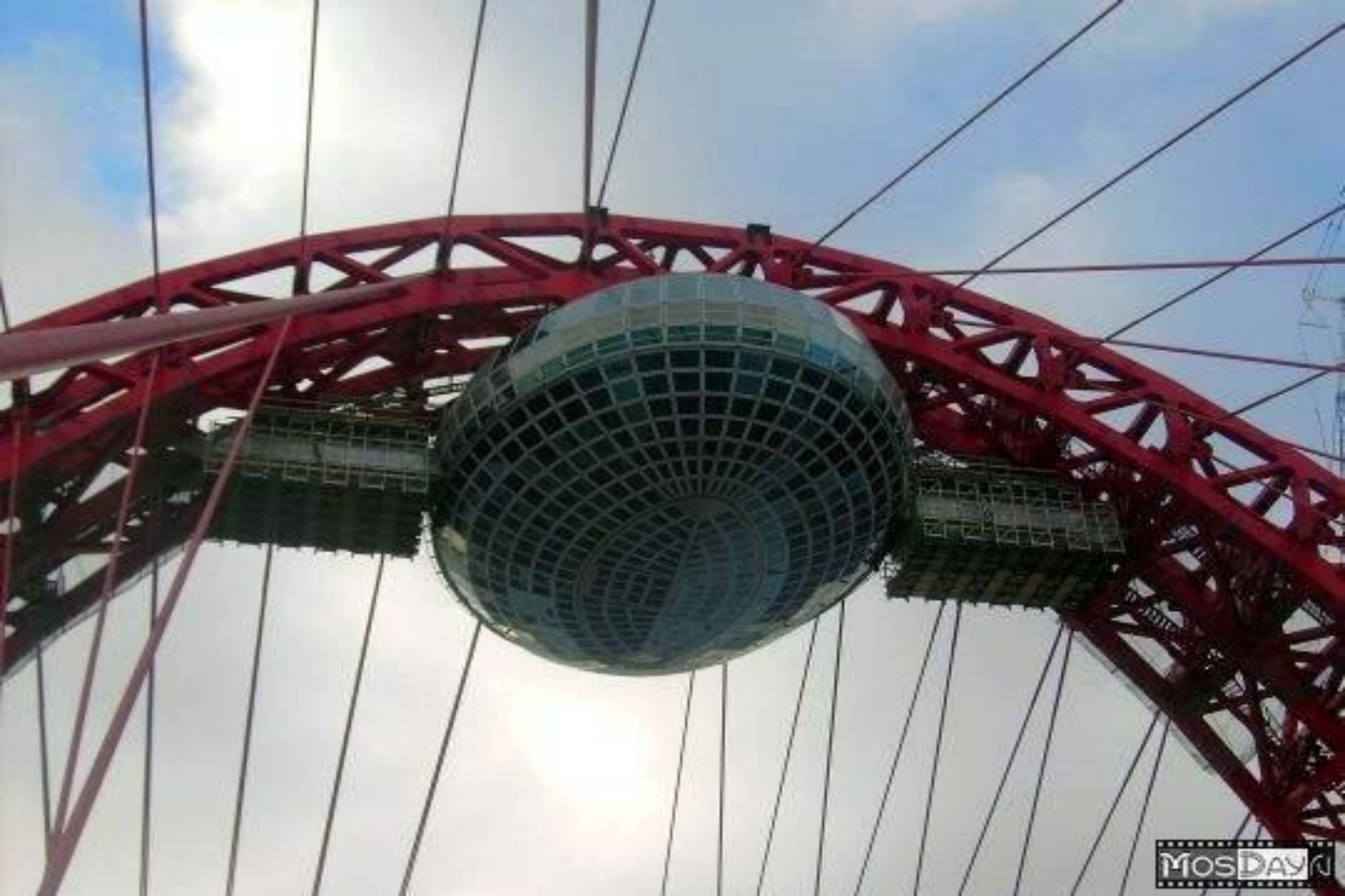
Пилон “Живописного моста” крупным планом вместе со строящимся рестораном и смотровой площадкой.