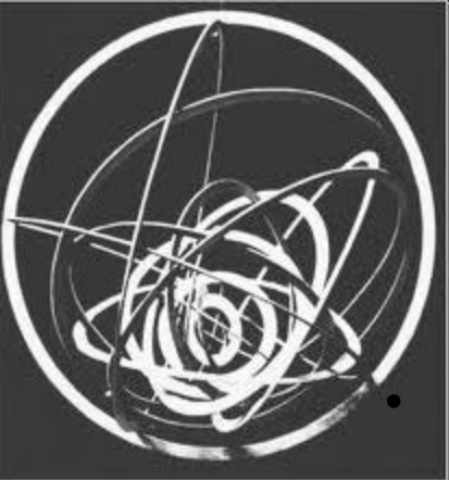
А. Родченко. Мобили