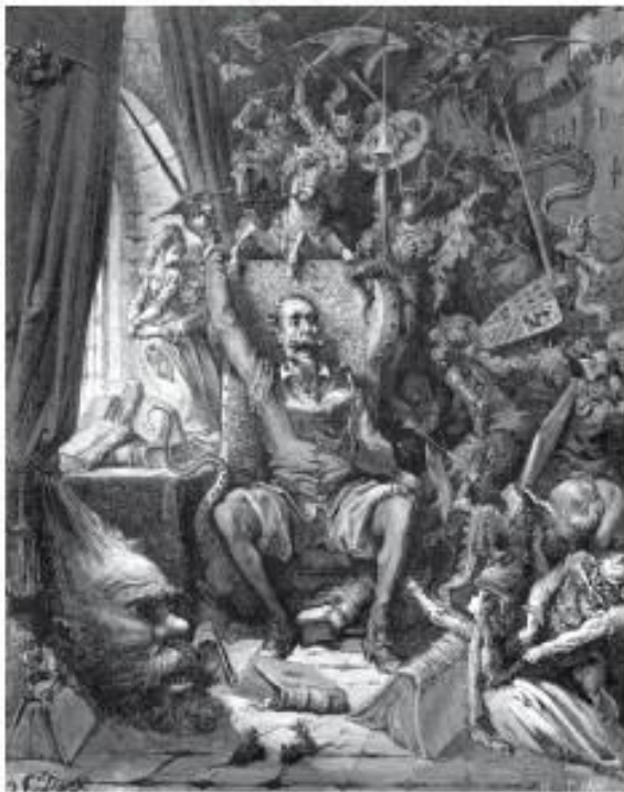
Г. Доре. Дон Кихот

Для многих поколений читателей «Робинзон Крузо» Д. Дефо неотделим от иллюстраций французского графика Гранвиля, а «Дон Кихот» М. Сервантеса, «Приключения барона Мюнхаузена» Р. Распе — от иллюстрации тоже французского графика Г. Доре.