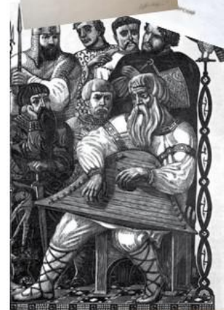
В. Фаворский. Повесть о полку Игореве...