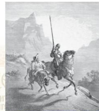
Г. Доре. Дон Кихот