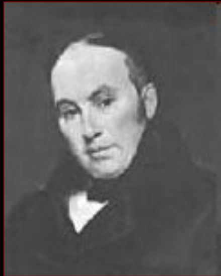
Василий Андреевич Жуковский (1783-1853)