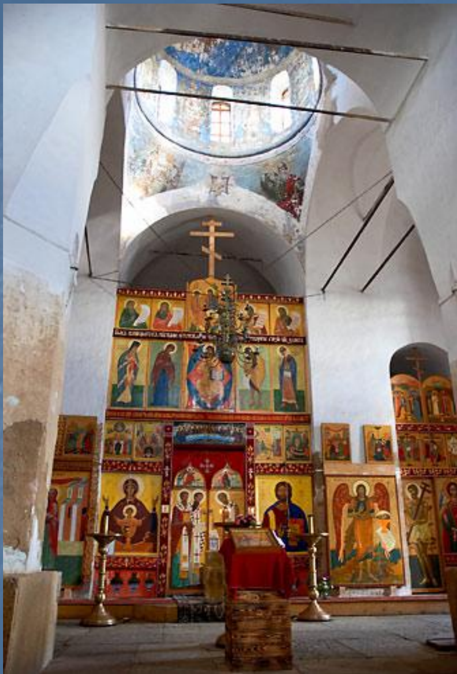
Иконостас Георгиевского храма. (современный вид)