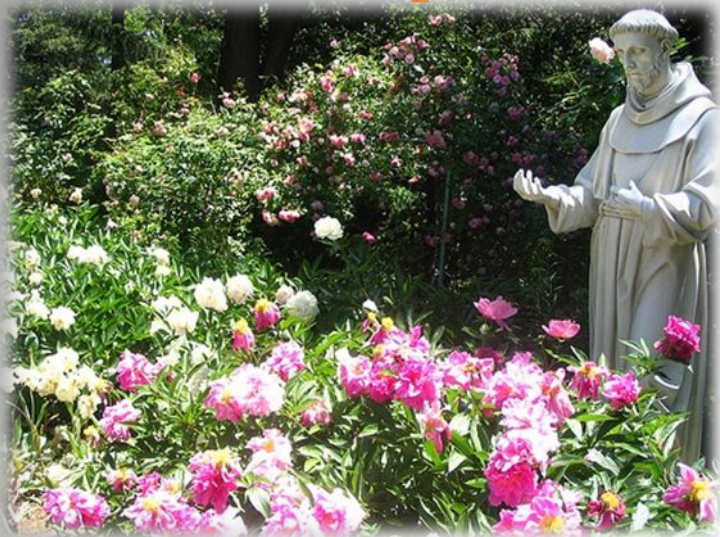
Монастырский тип сада