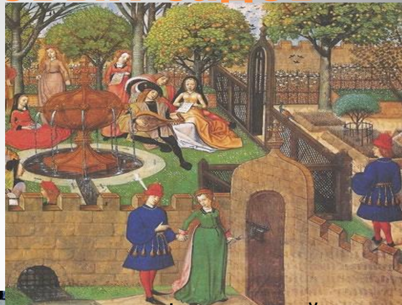
Феодалный тип сада