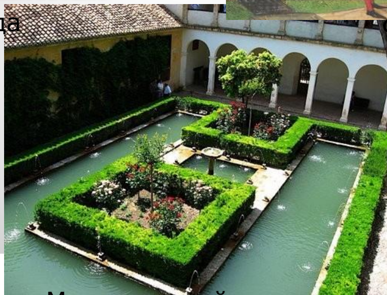
Мавританский тип сада