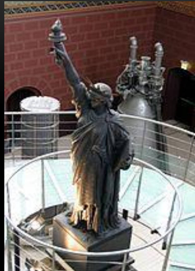
Экспонат парижского Музея искусств и ремёсел