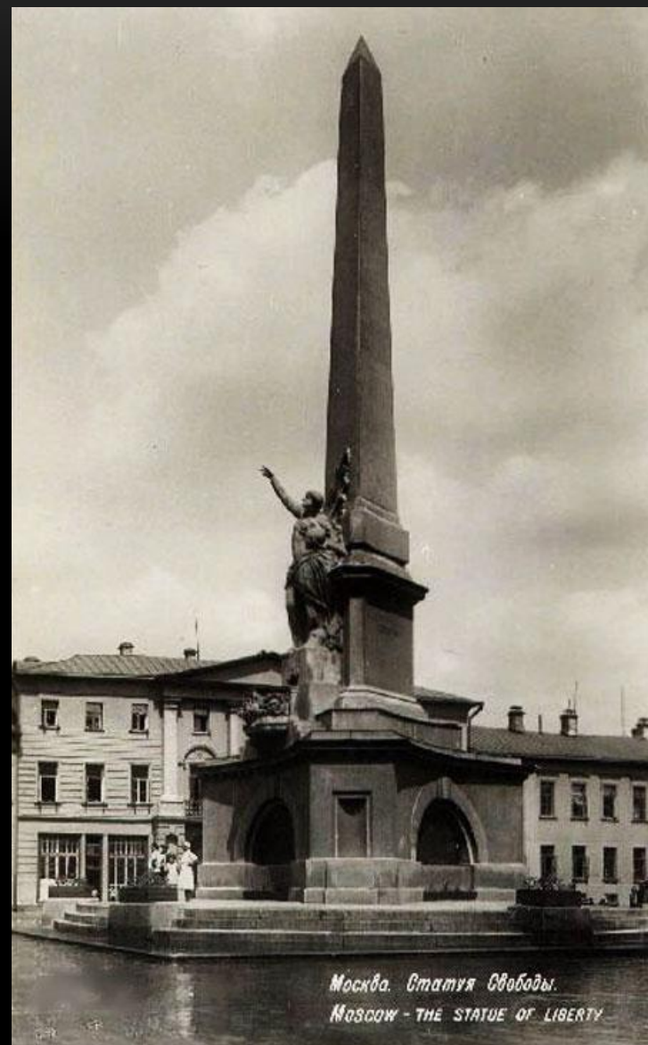
Москва. Статуя Свободы. MOSCOW - THE STATUE OF LIBERTY

22 апреля 1941 года, ветхий монумент был разрушен.