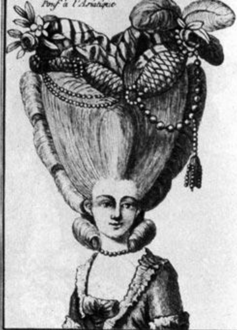
Pouf à l'Arabique