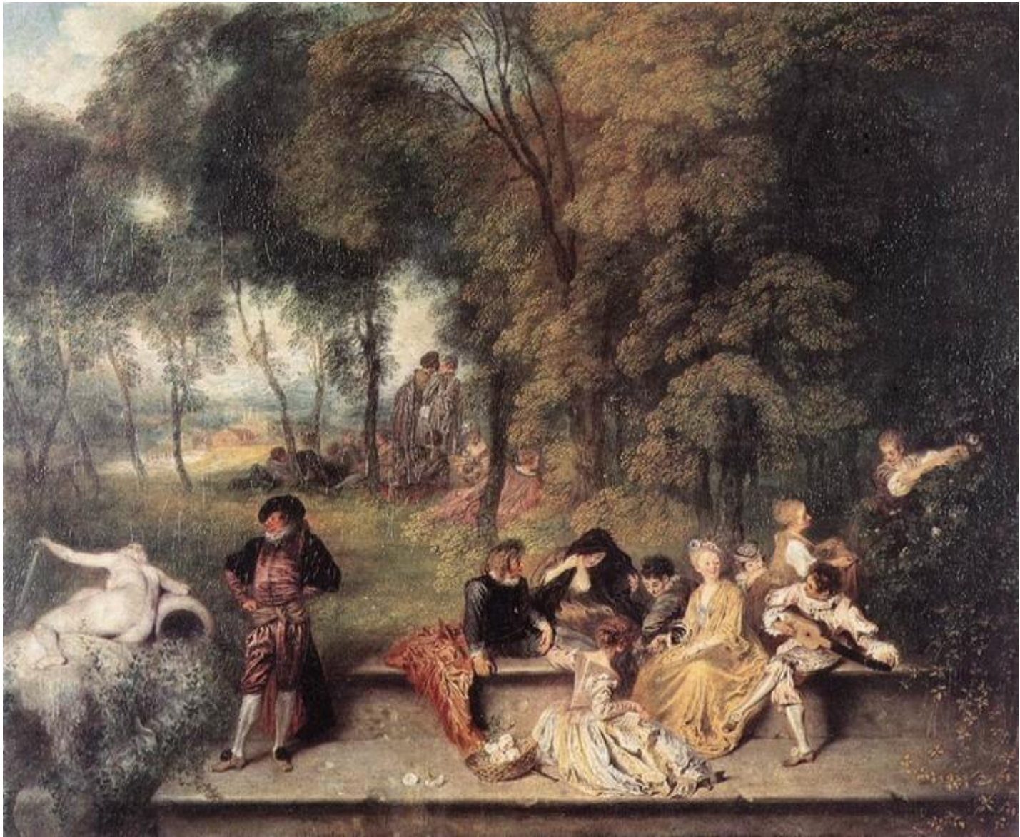
Общество в парке