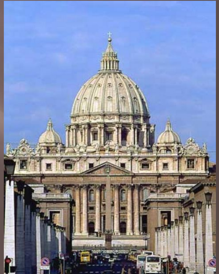
Собор Святого Петра в Риме Микеланджело