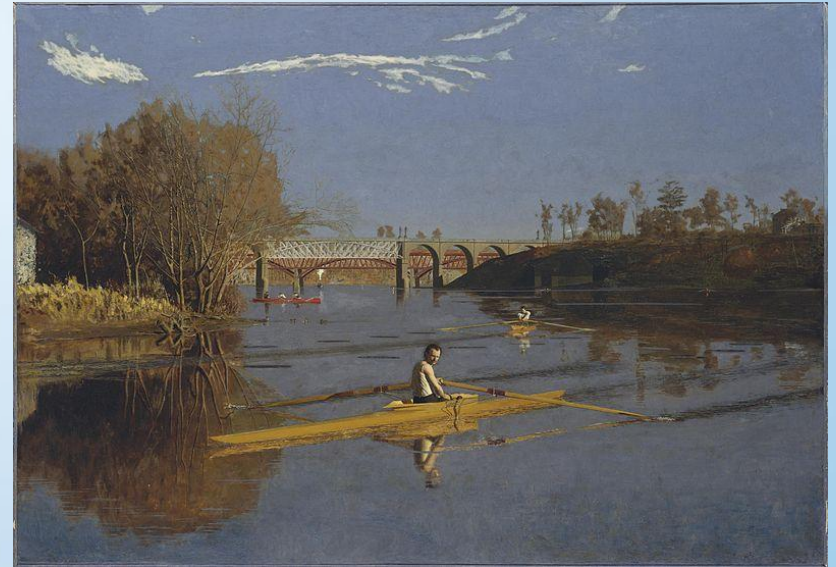
Томас Икинс. «Макс Шмитт в лодке»

Рождение реализма в живописи чаще всего связывают с творчеством французского художника Гюстава Курбе (1819—1877), открывшего в 1855 г. в Париже свою персональную выставку «Павильон реализма». В 1870-е гг. реализм разделился на два основных направления — натурализм и импрессионизм .