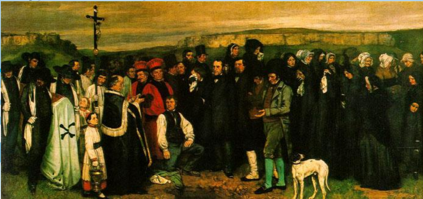
Гюстав Курбе. "Похороны в Орнани". 1849-1850 гг.