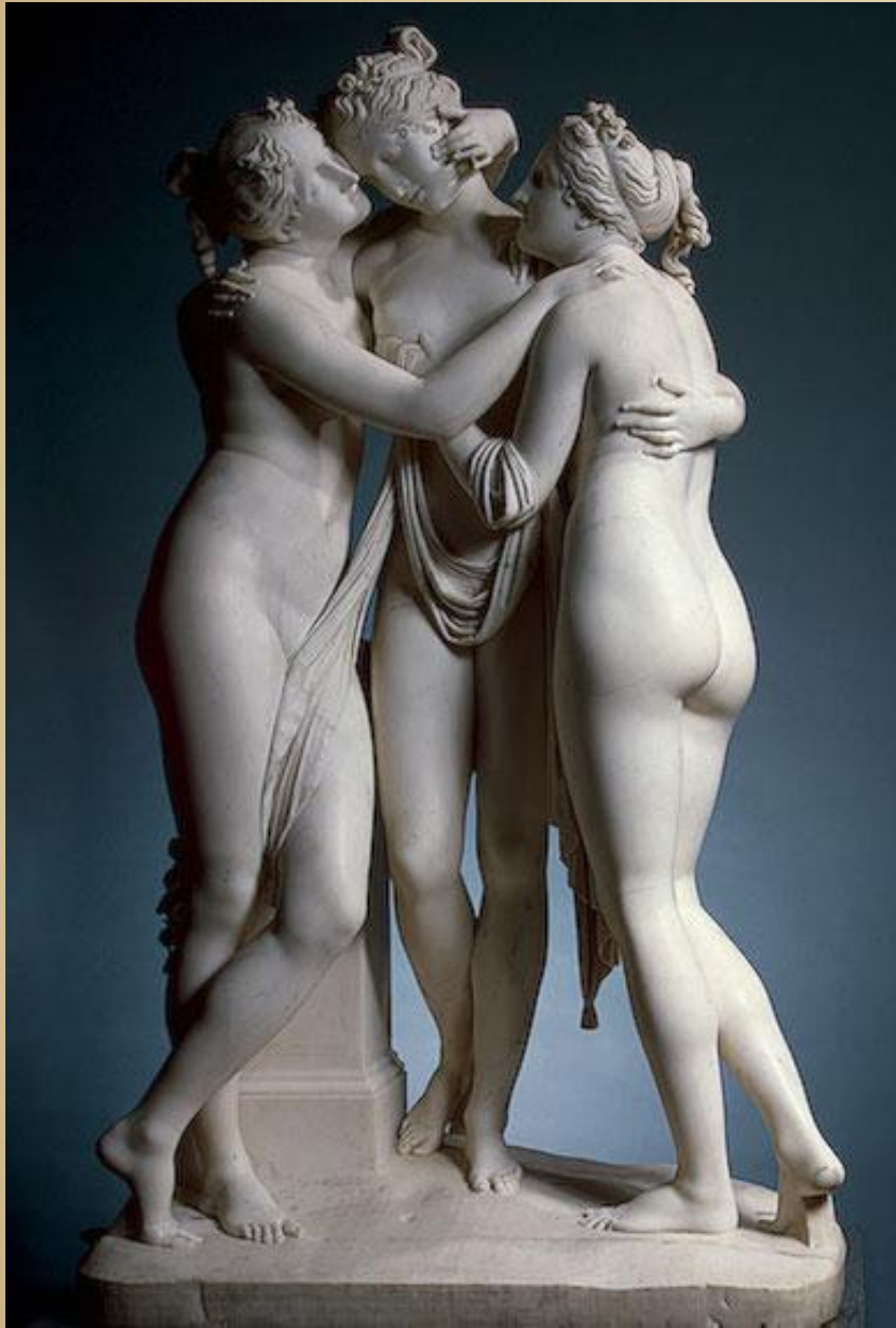
Антонио Канова Три Грации Музей Эрмитаж, Санкт-Петербург