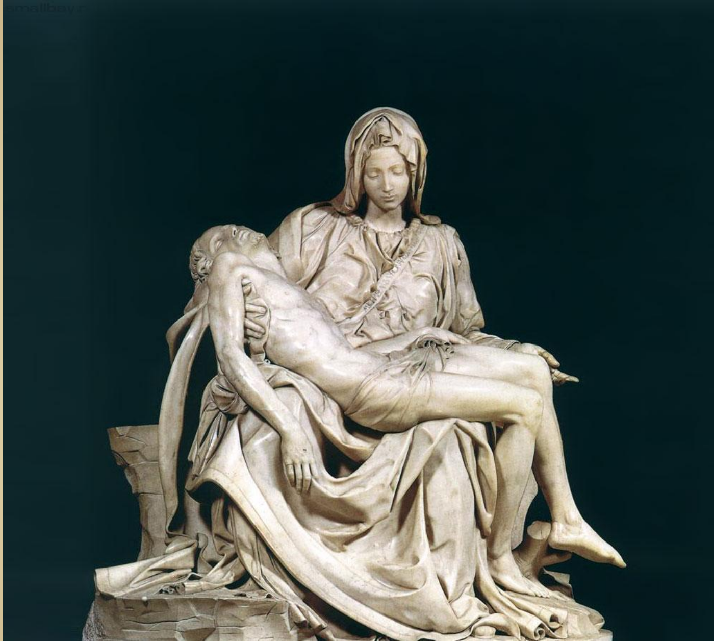
Микеланджело Пьета, 1497-1499, Собор св.Петра, Рим