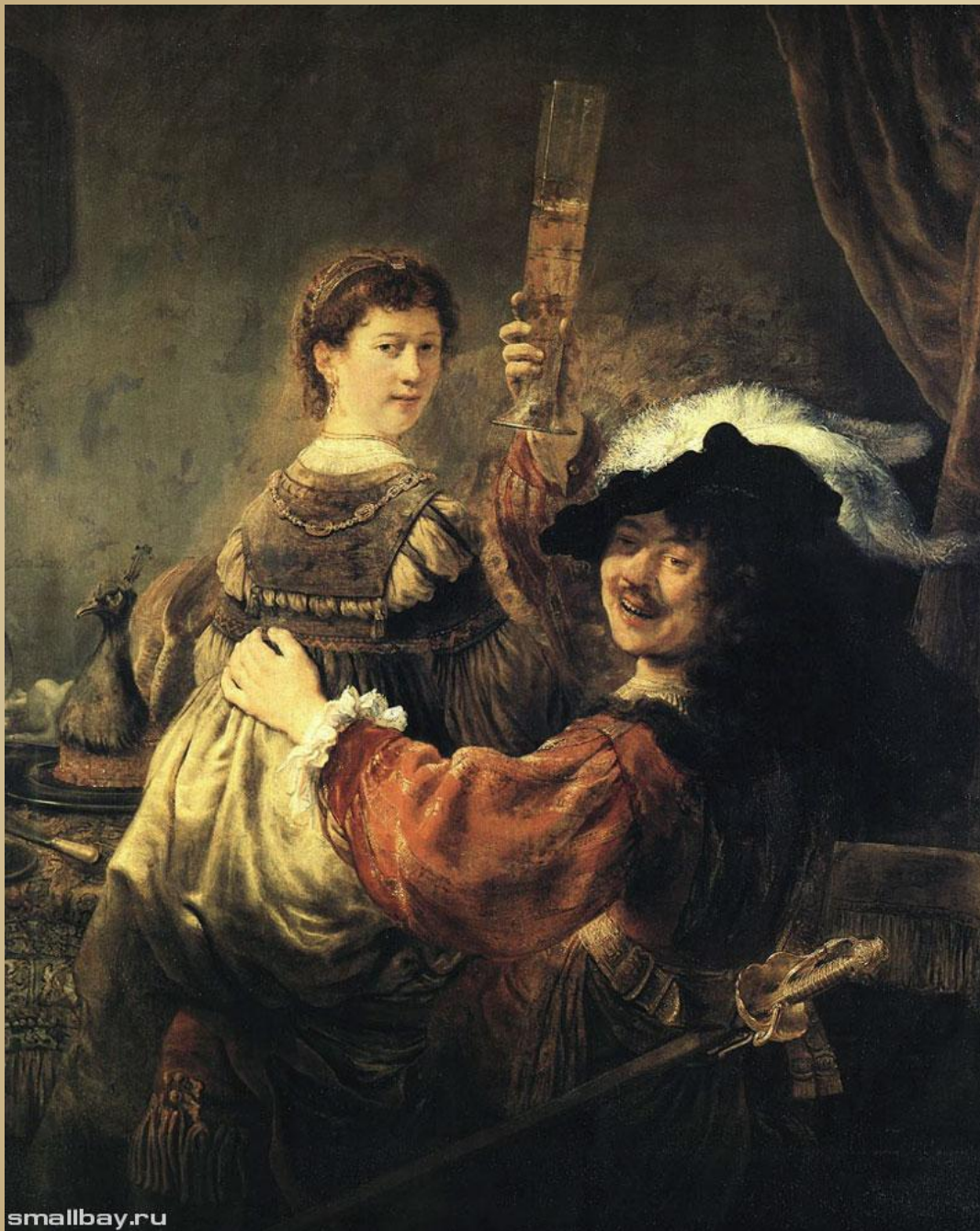
Веселое общество, 1635 Картинная галерея, Дрезден