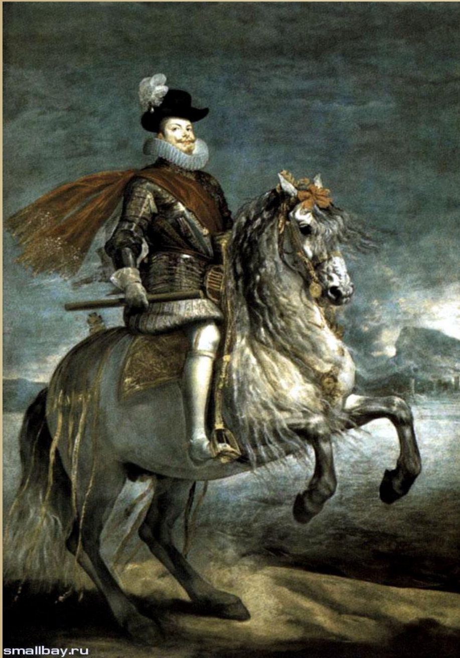
Портрет короля Филиппа III, 1635