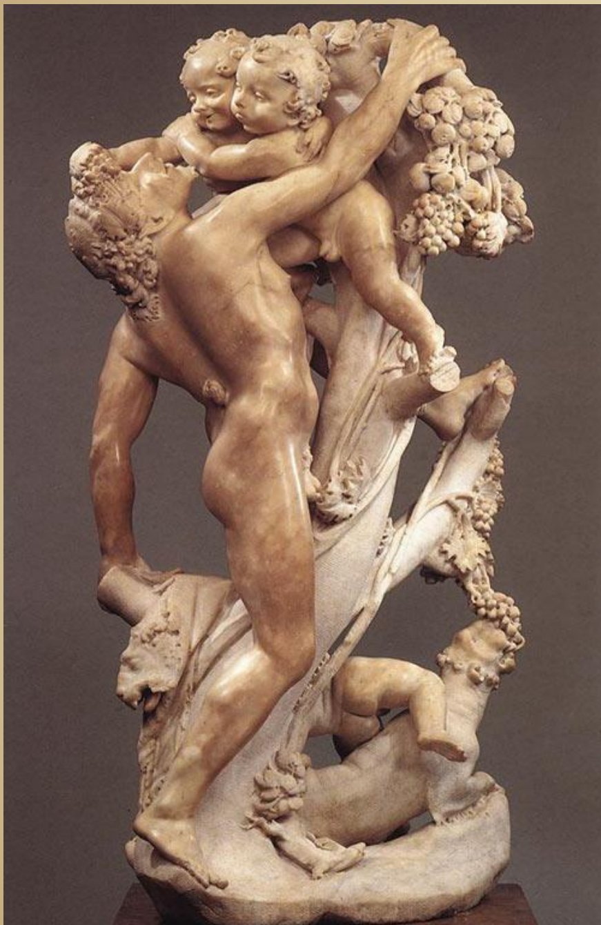
Бернини Вакханалия, 1617 Метрополитен- музей, Нью- Йорк