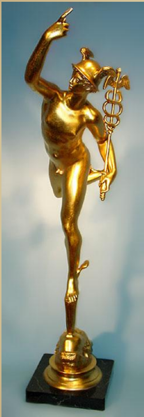
Джамболонья Меркурий , 1564, Городской музей, Болонья