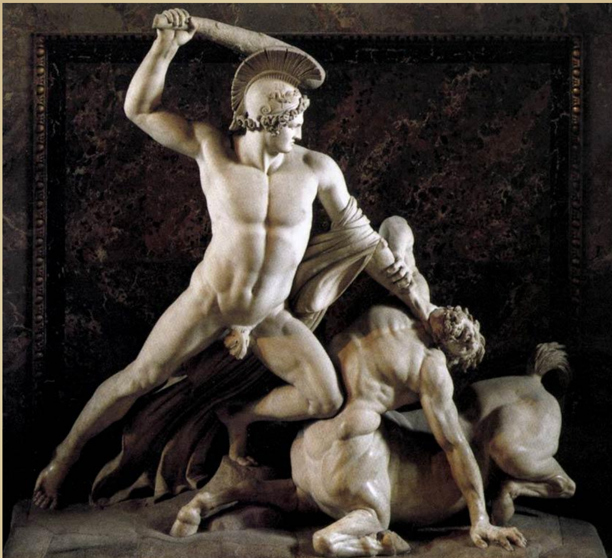
Антонио Канова Тесей и кентавр 1804-1819, Музей истории искусств, Вена