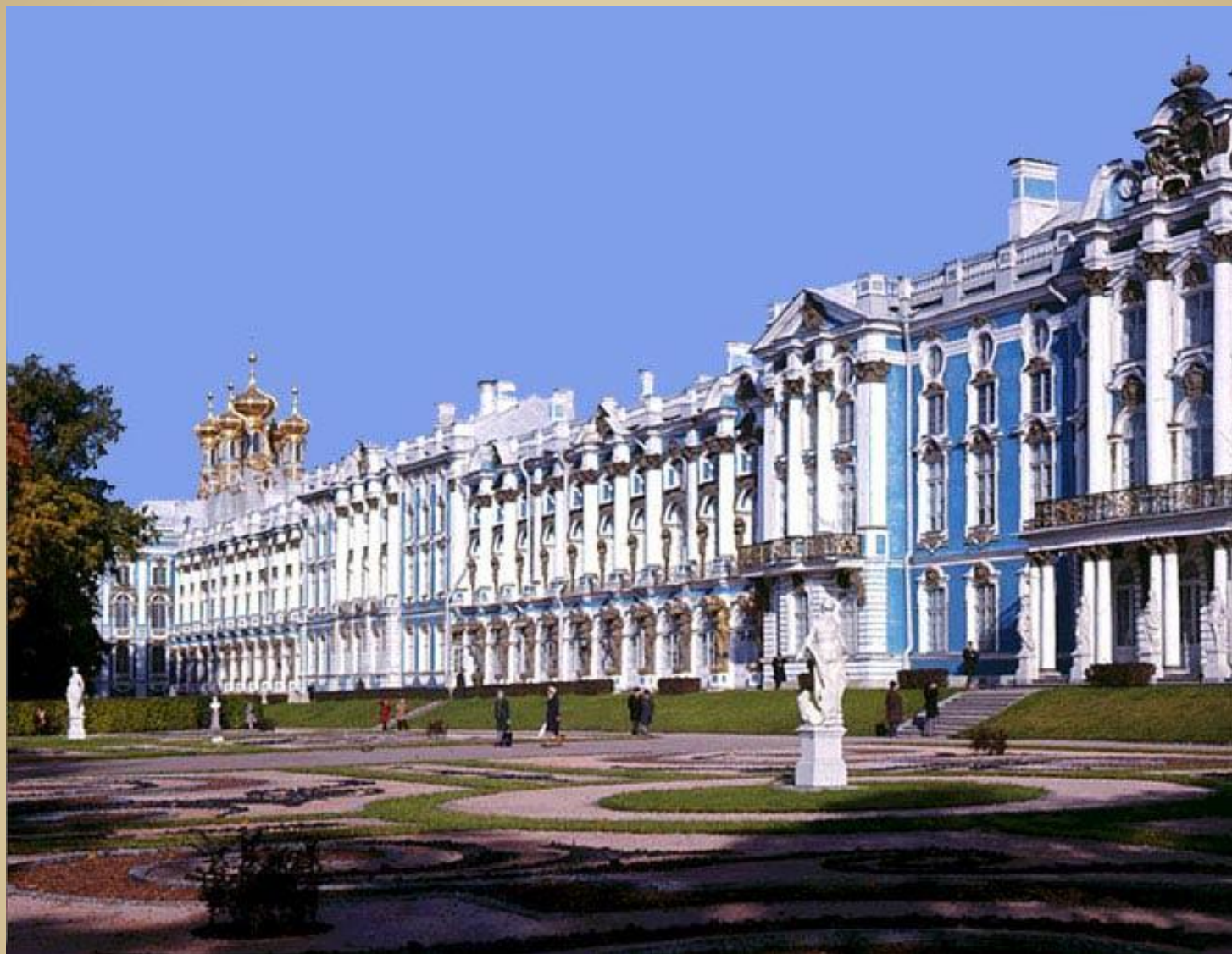
Екатерининский дворец Браунштейн, Квасов, Чевакинский, 1717-1756 Санкт-Петербург