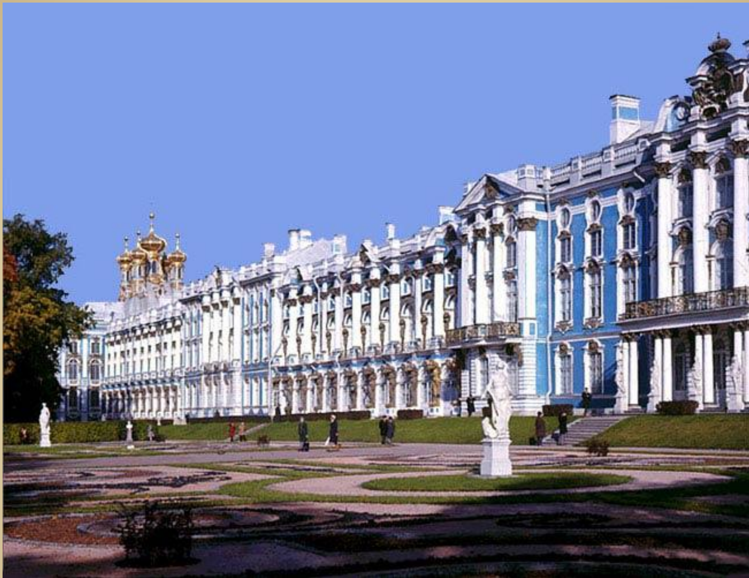
Екатерининский дворец Браунштейн, Квасов, Чевакинский, 1717-1756 Санкт-Петербург