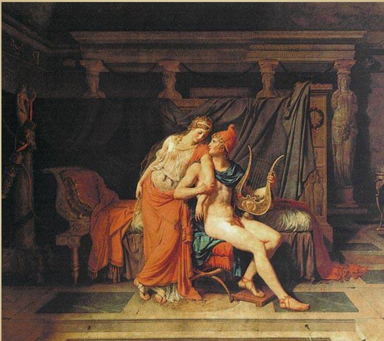
Парис и Елена" 1788, Лувр, Париж