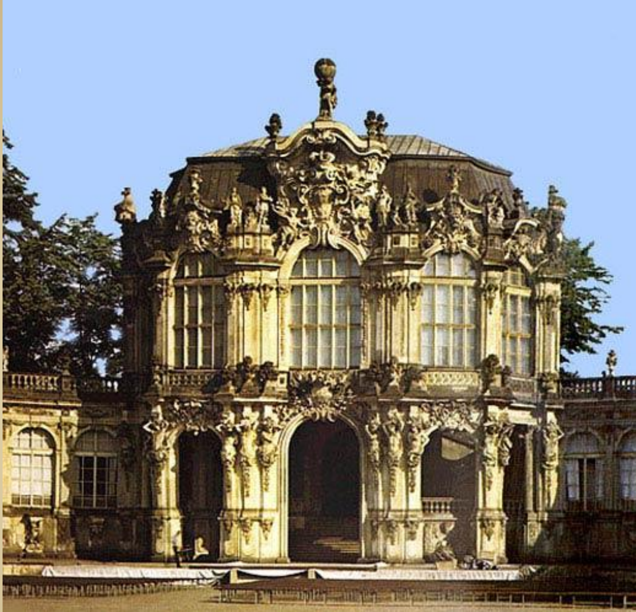
Цвингер Пеппельманн, Пермозер, нач. XVIIIв. Германия Дрезден