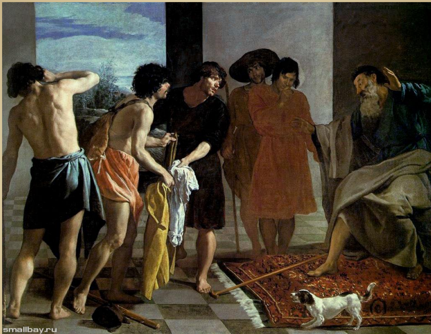
Окровавленный плащ Иосифа приносят Иакову