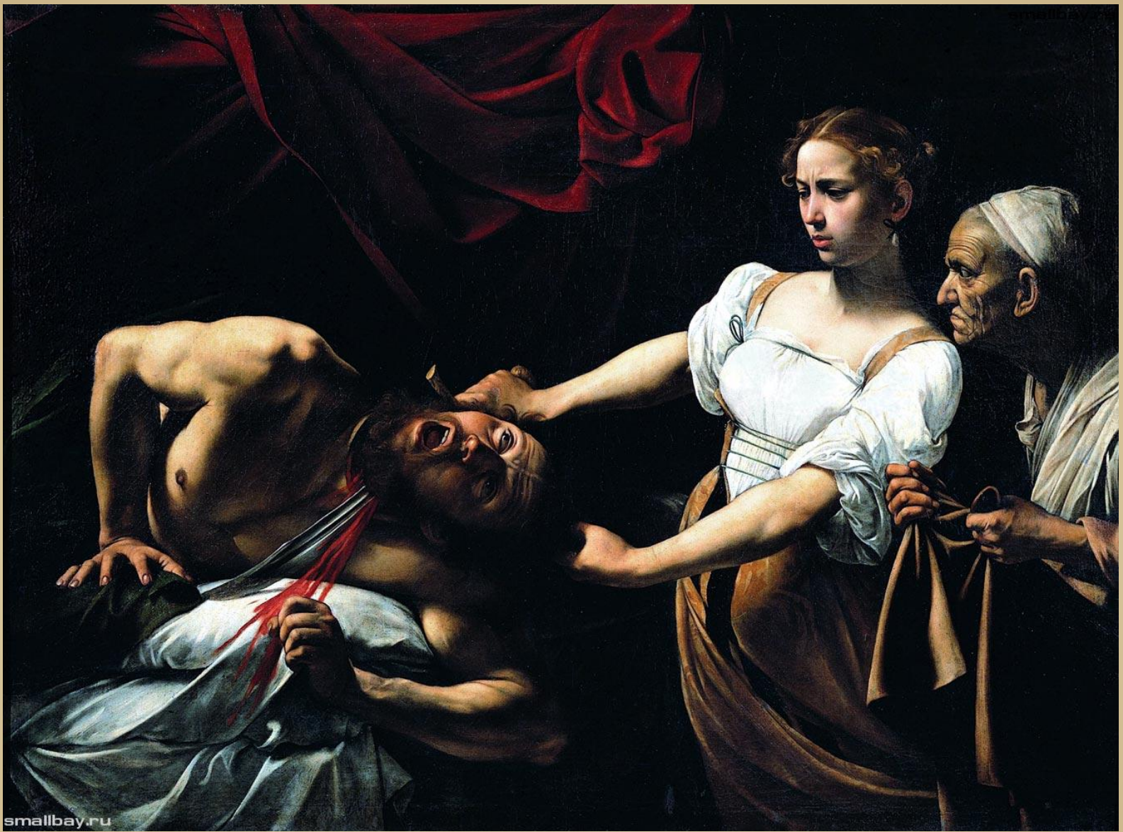
Юдифь, убивающая Олоферна, 1598