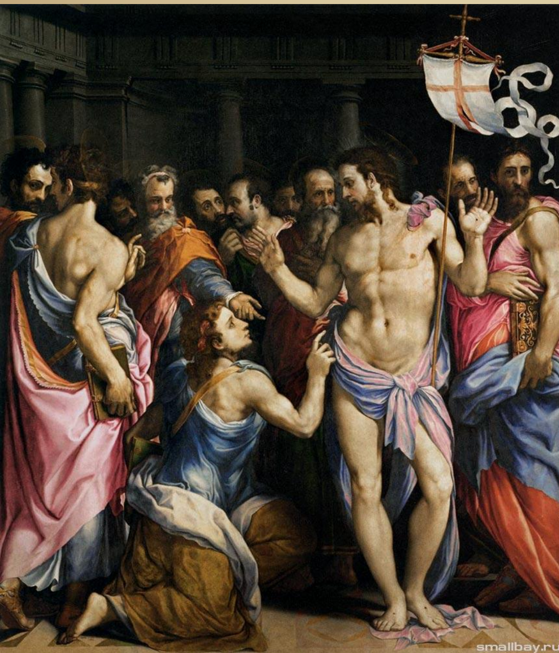
Неверие святого Фомы Сальвиати Франческо Флорентийский живописец