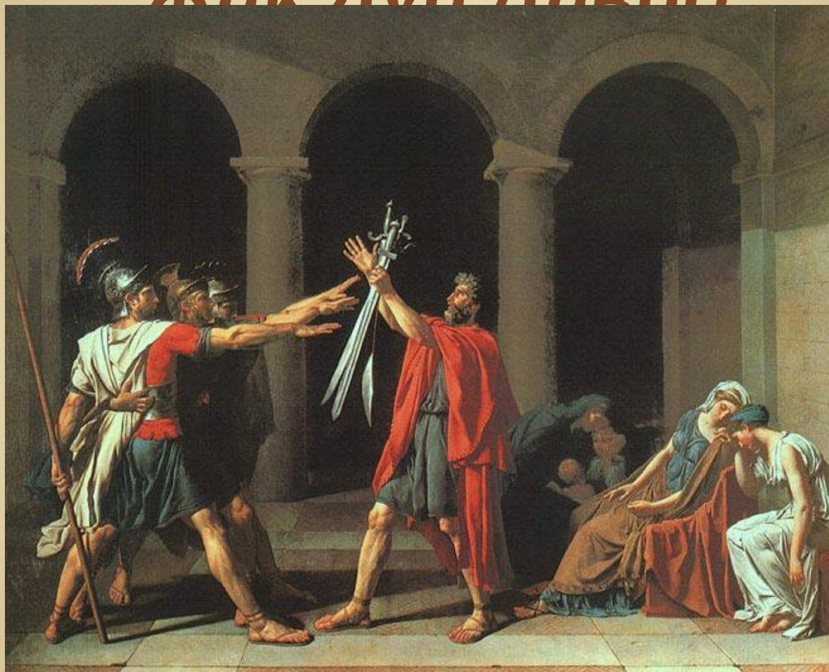
Клятва Горацев" 1784, Лувр, Париж