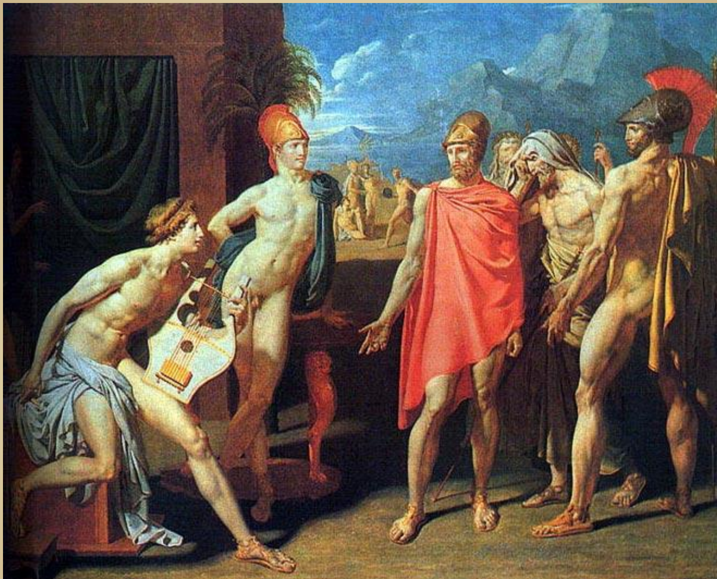
"Послы Агамемнона в палатке Ахиллеса" 1801, Лувр, Париж