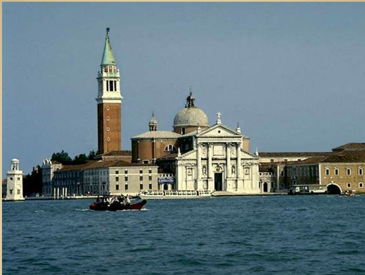
Церковь и монастырь Сан-Джорджо-Маджоре, Палладио, 1566 Венеция