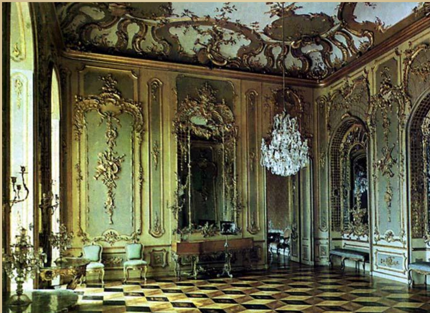
Интерьер дворца в стиле рококо