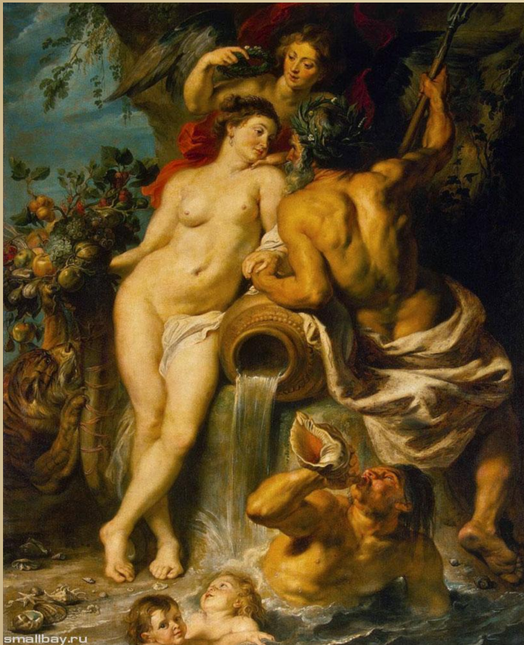
Союз Земли и Воды , 1618 Эрмитаж, Санкт- Петербург