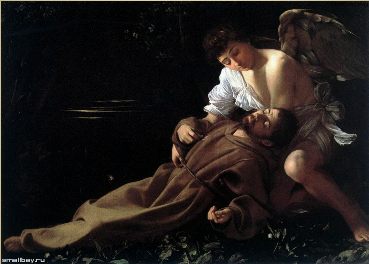
Блаженство святого Франциска 1595, Уодсуорт Атэнеум, Хартфорд