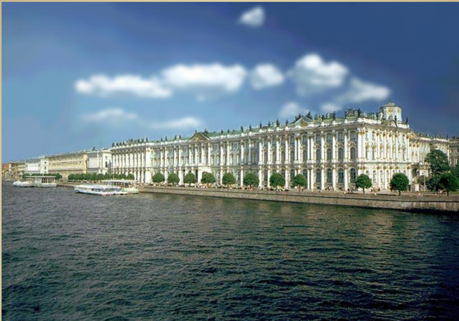
Зимний дворец Растрелли, Стасов, Брюллов, 1754-1762, 1838-1839 Санкт-Петербург