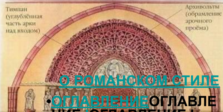
Архивольты (обрамление арочного проёма)