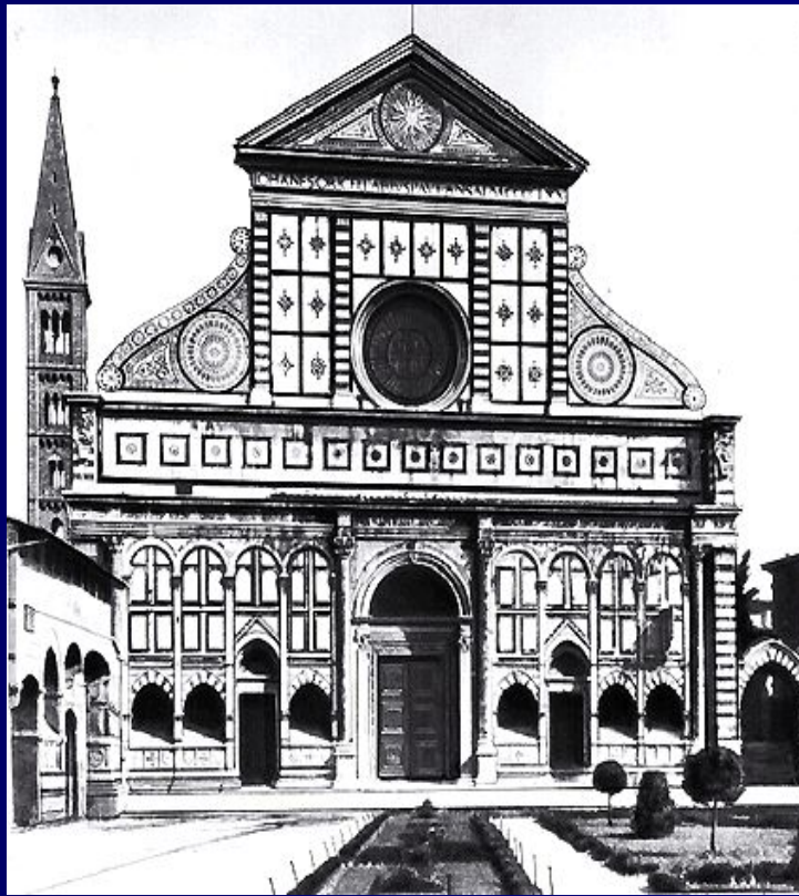
Л.Б.Альберти «Фасад церкви Санта-Мария новелла во Флоренции»