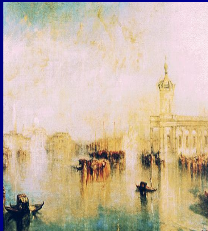
У.Тёрнер «Догана и Сан Джорджо В Венеции» ↓