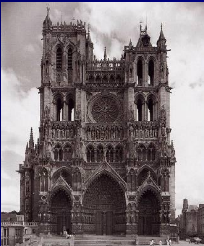
Собор в Амьене