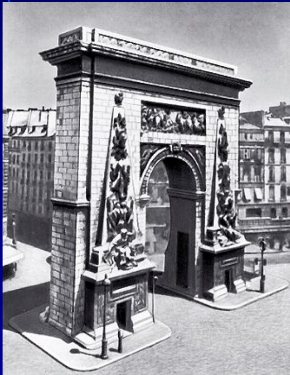
Ф.Блондель «Ворота Сен-Дени в Париже»