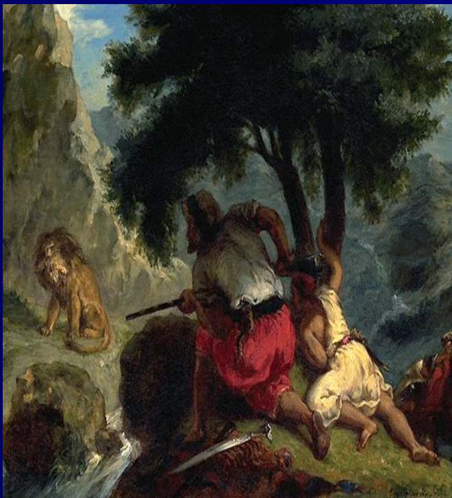
Э.Деларуа ↑ «Львиная охота в Марокко», 1854