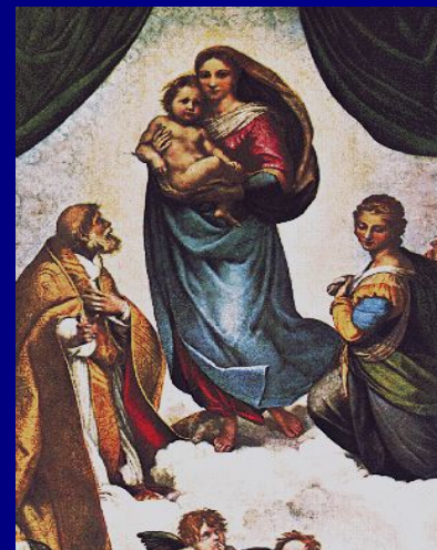
← Рафаэль «Сикстинская Мадонна»