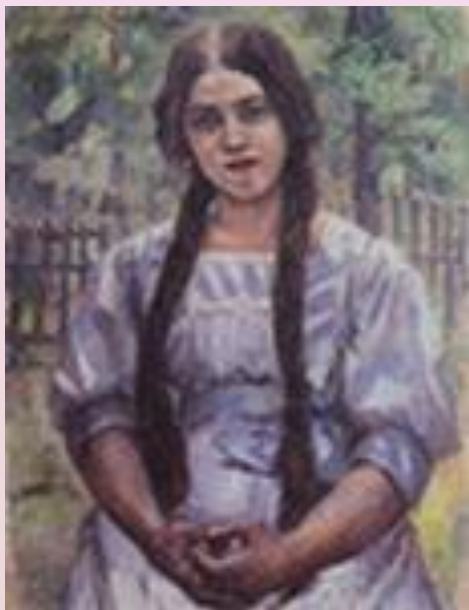
Суриков В. Девушка с косами