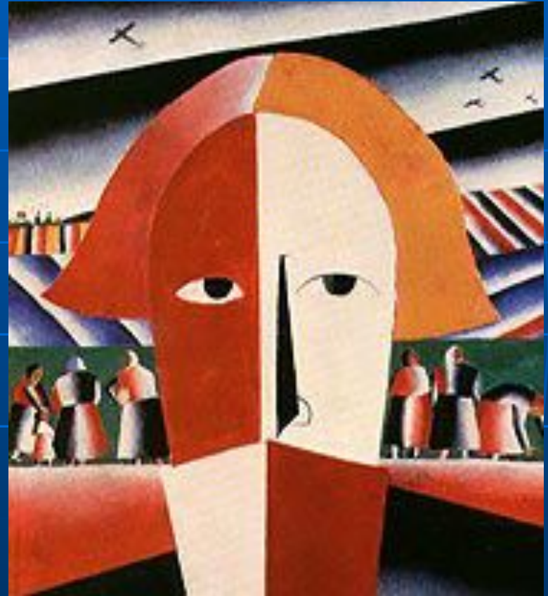
«Голова крестьянина». 1928-32.