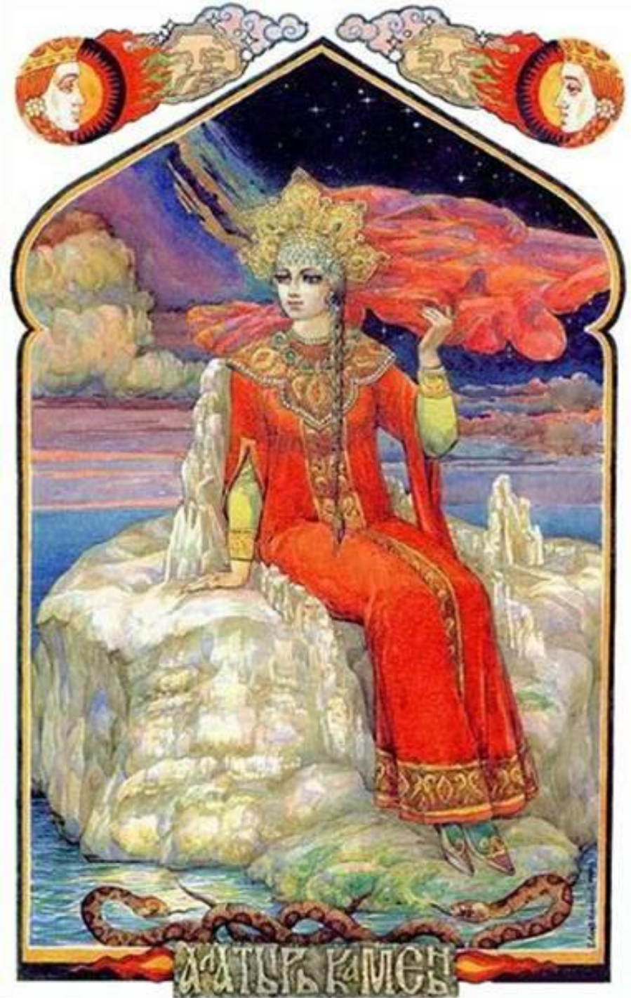
Алатырь-камень и Заря