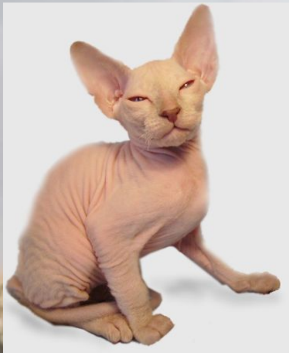
петербургский сфинкс (или петерболд)