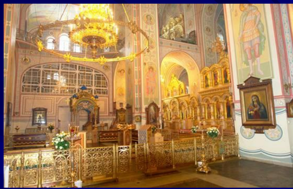
Интерьер Преображенского собора