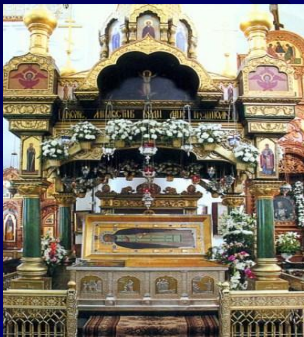
Рак со св. мощами преп. Серафима Саровского