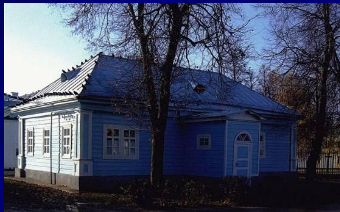
Пустынька св. блаженной Параскевы. Музей истории монастыря