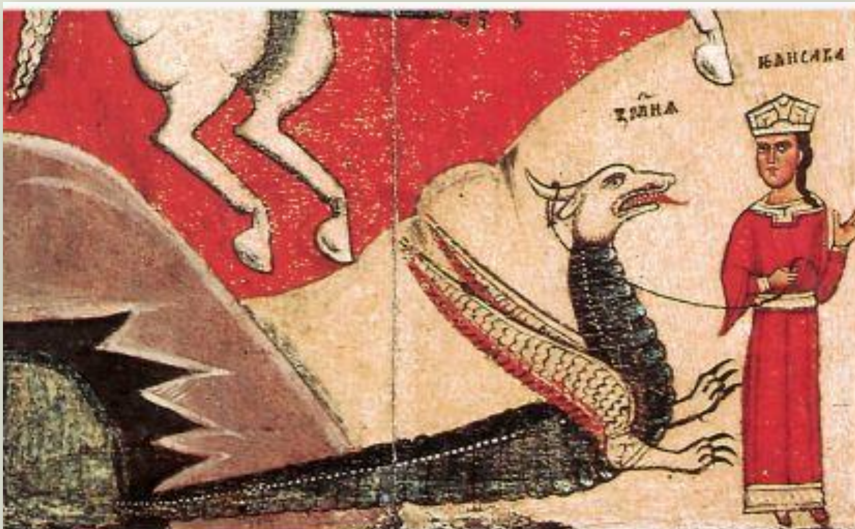
Царевна Елисава ведет Змия