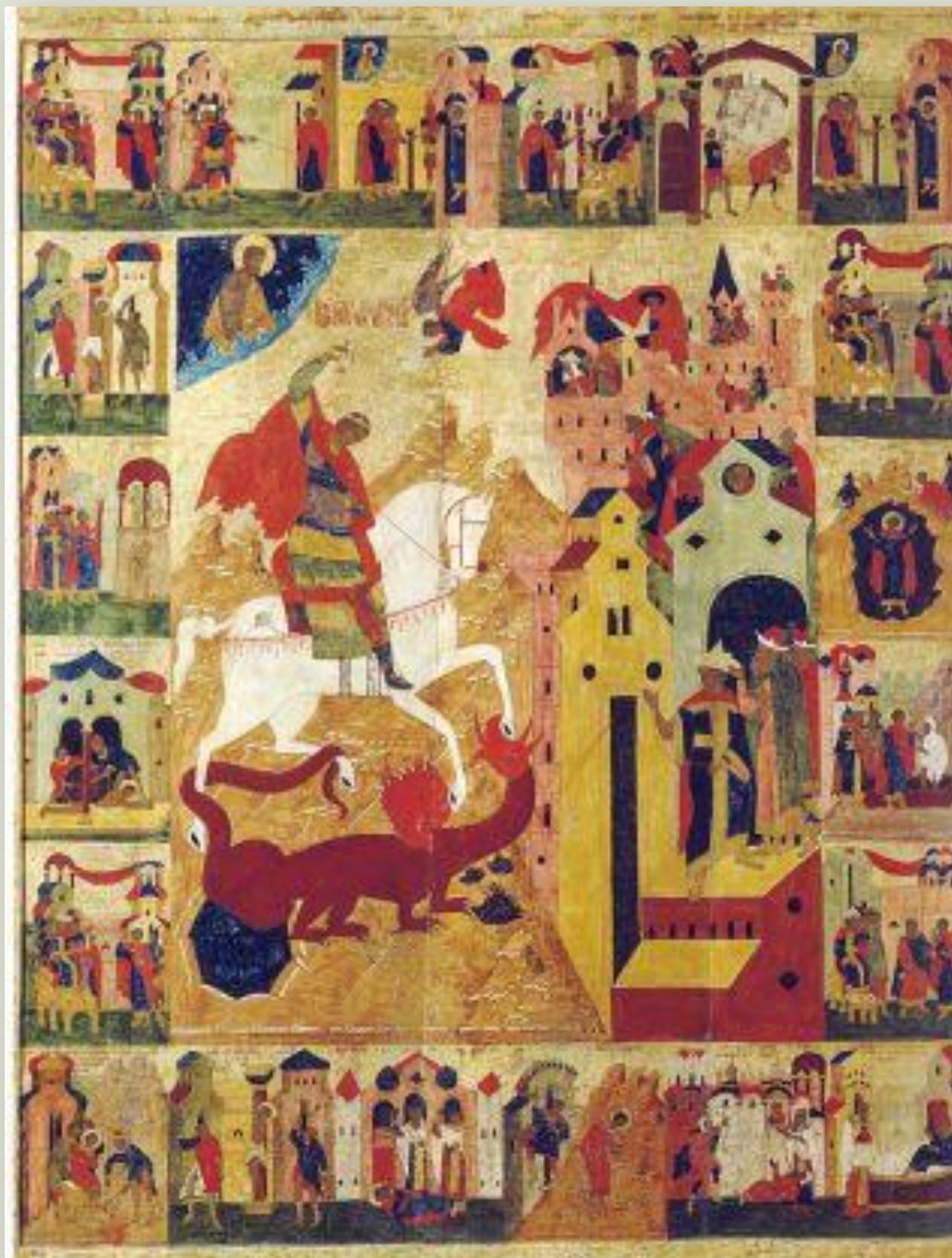
Житийный образ Георгия- Победоносца 16в.