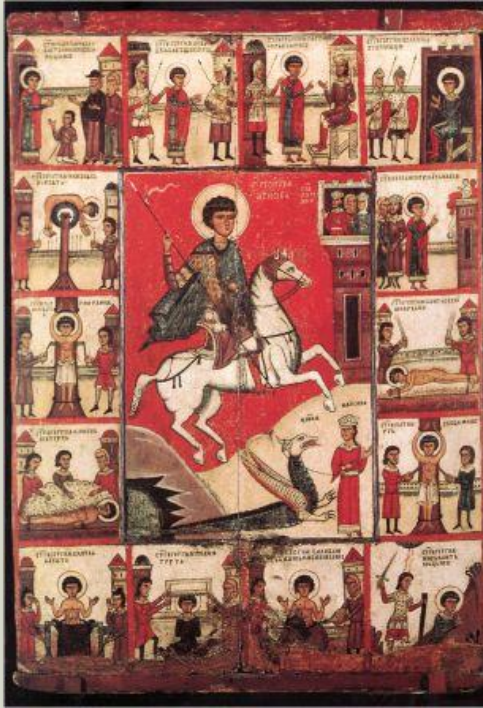
Святой Георгий в житии, 14в.