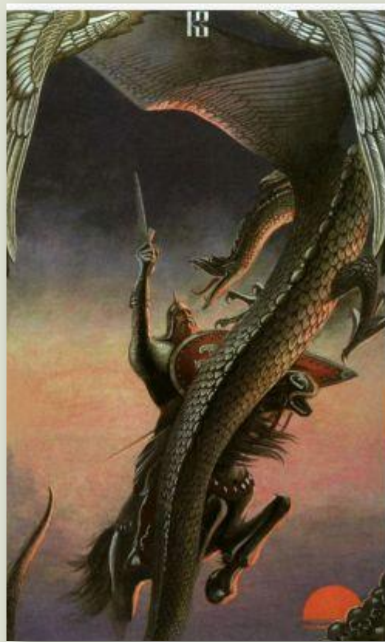
Константин Васильев «Бой со Змием» 20в.