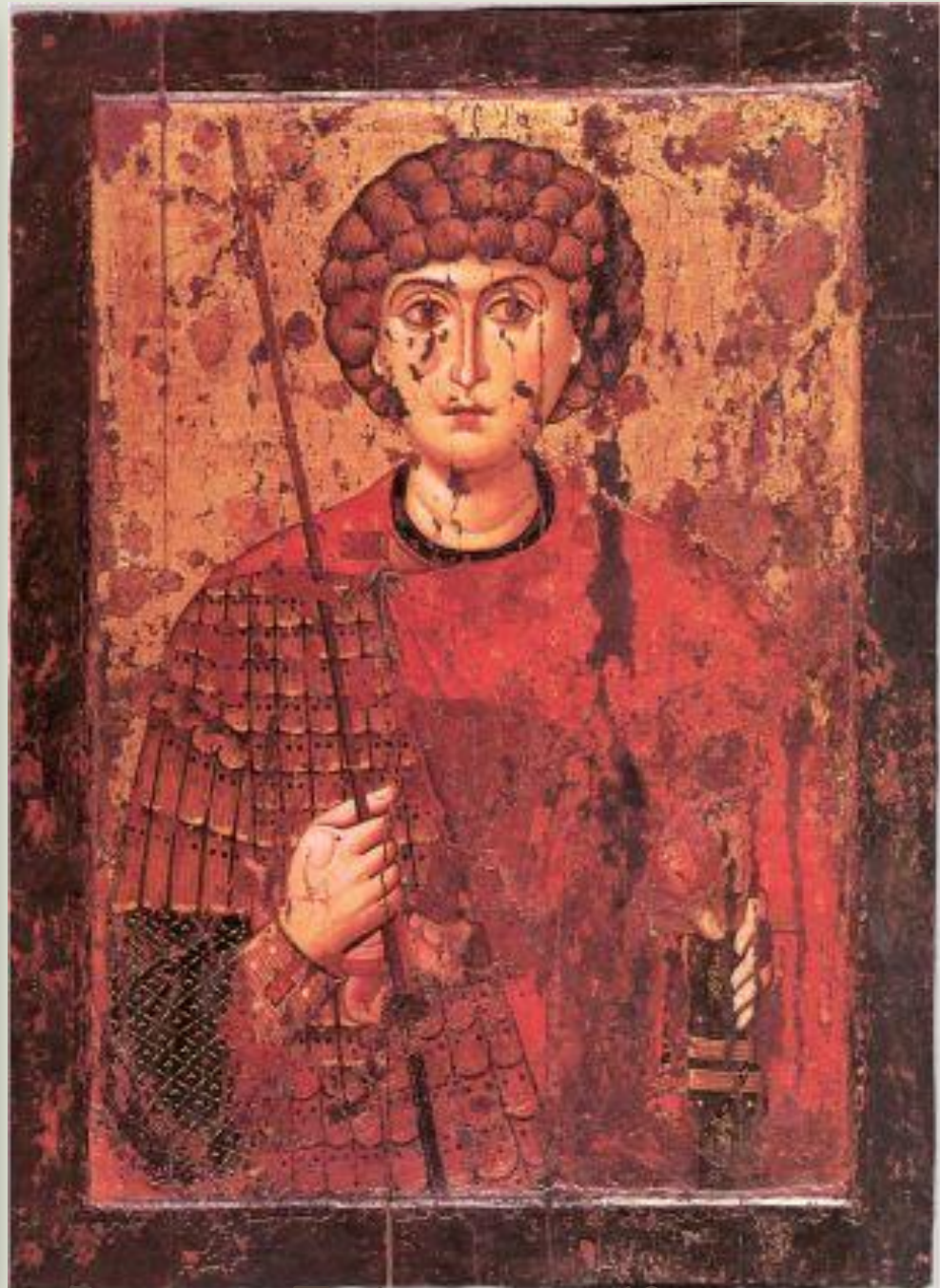
Византийский образ Святого Георгия - Победоносца, 12в.