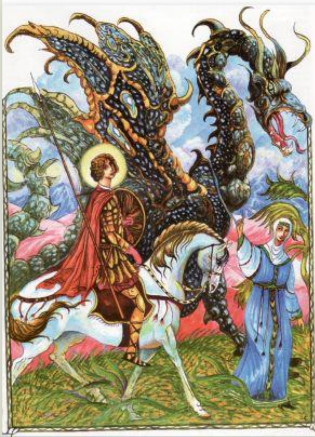
Георгий Юдин Чудо Георгия о Змие