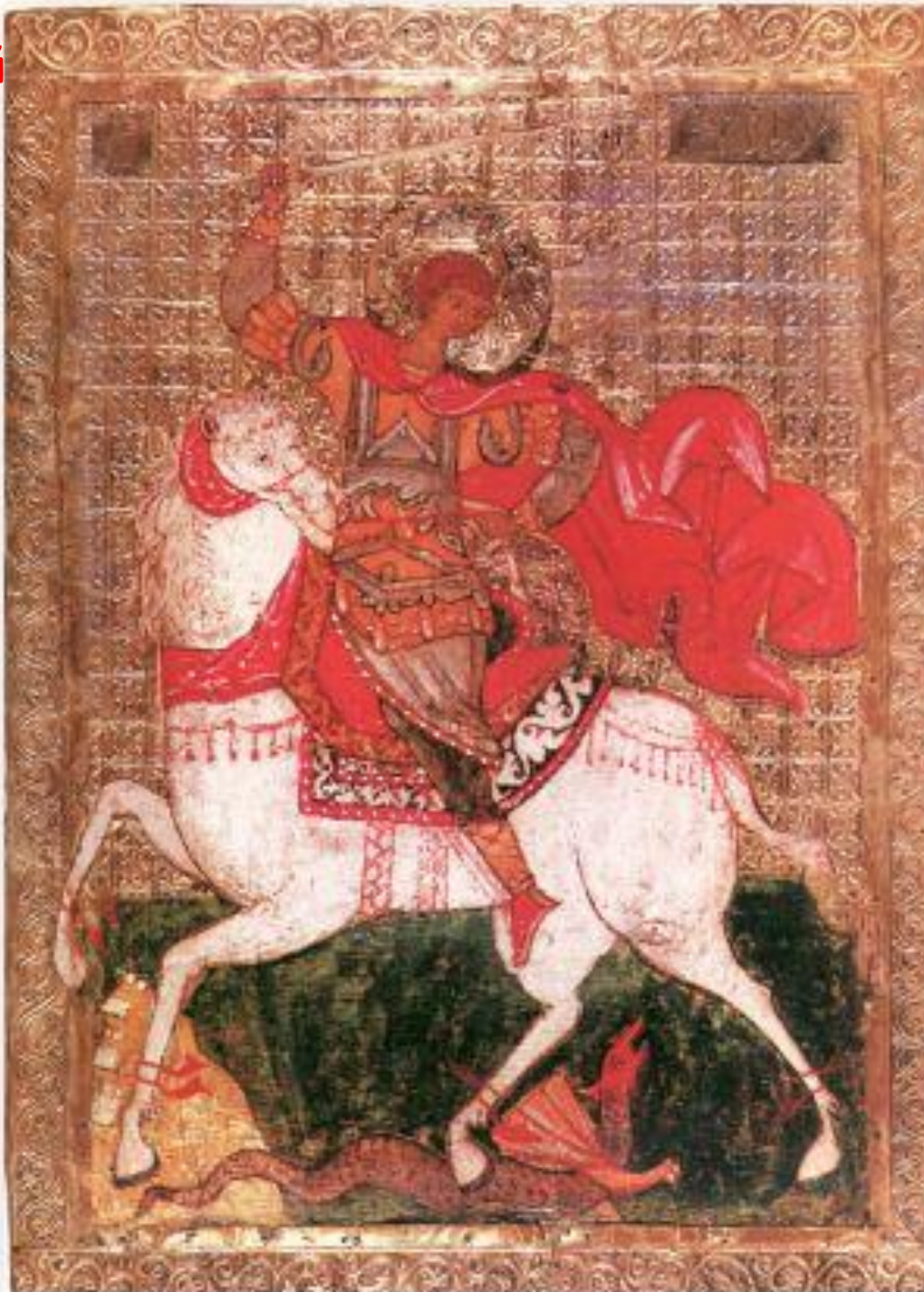
Чудо Георгия о Змие, 15в