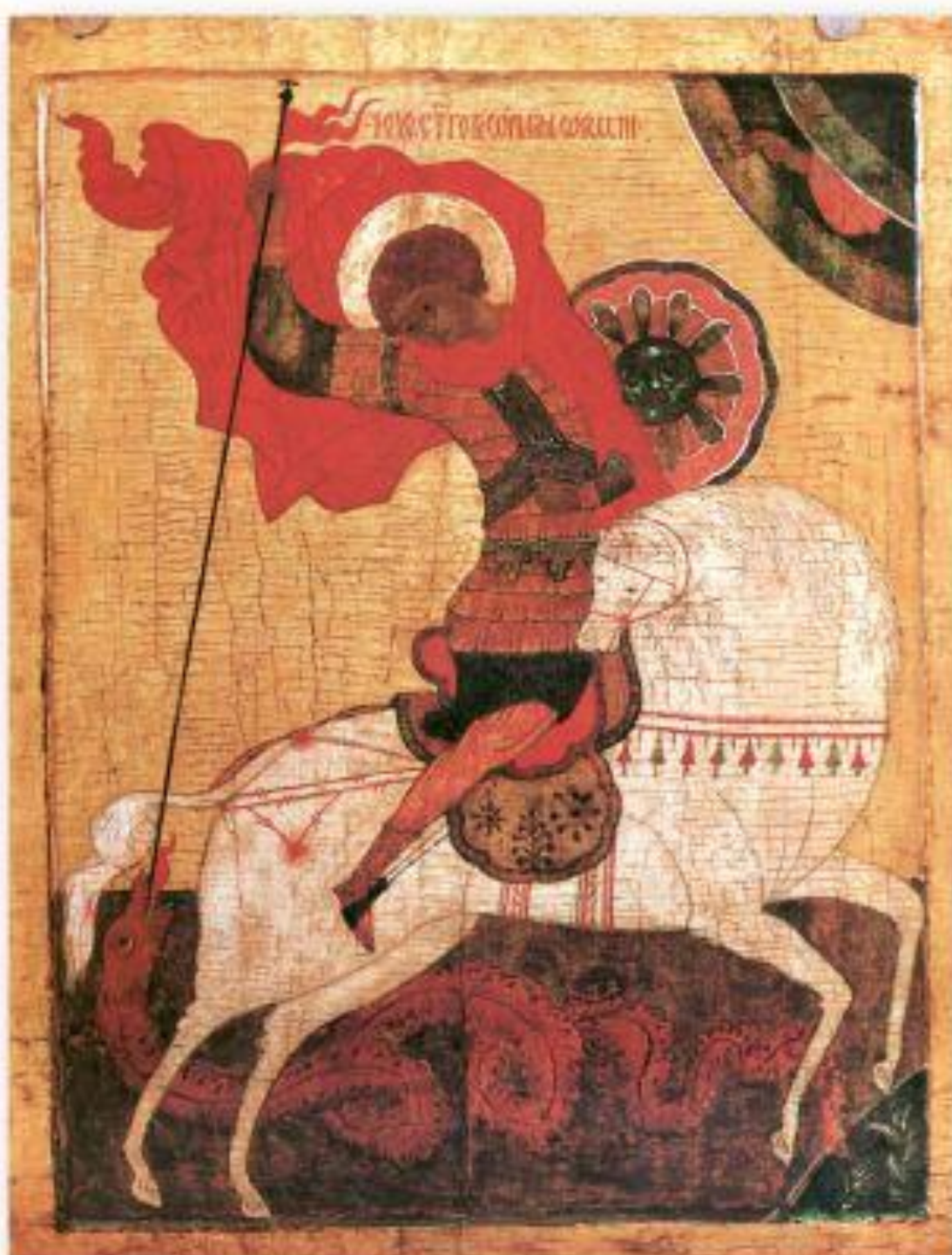
Новгородский образ - Чудо Георгия о змие 15в.