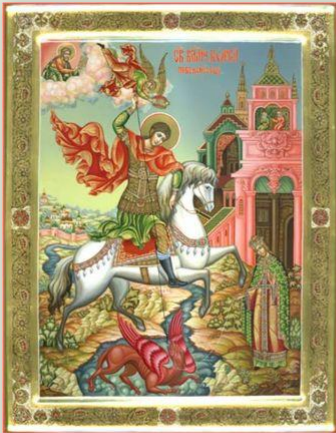
Чудо Георгия о Змие 19в