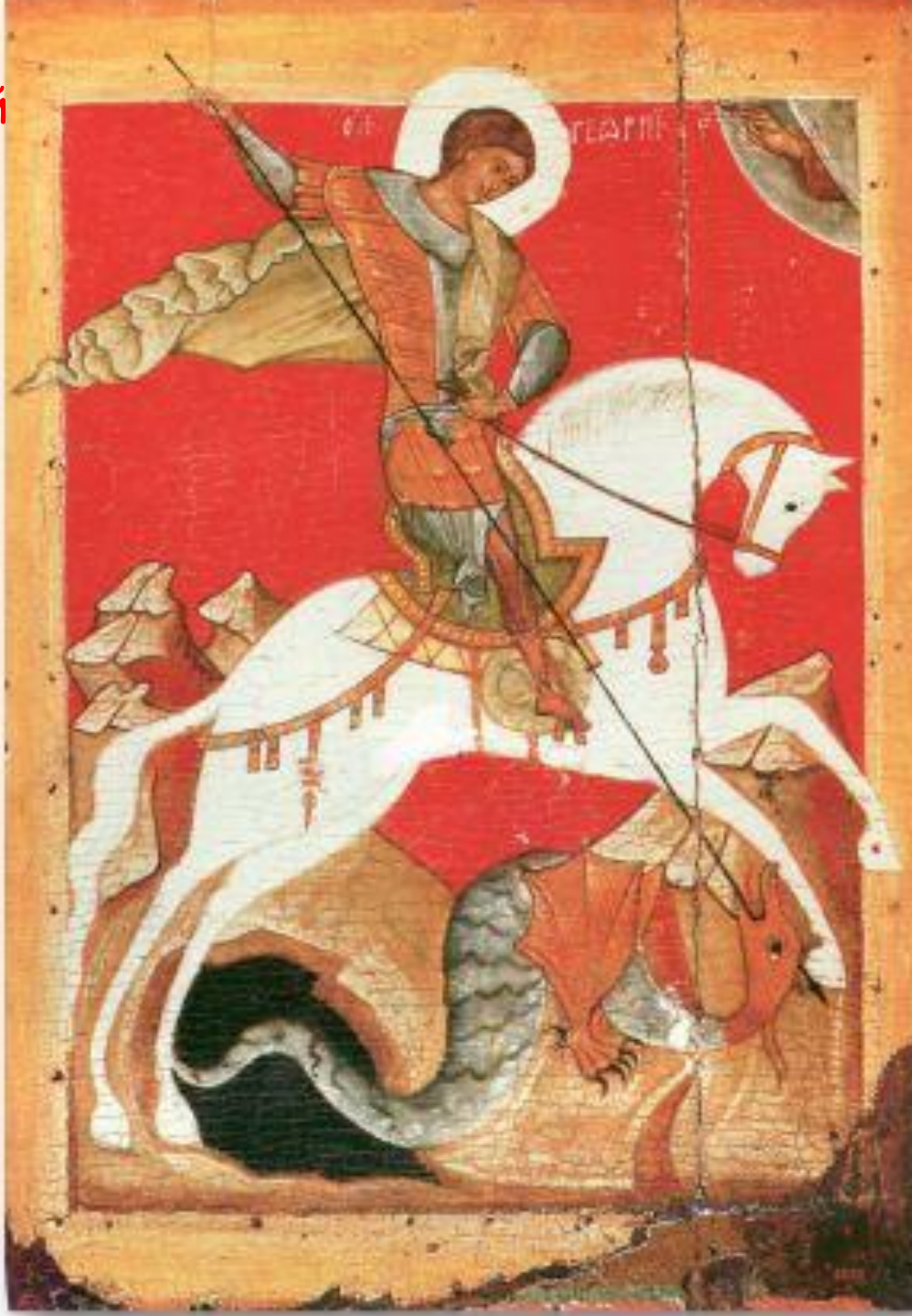
Чудо Георгия о Змие, 14в.