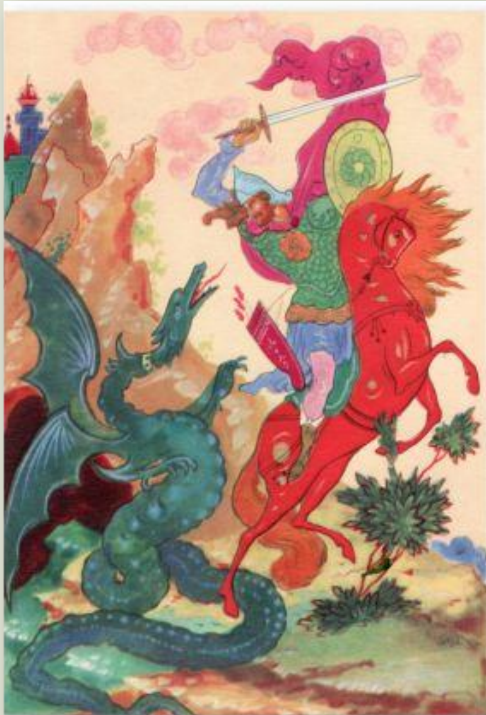
Большаков И. Богатырь и змей