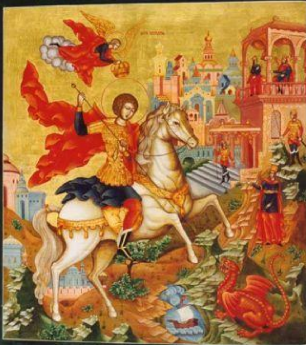
Образ Святого Великомученика Георгия Победоносца

ОБРАЗ СВЯТЫХ ВЕЛИКОМУЧЕНИКА ГЕОРГИЯ ПОБЕДОНОСЦА