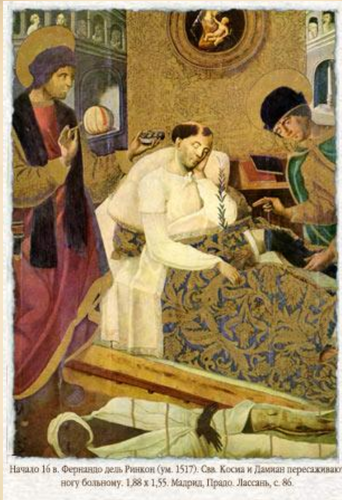
Начало 16 в. Фернандо дель Ринкон (ум. 1517): Свв. Косма и Дамиан пересаживают ногу больному. 1,88 x 1,55. Мадрид, Прадо. Лассань, с. 86.

Мало того, чтобы быть доступнее для болящих, они сами искали их и для сего переходили из города в город, из веси в весь, и всем больным, без различия пола и возраста, звания и состояния, подавали исцеление. И это делали они не для того, чтобы обогатиться или прославиться, но с самою чистою, высокою целью — служить страждущим ради Бога, любовь к Богу выразить в любви к ближним. Поэтому они ни от кого никогда не принимали никакой награды за свои труды, никаких даже знаков благодарности за собственные благодеяния.