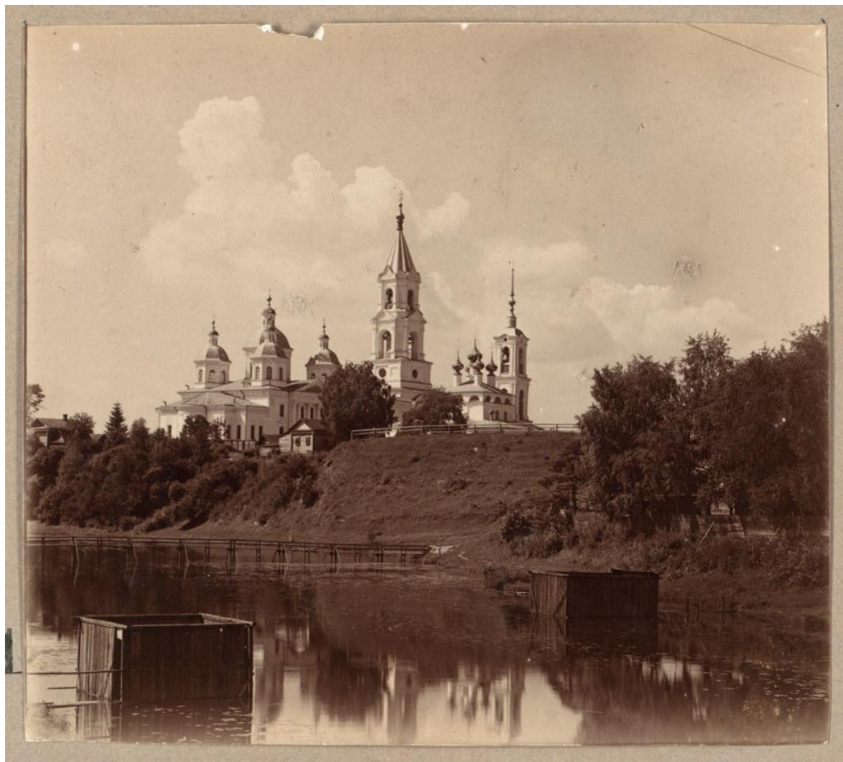
Успенский собор. Кашин.