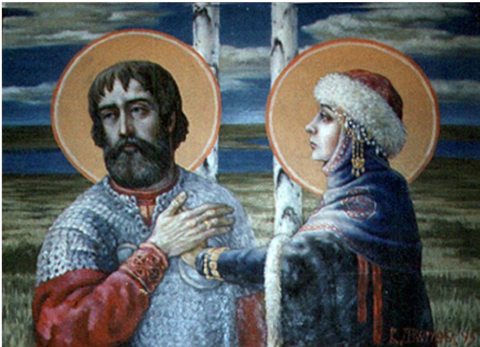
Святой благоверный великий князь Михаил Ярославич Тверской и благоверная княгиня-инокиня Анна Дмитриевна Кашинская