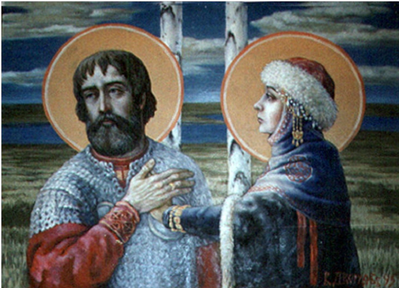
Святой благоверный великий князь Михаил Ярославич Тверской и благоверная княгиня-инокиня Анна Дмитриевна Кашинская