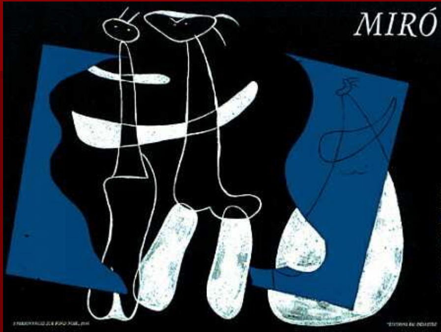
"3 персонажа любящие ночь"