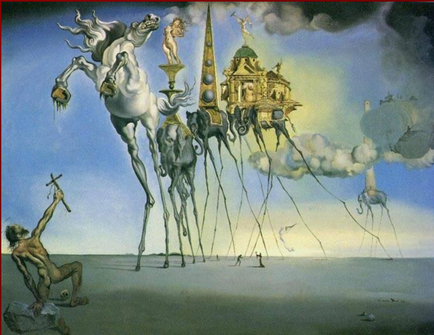
"Искушение Святого Антония" 1946 г.