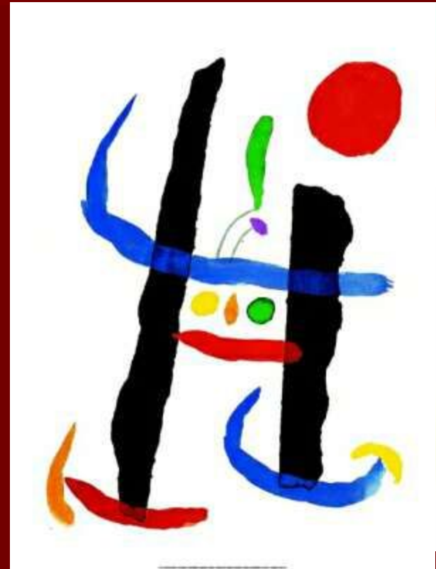
"При любом испытании"