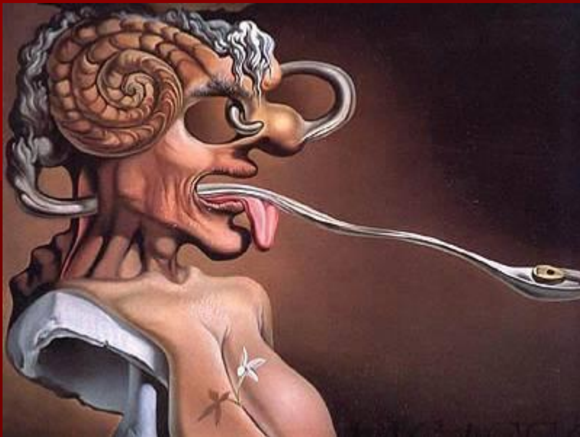
Портрет Пикассо. 1947 г.