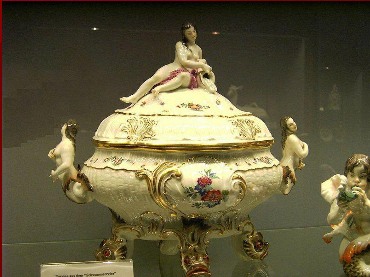
Terrine aus dem "Schwanenservice"