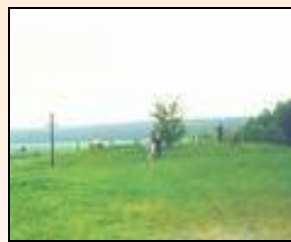
Так здесь было до 1999 г.