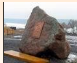
4 февраля 2004 года