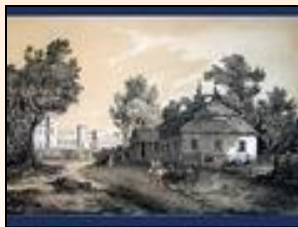
Литография с картины Н. Орды.