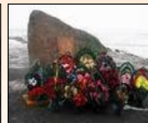
4 февраля 2004 года