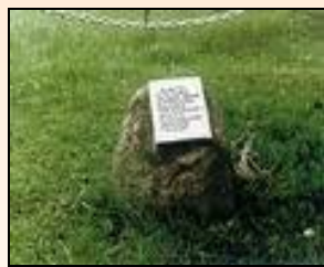
Мемориальный камень до 1999 г.