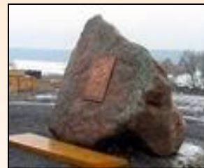
4 февраля 2004 года