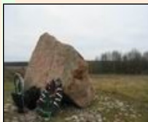
Мемориальный камень поставлен в 1999 году