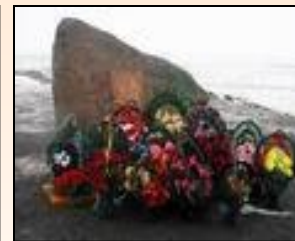
4 февраля 2004 года