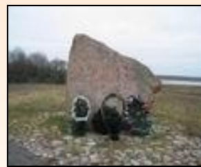
30 ноября 2003 г.