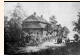
Картина с натуры Б. Садовникова (около 1840 г.)