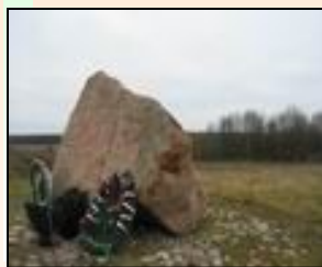
Мемориальный камень поставлен в 1999 году