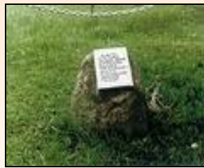
Мемориальный камень до 1999 г.