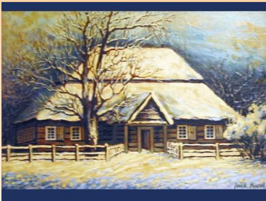
Картина из музея Костюшко в Мацевичах