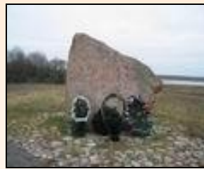
30 ноября 2003 г.