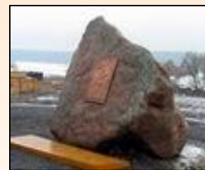
4 февраля 2004 года