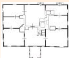
Меречевщина. План дома Тадэуша Костюшки