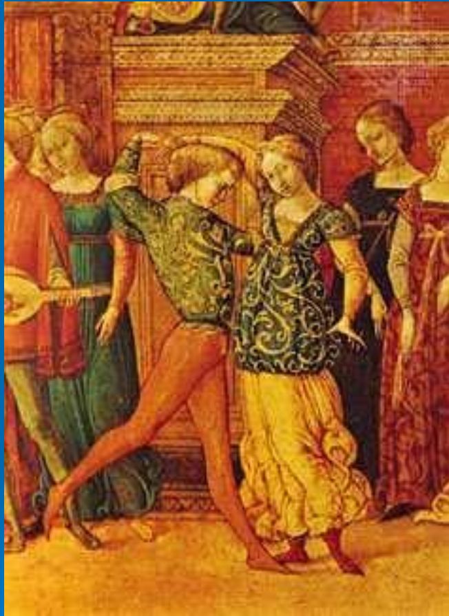
Танец Гальярда в Сиене, Италия, XV век

Гальярда — старинный танец итальянского происхождения, распространённый в Европе в конце XV—XVII вв.. По своему происхождению гальярда — это народный танец, однако в конце XV века её стали танцевать и при дворе.