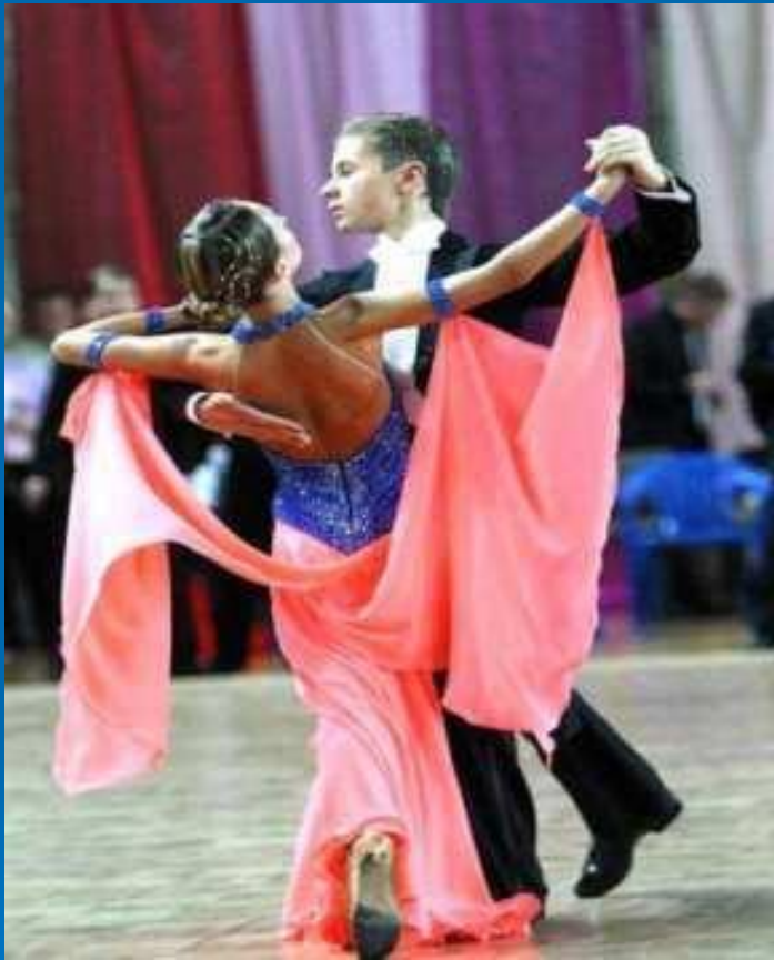
Бальный танец. 2002 год

Танец возник из разнообразных движений и жестов, связанных с трудовыми процессами и эмоциональными впечатлениями человека от окружающего мира.