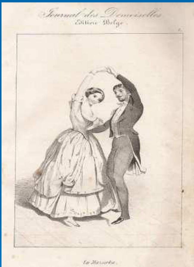
Мазурка в 1845 году

Мазурка — польский народный танец. Название произошло от жителей Мазовии — мазуров, у которых впервые появился этот танец. Музыкальный размер — 3/4 или 3/8 , темп быстрый.