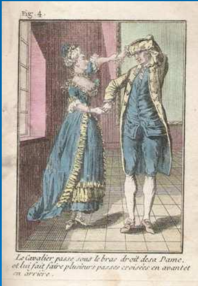
Аллеманда XVI век

Аллеманда — один из наиболее популярных инструментальных танцев эпохи Барокко, стандартная составляющая сюиты.