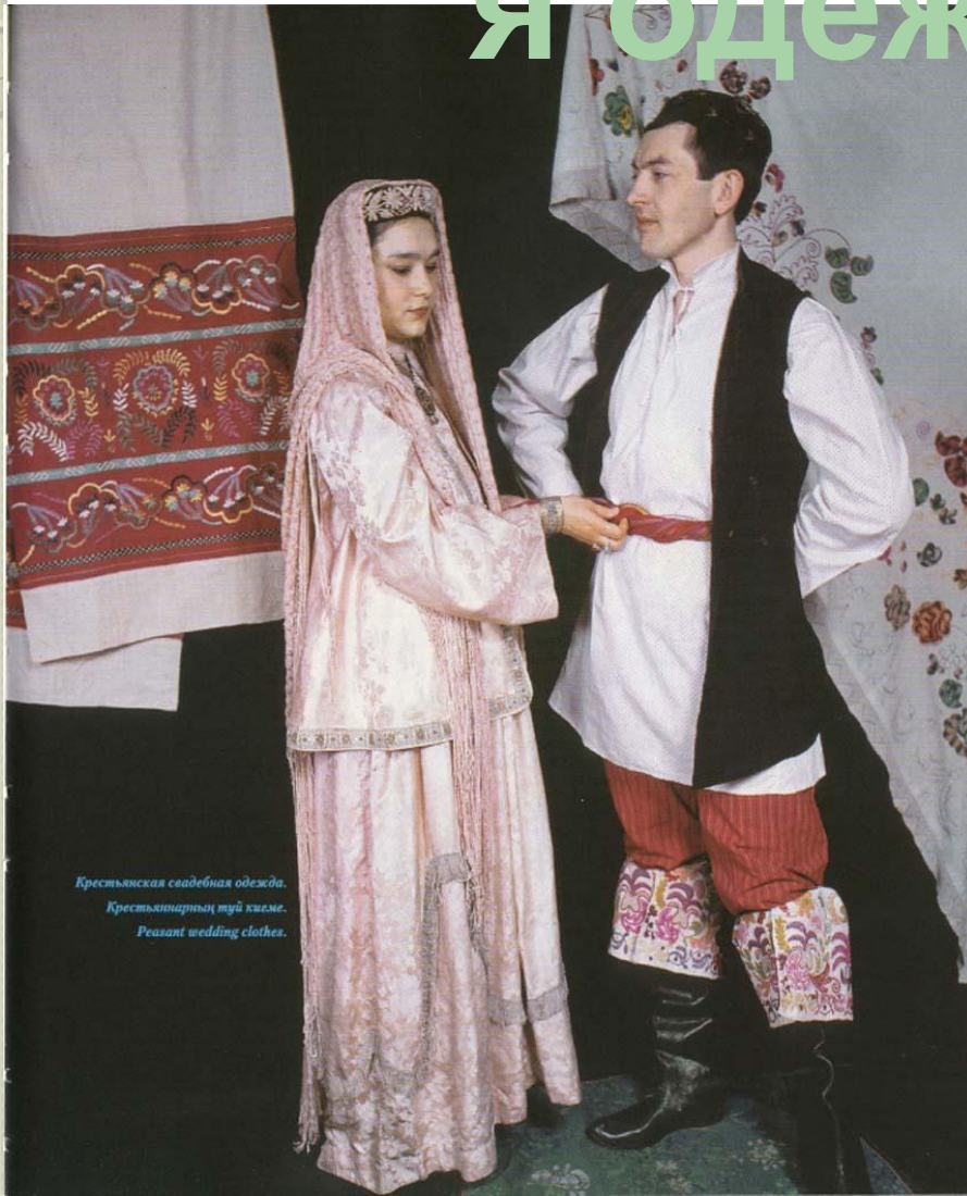
Крестьянская свадебная одежда. Крестьянларның туй киеме. Peasant wedding clothes.

Одежда мужчин и женщин состояла из шаровар с широким шагом и рубашки (у женщин дополнялась вышитым нагрудником), на которую надевался безрукавный камзол. Верхней одеждой служили казакин, а зимой — стёганный бешмет или шуба. Головной убор мужчин — тюбетейка, у женщин — вышитая бархатная шапочка (калфак) и платок. Традиционная обувь — кожаные ичиги с мягкой подошвой, вне дома на них надевали кожаные калоши. Для костюма женщин было характерно обилие металлических украшений.