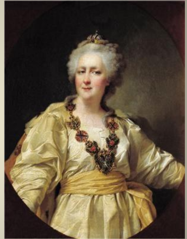
Императрица Екатерина Вторая

Таврический дворец был построен по указанию Екатерины II для своего фаворита, светлейшего князя Г. А. Потёмкина. На возведение и отделку дворца было затрачено около 400 000 рублей золотом. Дворец получил своё название по его титулу Князь Таврический, который был пожалован ему в 1787 году, после присоединения к Российской империи Крыма (Таврии). От названия Таврического дворца происходят наименования Таврического сада, Таврической