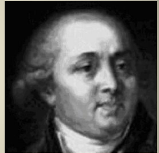
СТАРОВ Иван Егорович русский архитектор