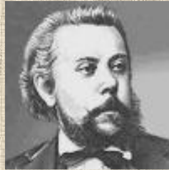
Мусоргский Модест Петрович