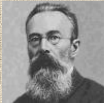
Римский-Корсаков Николай Андреевич