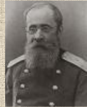
Кюи Цезарь Антонович