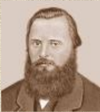
Балакирев Милий Алексеевич