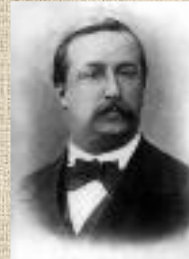
Бородин Александр Порфирьевич