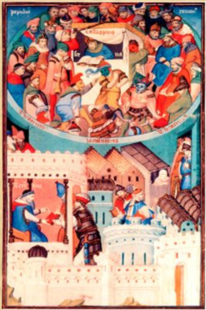
Фронтиспис рукописи с комедиями Теренция

Ремесленники готовили оформление: повозки и помосты, декорации, реквизит и костюмы. Каждый цех готовил один эпизод. Цеха оформляли и ставили сцены каждый по своему профилю. Судостроители — Ноев ковчег, оружейники — изгнание из рая. За несколько дней до показа устраивали смотр, или парад, мистерии: шествие в костюмах и показ декораций. В дни представления мистерии город был украшен и заперт, она могла длиться от трех до сорока дней. Мистерия тяготеет к площади. Площадь средневекового города сродни римскому форуму. Это соборное место. Средневековый человек боится одиночества: он привык жить на улице.