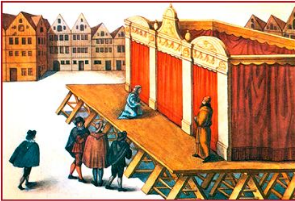
Площадной театр в Лувене Фландрия

Для всей культуры средневекового театра характерен принцип симультанных декораций (тип декорационного оформления спектакля, при котором декорации сменяются одновременно сменяемые по