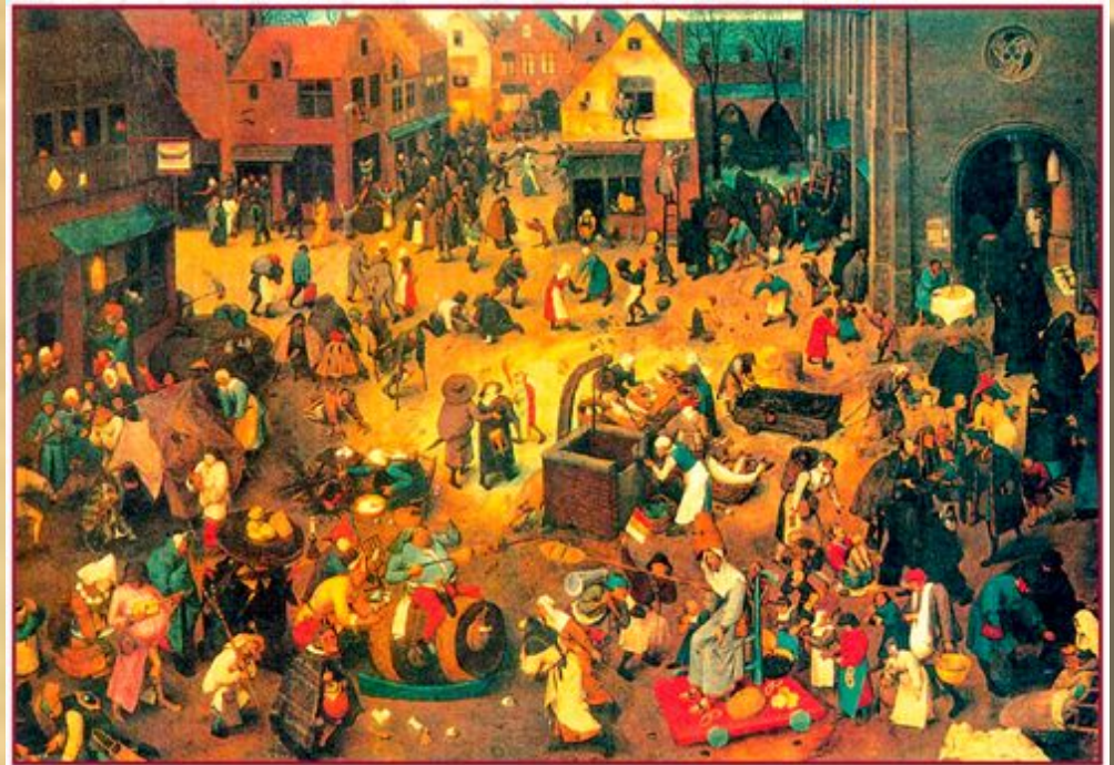
Картина нидерландского художника Питера Брейгеля

Во Франции, Италии, Германии, Испании, Швеции играли «Битву Поста с Карнавалом». Сюжет этого праздника запечатлен Брейгелем. При выборе Короля, Князя или Папы карнавала устраивали шутовские состязания: кто скорчит самую невероятную гримасу, кто издаст самый неприличный звук; такие состязания включали традиционный обмен остротами, переругивание. Князь карнавала ехал на надутом осле. В его костюме сочетались языческие и Простолюдины сражались на палках, пародируя рыцарские турниры.