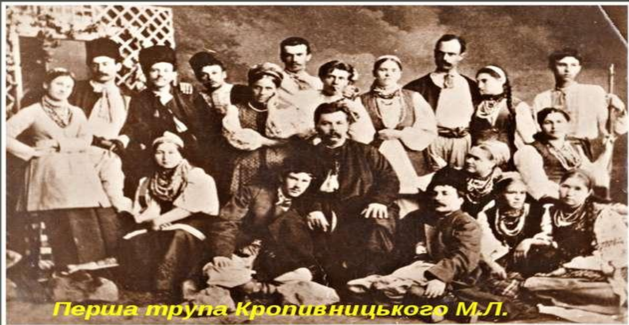
Перша трупа Кропивницького М.Л.

Театр корифеїв знаменує собою розквіт українського професійного театру XIX ст.