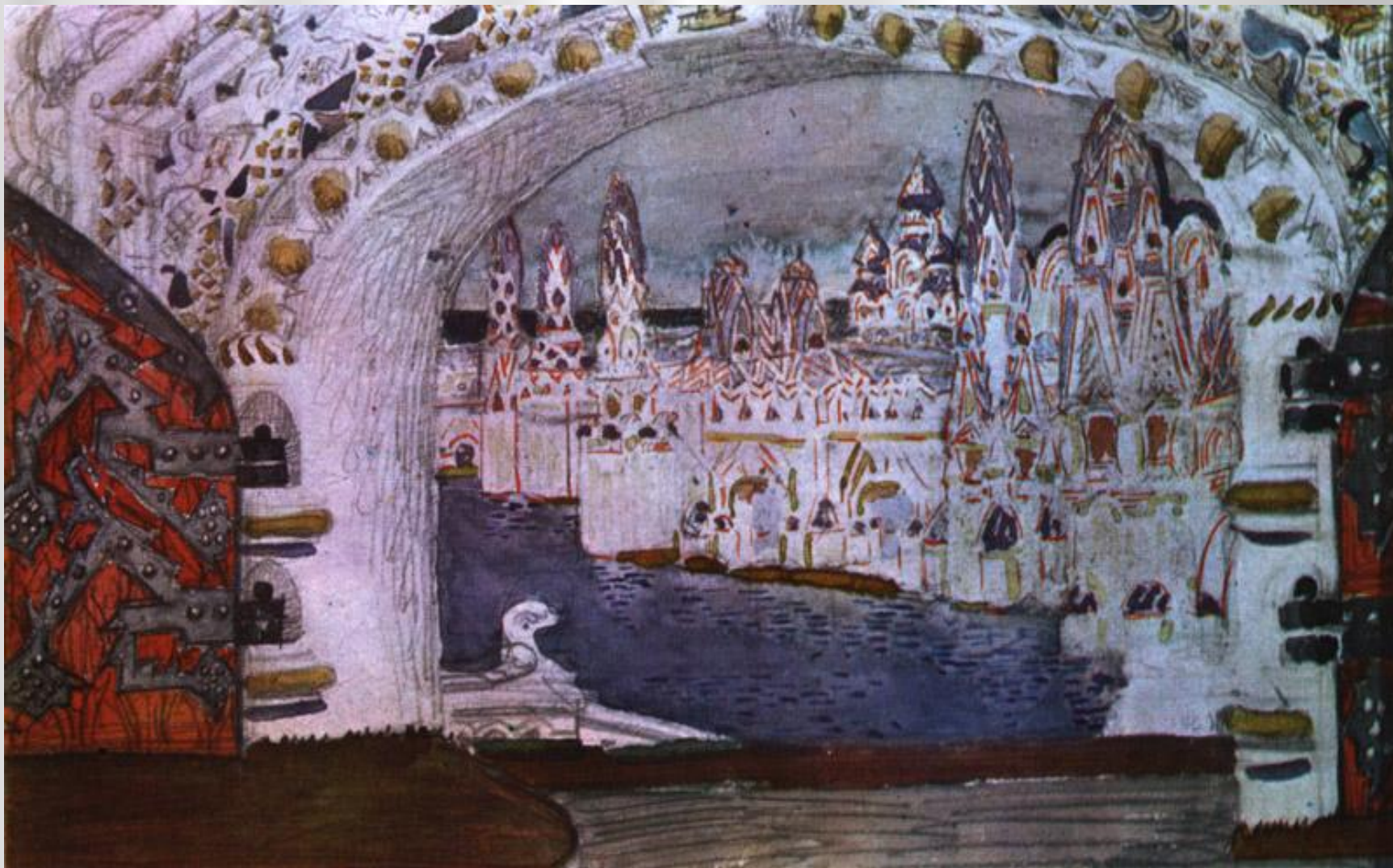
Врубель М.А. Эскиз декорации к опере Н.А.Римского-Корсакова «Сказка о царе Салтане»