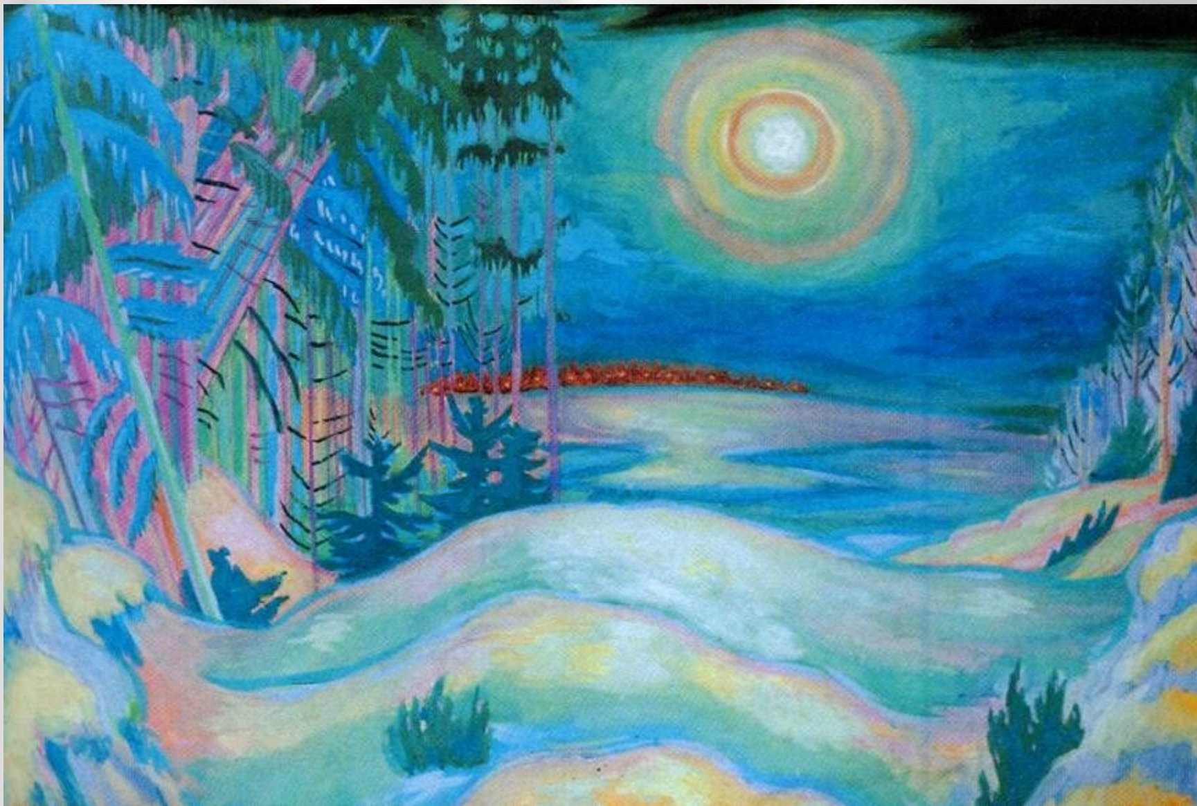
Д.Стеллецкий. Эскиз декорации к опере Н. Римского-Корсакова «Снегурочка»