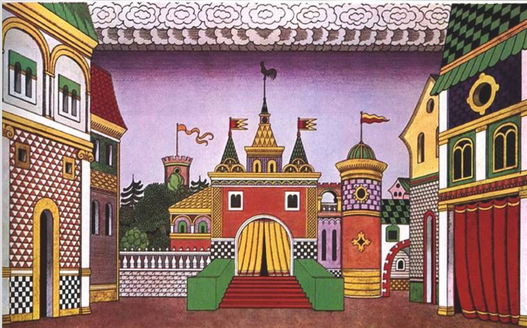
Билибин И.Я. Эскиз декорации к опере Н.А.Римского-Корсакова «Золотой петушок»