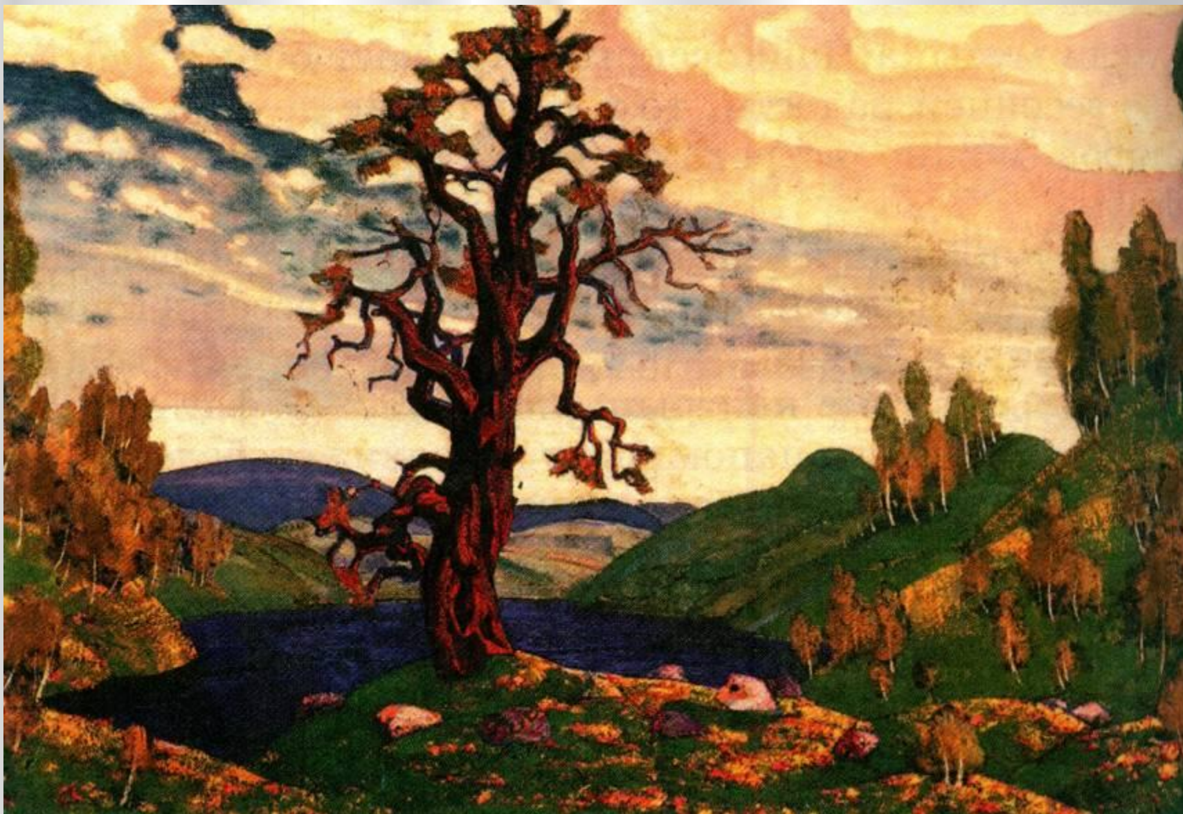
Н.Рерих. Декорация к балету И.Стравинского «Весна священная»