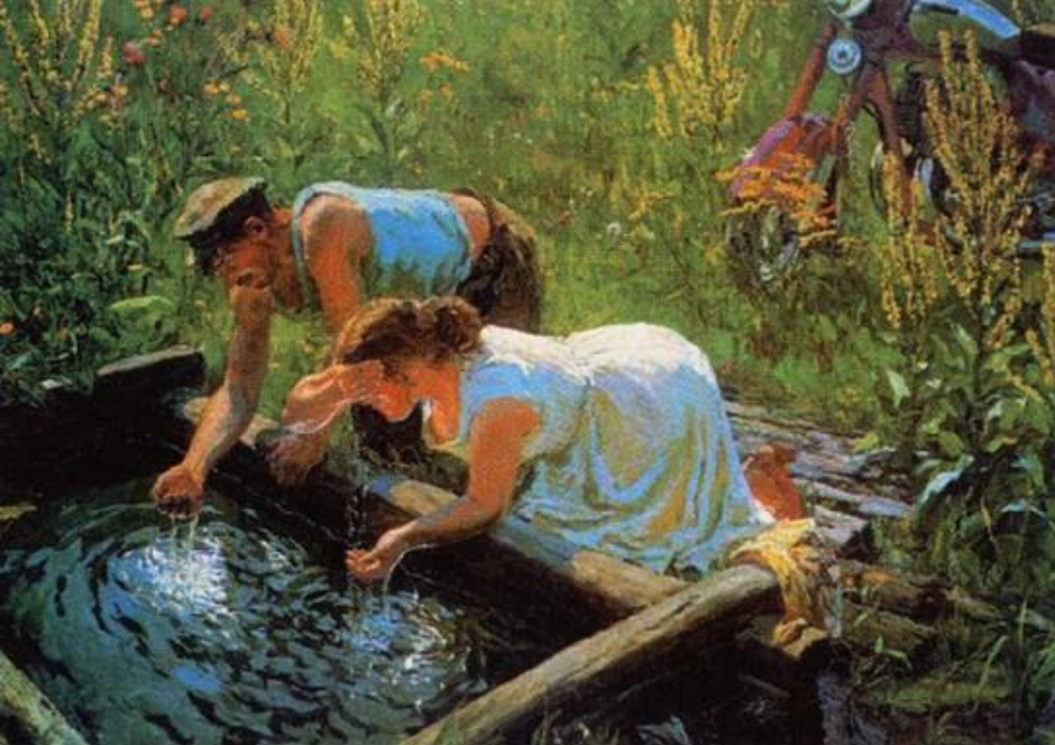
А. Пластов. Полдень

В зависимости от сюжета А.Пластов использует то буйную игру красок, цвета, и тогда всё на полотне залито солнцем, радугой красок, то пишет в сдержанном колорите. Но в любом случае его изображение – сама правда жизни.