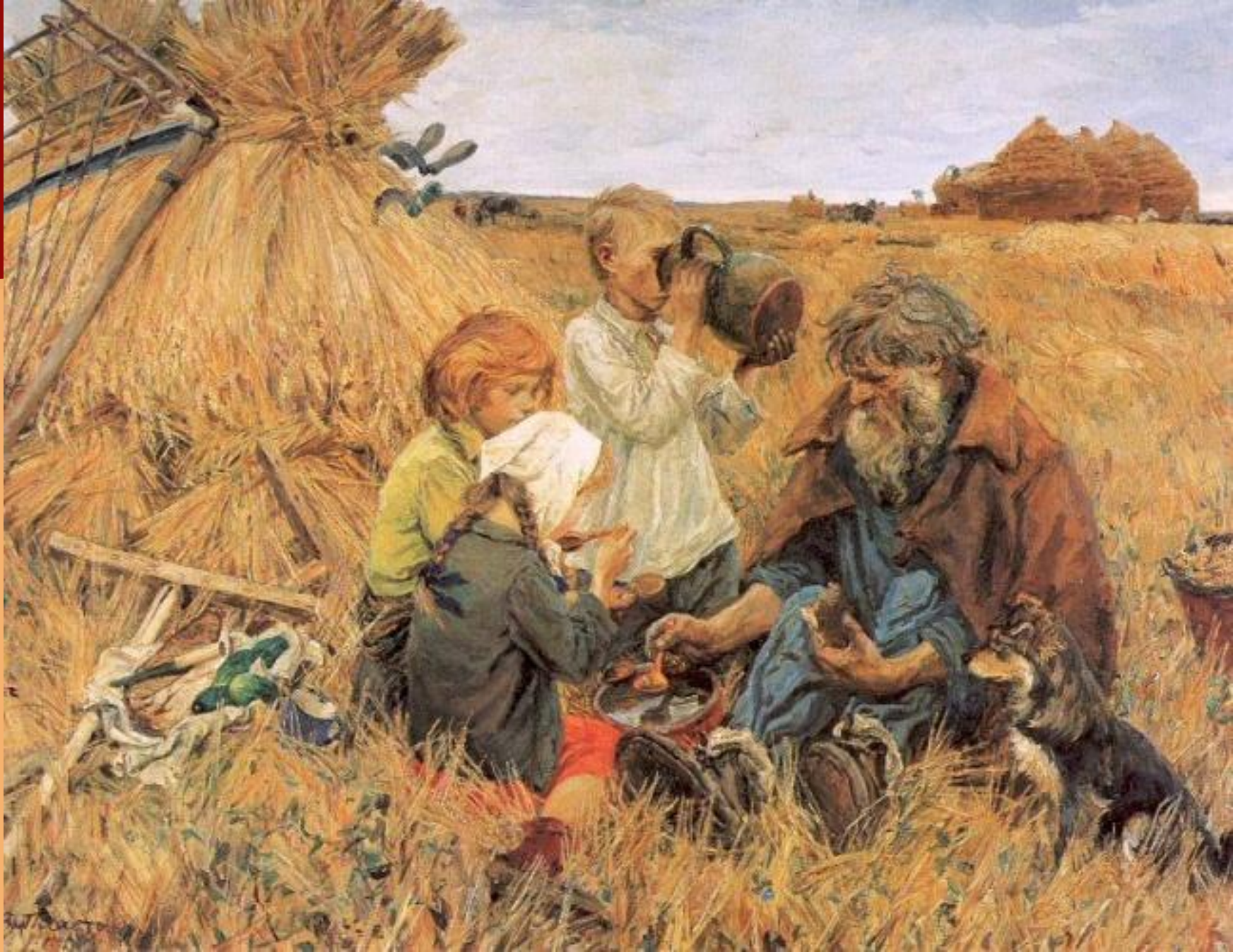
А. Пластов. Жатва