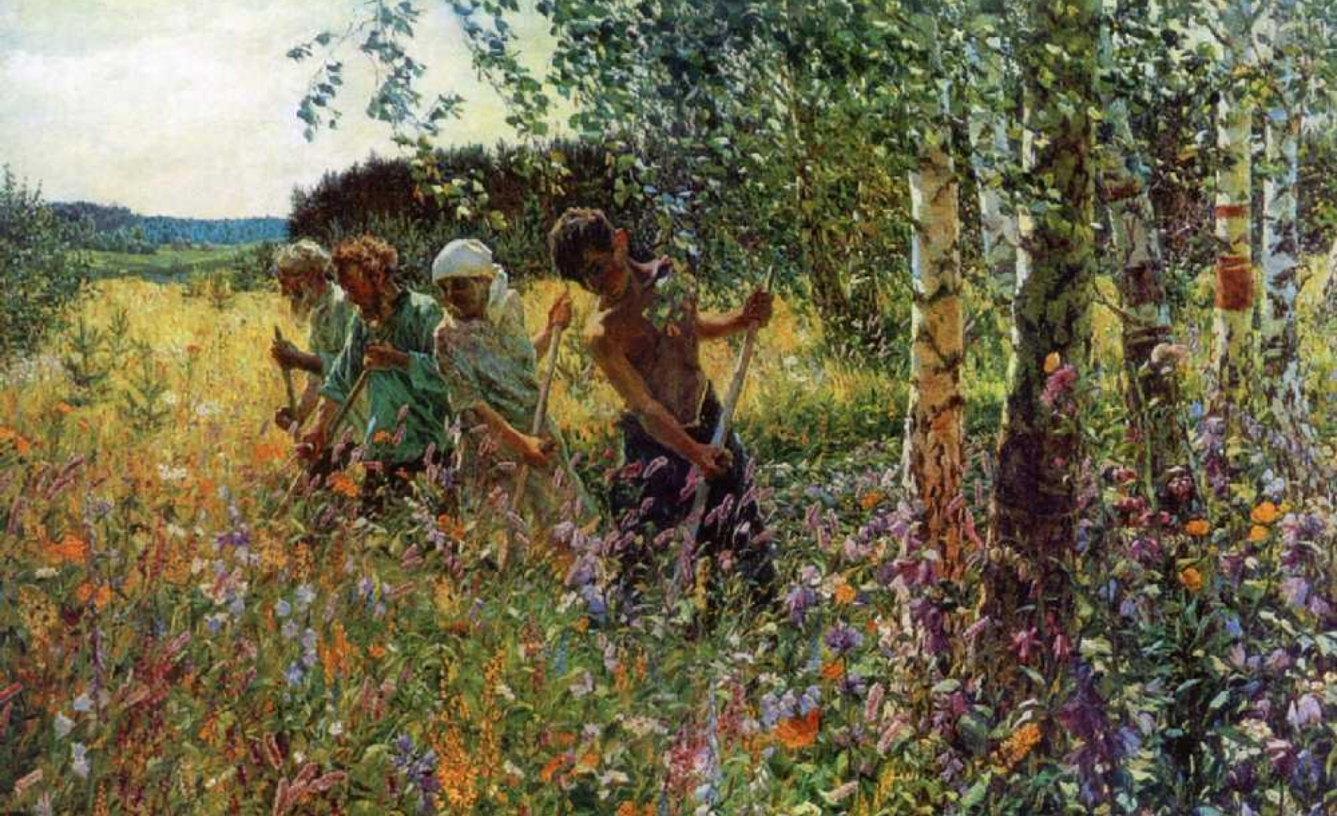
А. Пластов. Сенокос