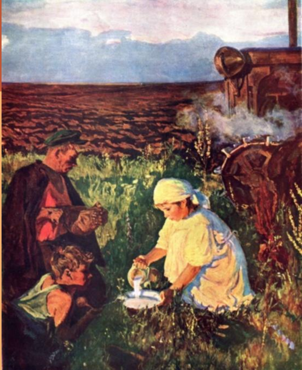
А. Пластов. Ужин тракториста.