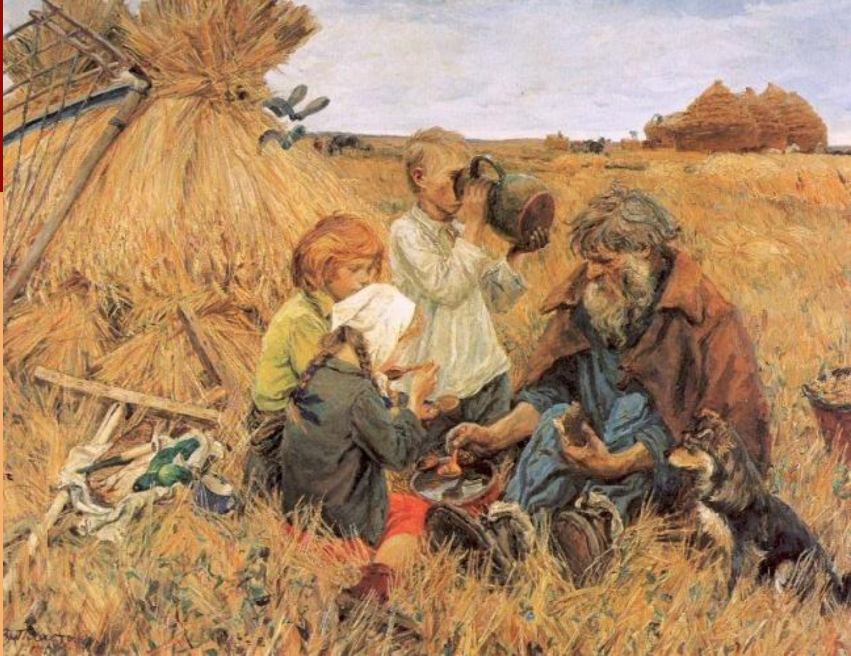
А. Пластов. Жатва