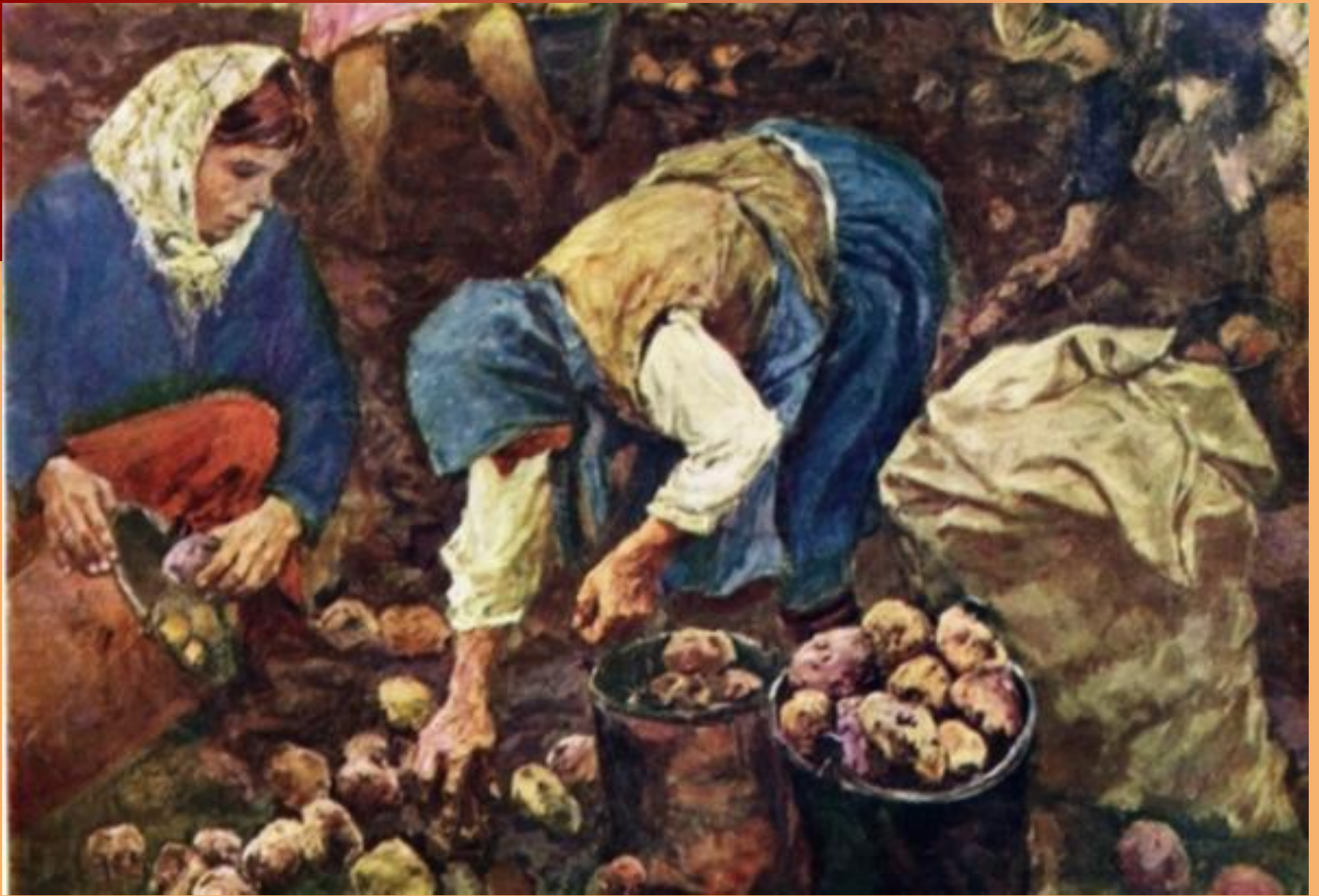
А. Пластов. Сбор картофеля