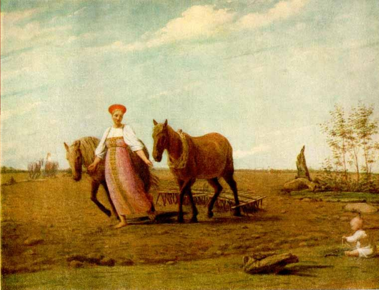
А. Венецианов. На пашне. Весна

Красотой и покоем наполнена картина. После зимнего отдыха проснулись поля, земля напиталась влагой, на деревьях зеленеет молодая весна, по небу плывут лёгкие облачка. Крестьянка, вышедшая боронить, ведёт двух золотистых лошадей. Она с нежной улыбкой смотрит на играющего ребёнка. Освещённая солнцем крестьянка в праздничном наряде сама похожа на радостно шагающую по земле весну.