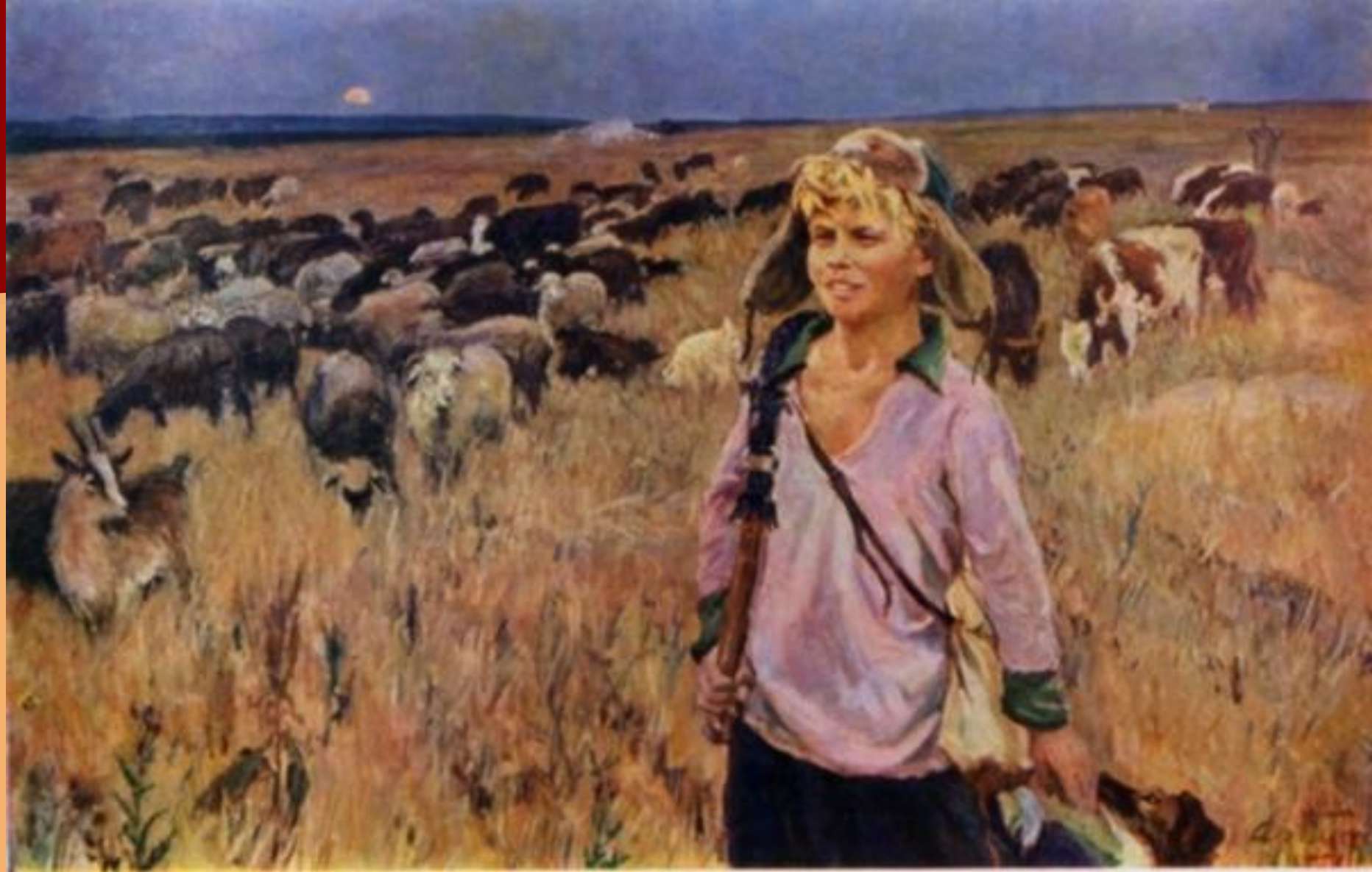
А. Пластов. Витя-подпасок