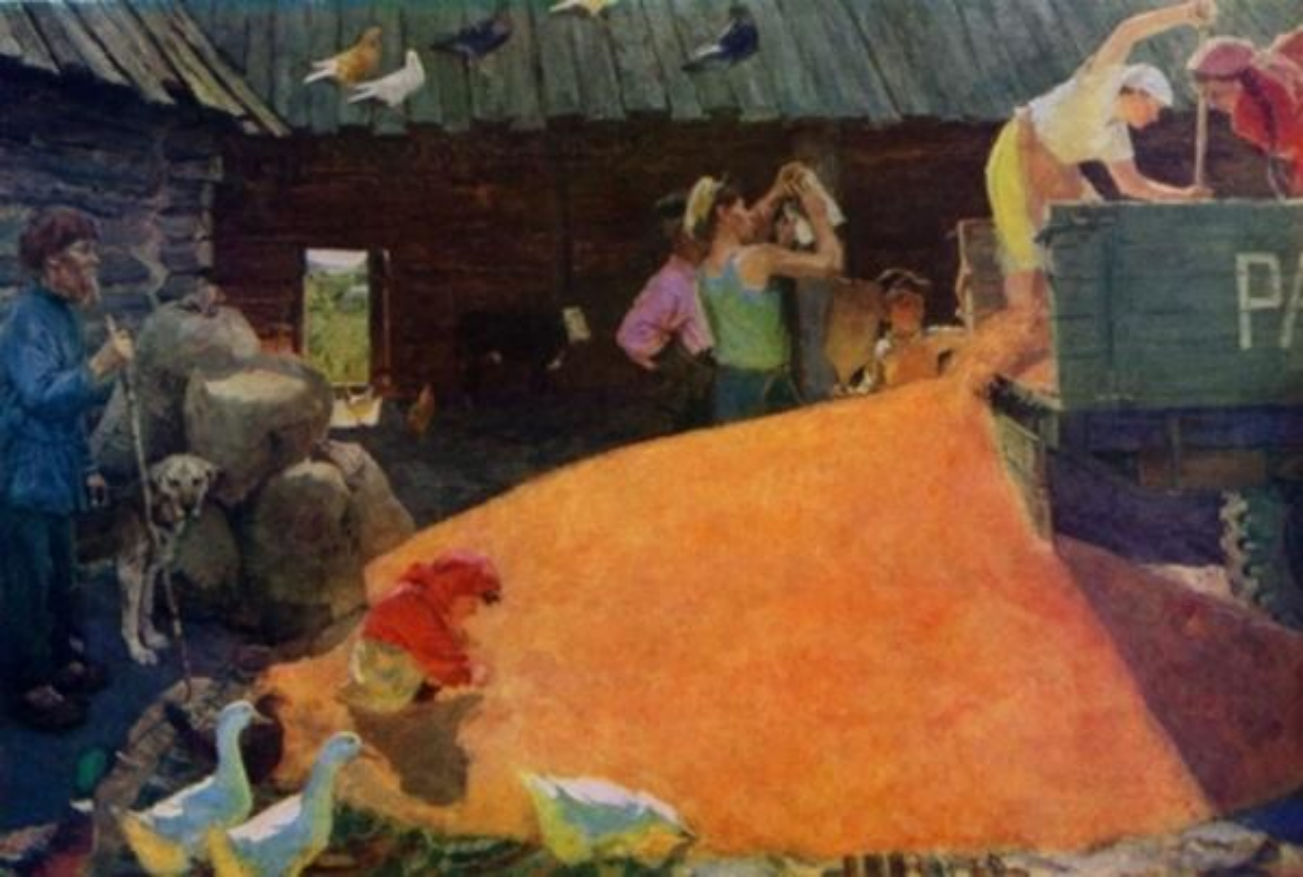
А. Пластов. Август колхозника