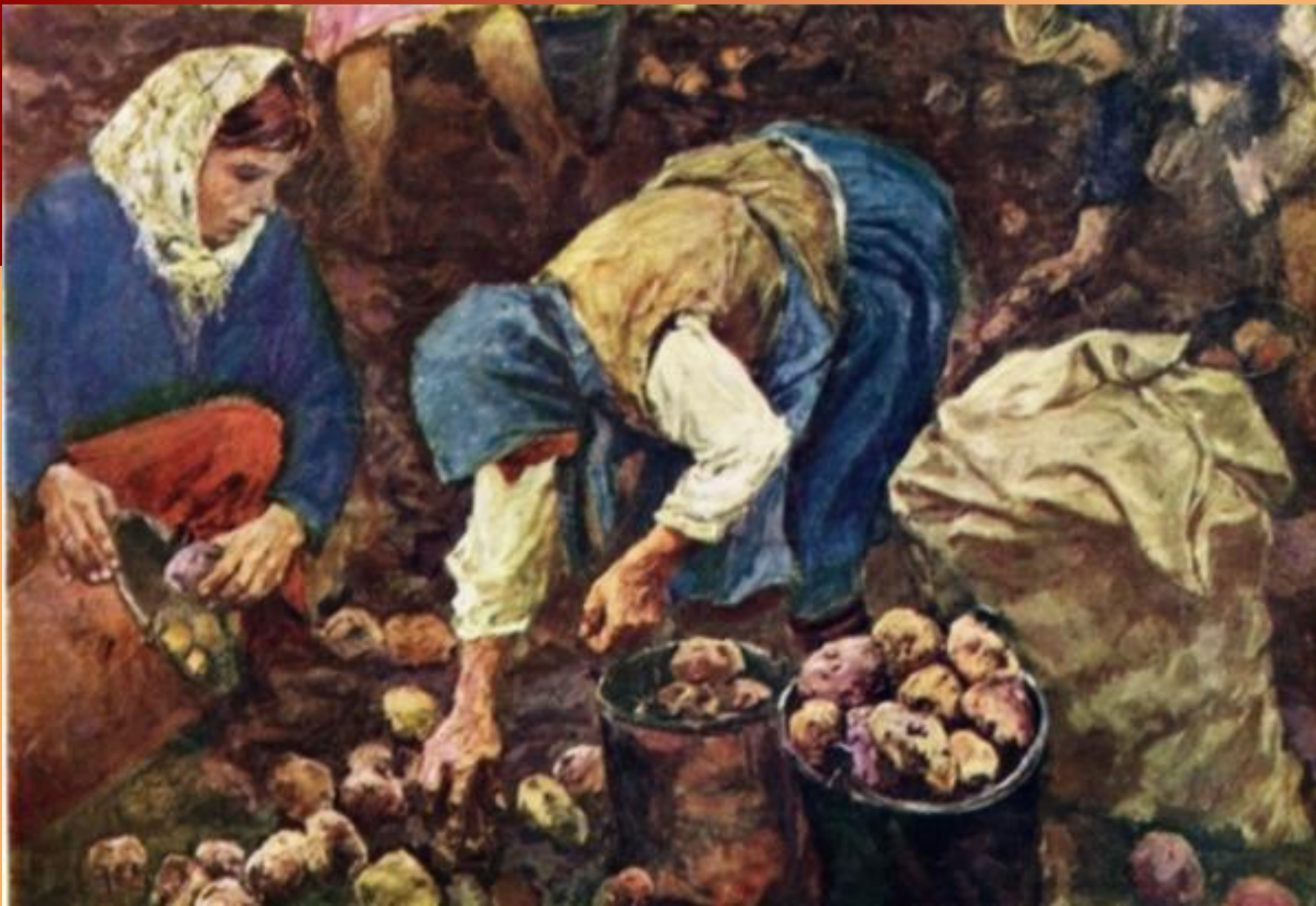
А. Пластов. Сбор картофеля