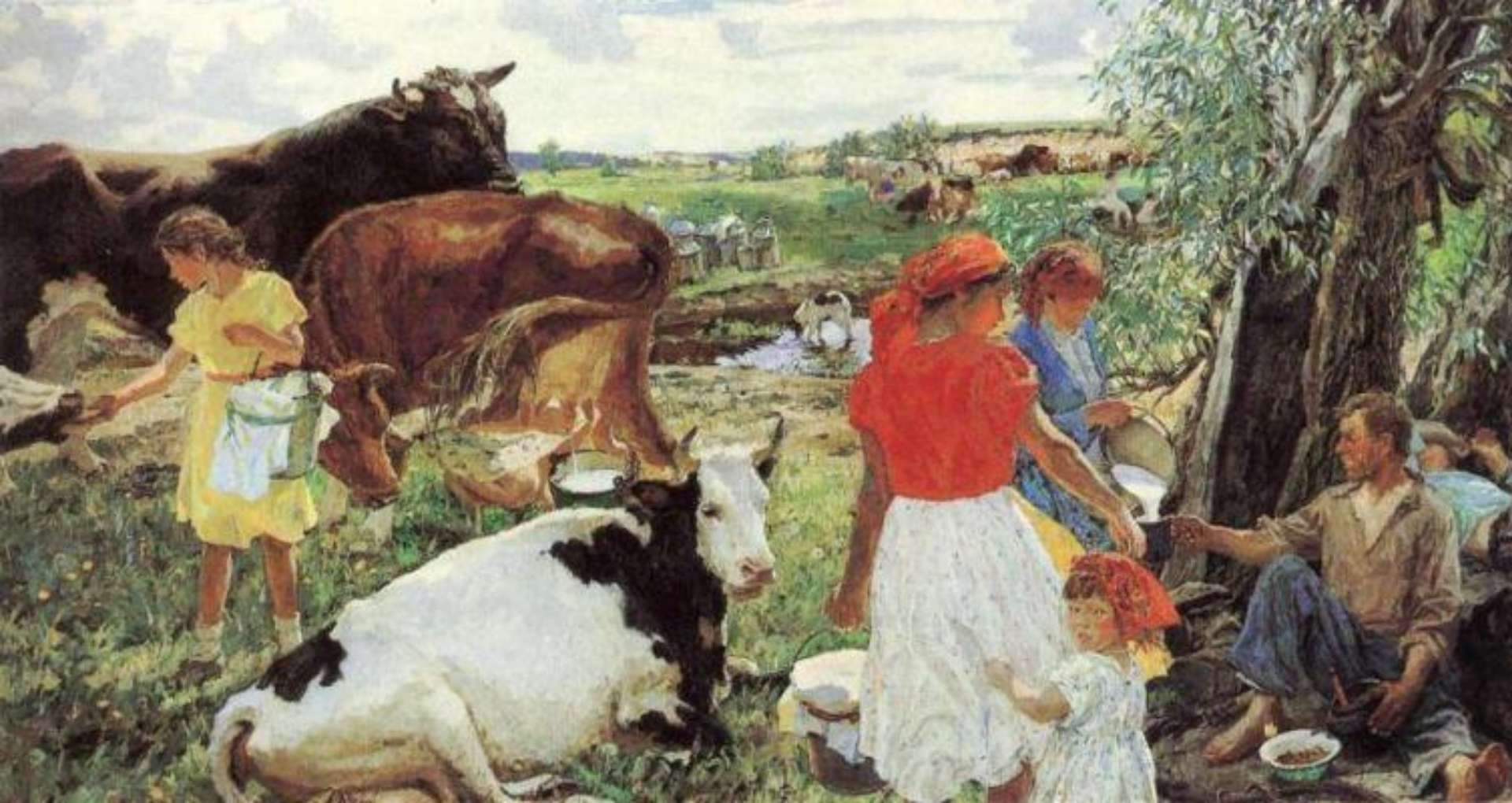
А. Пластов. Лето