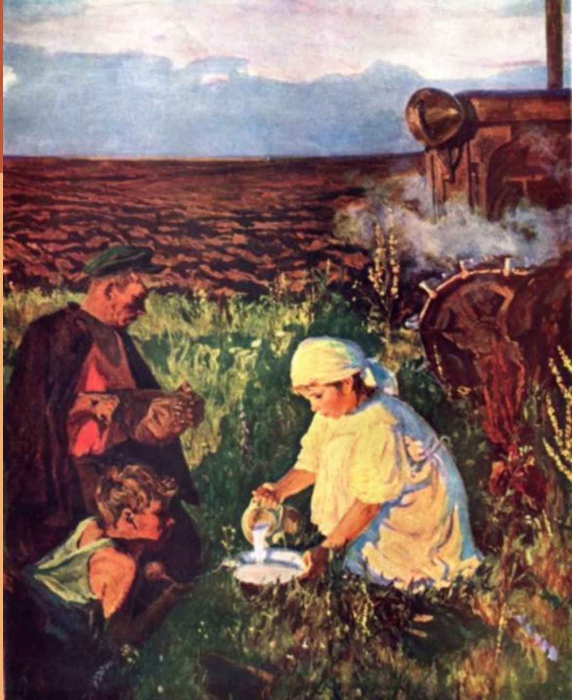
А. Пластов. Ужин тракториста.