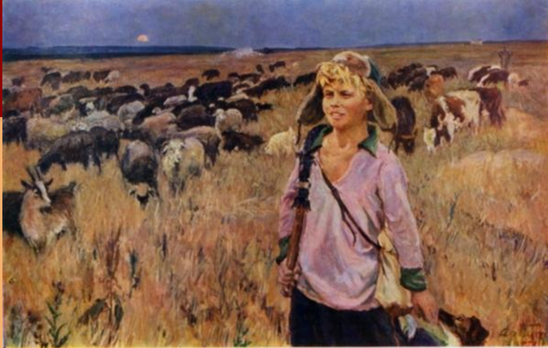
А. Пластов. Витя-подпасок