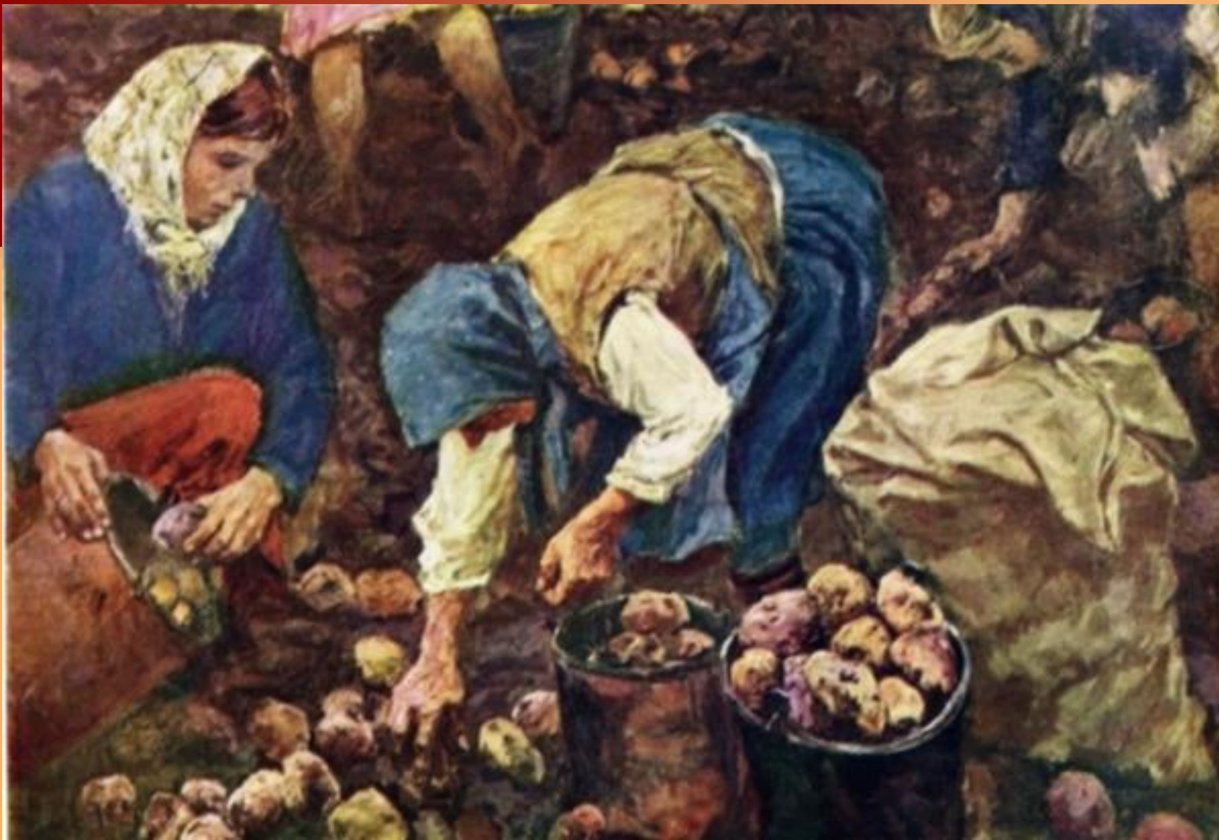
А. Пластов. Сбор картофеля