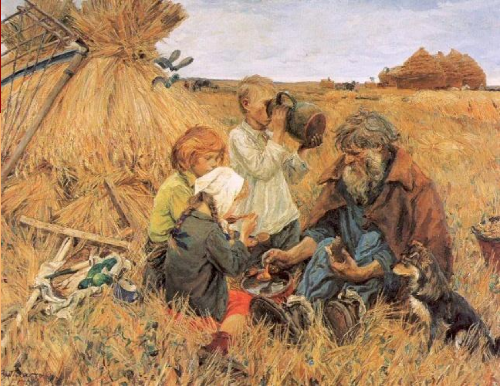
А. Пластов. Жатва