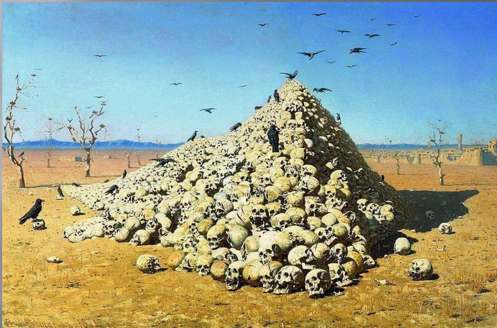
В. В. Верещагин. «Апофеоз войны» (1878)

Известнейшее полотно серии, «Апофеоз войны» (1870-71, Третьяковская галерея), — с грудой черепов на фоне пустынных, безжизненных горизонтов, — снабжено красноречивой надписью на раме: «Посвящается всем великим завоевателям: прошедшим, настоящим и будущим».