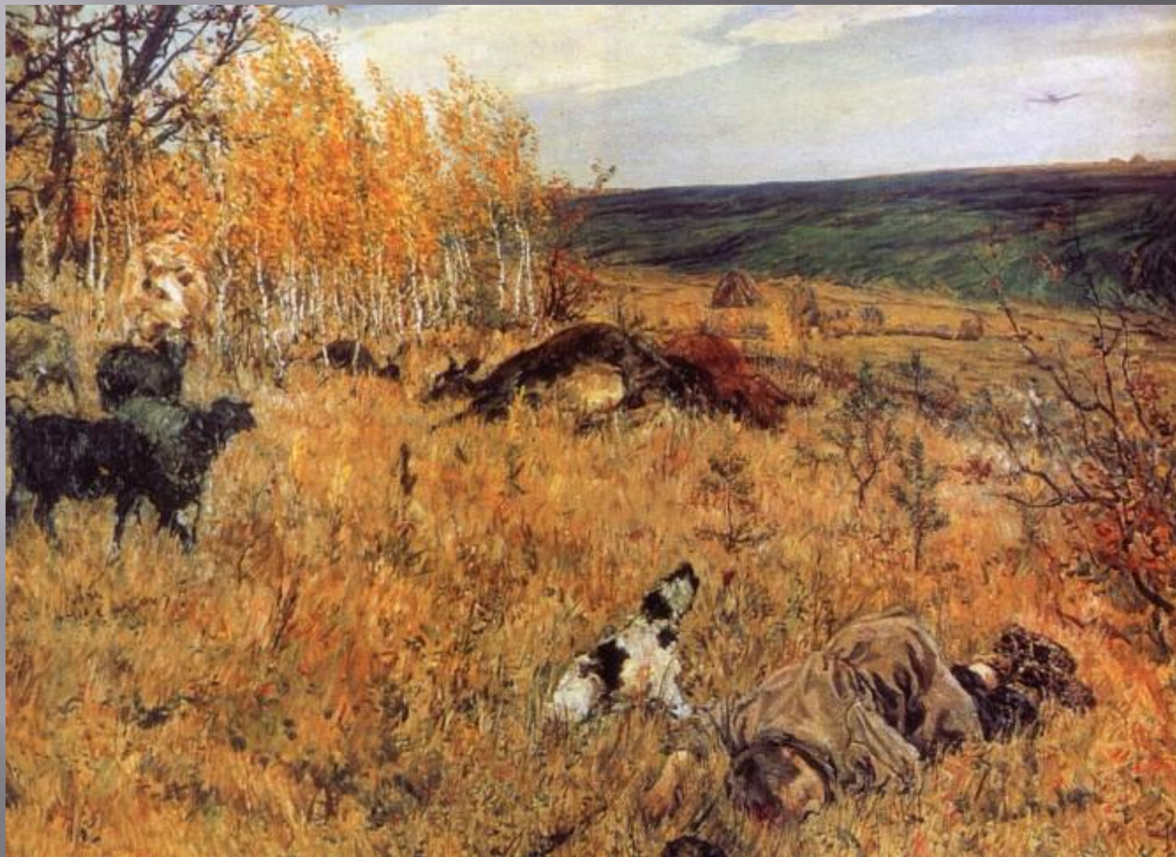
Пластов А. «Фашист пролетел» 1942