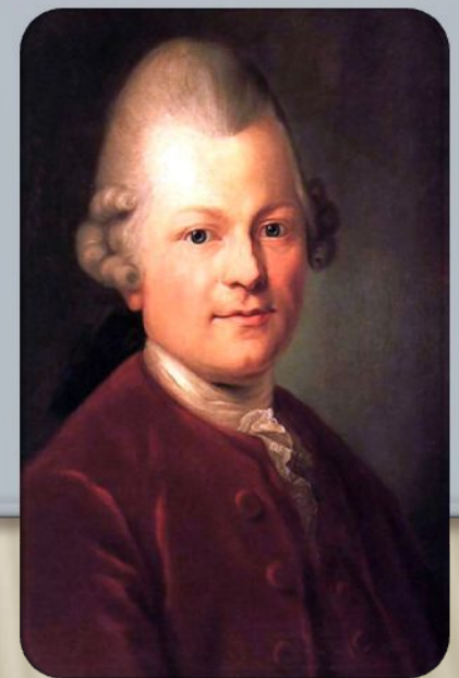
Лессинг «Эмилия Галотти»