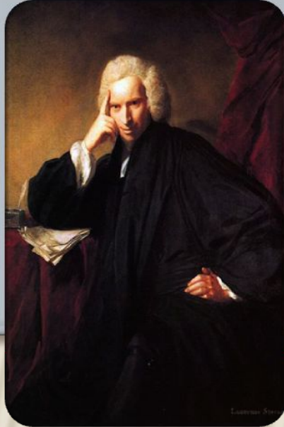
Л. Стерн «Сентиментальное путешествие»