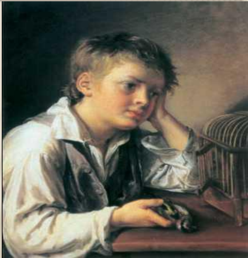
В. А. Тропинин. «Мальчик, тоскующий об умершей птичке».

Подготовил почву для рождения романтизма