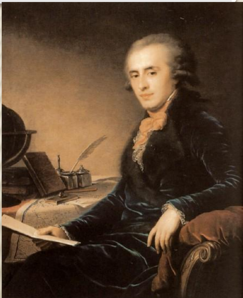
И.-Б. Лампи-старший. Портрет князя П.А. Зубова.