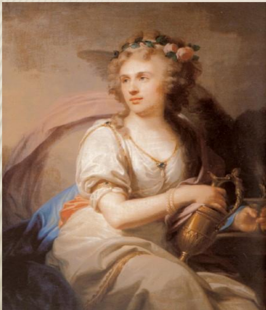
И.-Б. Лампи-старший. Портрет княгини Е.Ф. Долгорукой в виде Гебы.