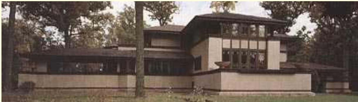
Дом Уиллитса (Willits House). Чикаго, 1902 год. Общий вид