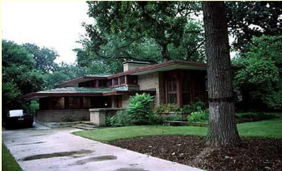
Дом Изабеллы Робертс (Isobel Roberts House). Риверсайт-Форест (Иллинойс), 1907 г. Общий вид.

«Хорошее здание – величайшая поэма, когда оно является выражением органической архитектуры».