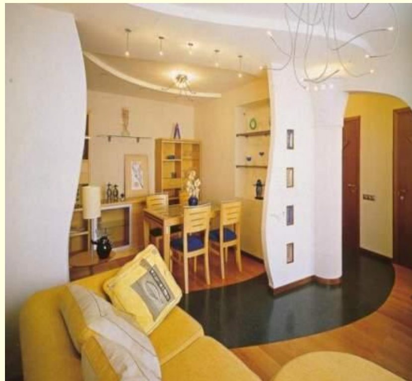
Модерн (внутренний интерьер)

это общность образной системы, средств художественной выразительности, творческих приемов, обусловленная единством идейно- художественного содержания