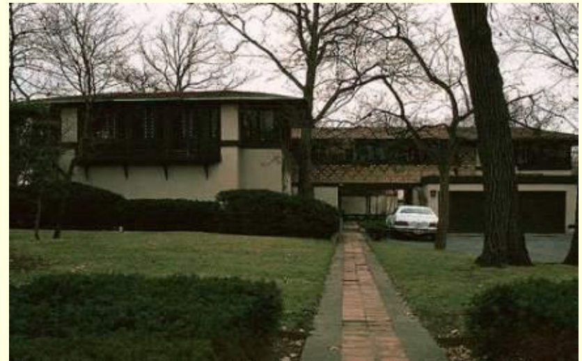
Дом Кунли (Coonley House). Риверсайт, 1908 год. Общий вид.