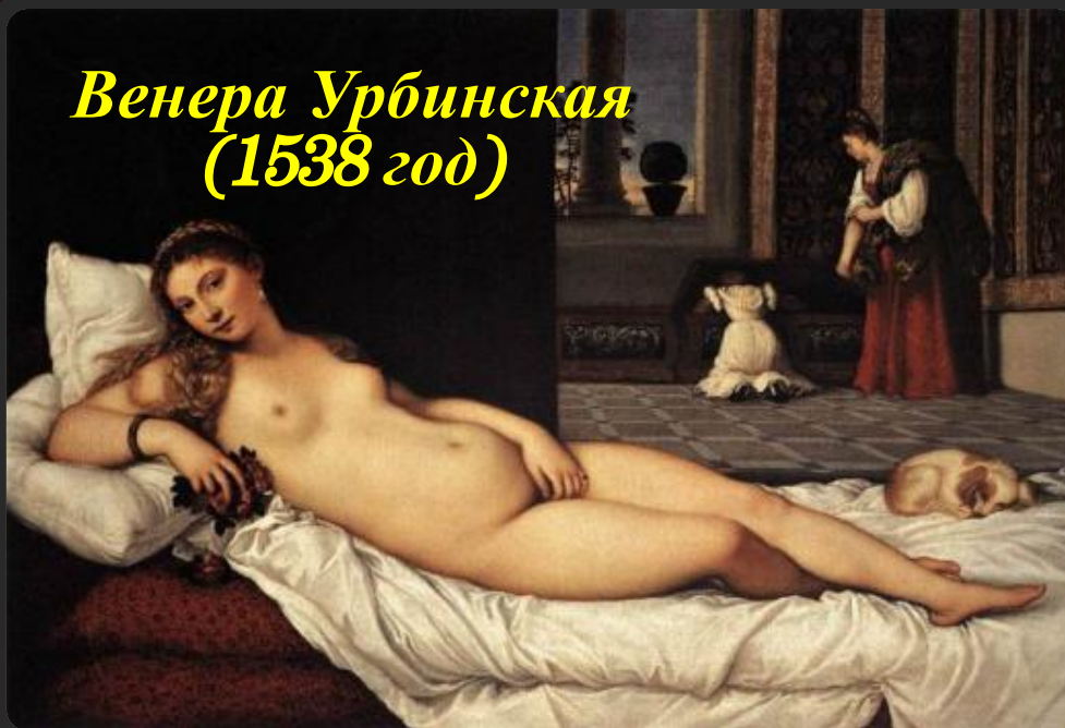
Венера Урбинская (1538 год)

Картину Тициана Венера Урбинская можно сопоставить с Венерой Джорджоне: у Тициана богиня изображена проснувшейся, она полулежит на своем ложе в изысканно убранной комнате. Прекрасная женщина представлена величавой, исполненной чувства собственного достоинства, но ее изображение уже не вызывает ощущения тайны, как в картине Джорджоне.