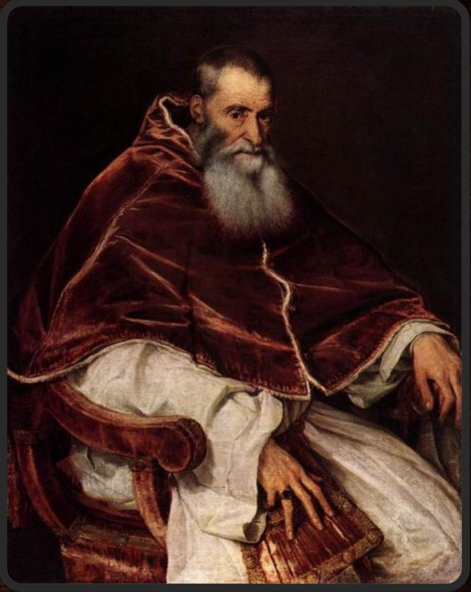
Портрет папы Павла III (1545-1546 гг.)

На неоконченном Портрете папы Павла III с Алессандро и Оттавио Фарнезе (1546, Неаполь, Национальный музей и галерея Каподимонте) представлен немощный, но хитрый старик, которого пытаются обмануть двуличные услужливые родственники.