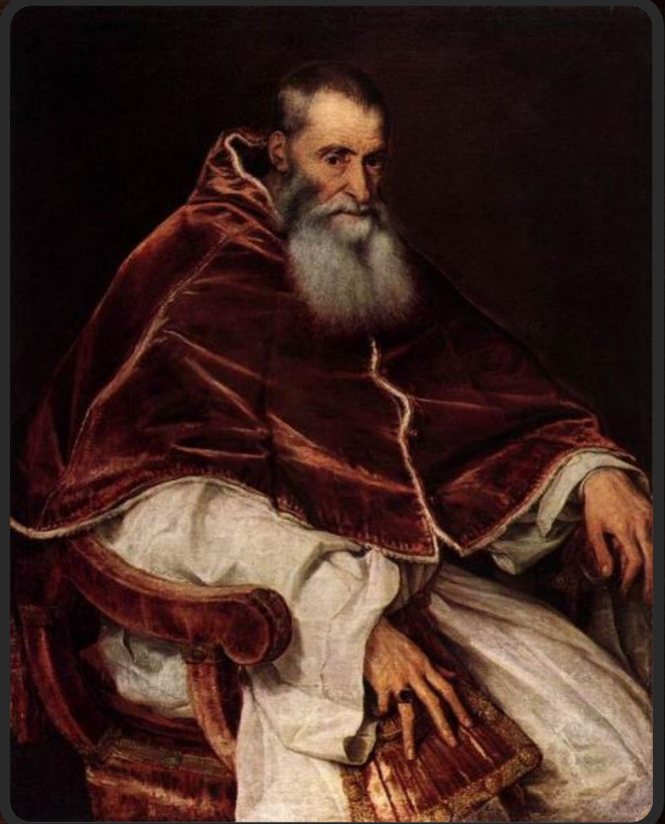
Портрет папы Павла III (1545-1546 гг.)

На неоконченном Портрете папы Павла III с Алессандро и Оттавио Фарнезе (1546, Неаполь, Национальный музей и галерея Каподимонте) представлен немощный, но хитрый старик, которого пытаются обмануть двуличные услужливые родственники.