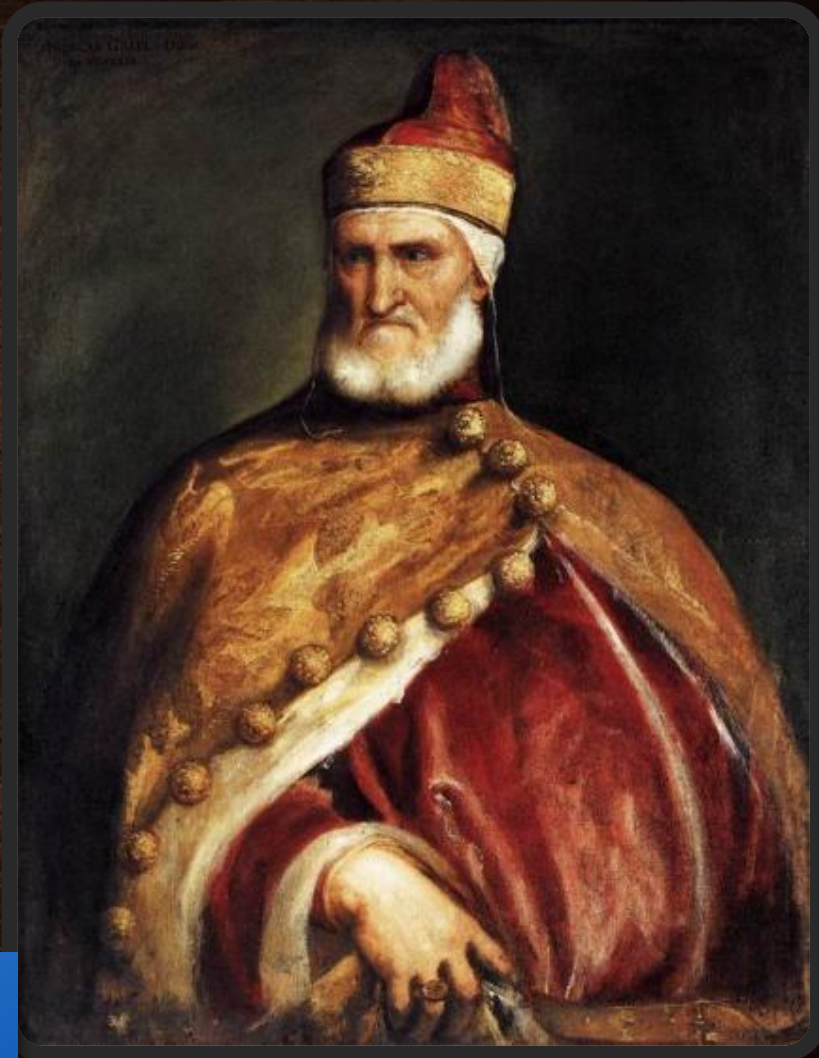
Портрет инквизитора дожа Андреа Гритти

Дожд (итал. doge — «вождь, предводитель») — титул главы государства в итальянских морских республиках — Венецианской, Генуэзской и Амальфийской. Догат — время правления дожа..