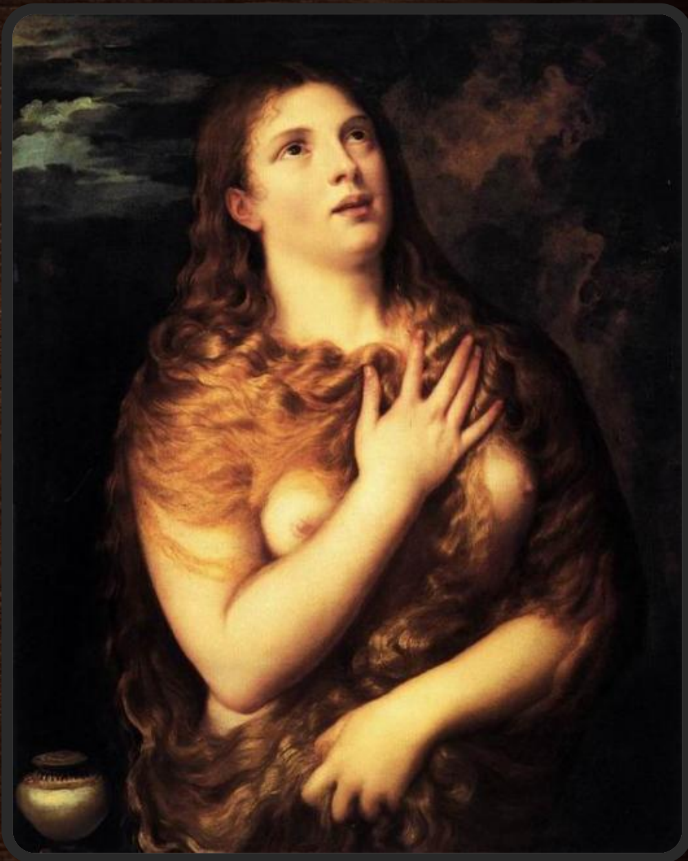
Святая Мария Магдалина

В 1530-е годы Тициан создает полотна, совершенные с точки зрения живописной техники. Картина Введение Марии во храм (1534–1538, Венеция, галерея Академии) для Скуола делла Карита представляет собой яркий, праздничный образ, в котором архитектура как будто образует обрамление для многочисленных портретных изображений. Это произведение вызывает в памяти городские виды и изображения венецианских праздников у Карпаччо и Джентиле Беллини и предвещает сцены пиров Веронезе.