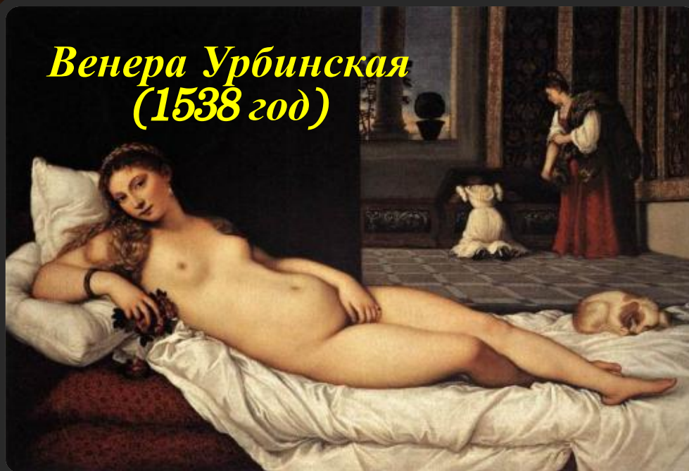
Венера Урбинская (1538 год)

Картину Тициана Венера Урбинская можно сопоставить с Венерой Джорджоне: у Тициана богиня изображена проснувшейся, она полулежит на своем ложе в изысканно убранной комнате. Прекрасная женщина представлена величавой, исполненной чувства собственного достоинства, но ее изображение уже не вызывает ощущения тайны, как в картине Джорджоне.