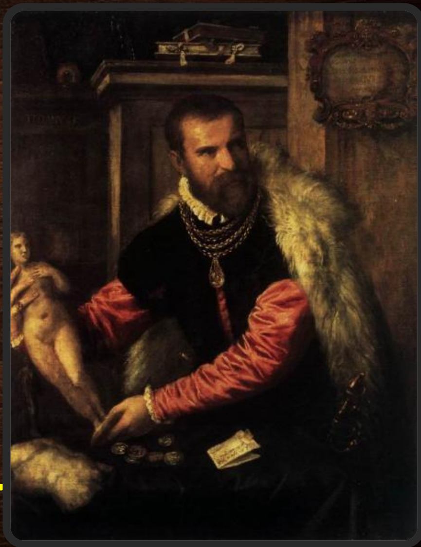
Портрет Якоба Страда

Портреты Тициана, исполненные в течение 1520-х годов, выглядят более камерными. Обычно, как в Мужском портрете (Лондон, Национальная галерея), в них акцентируются черты личности модели.